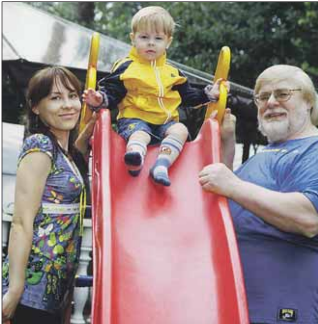
С женой и сыном

— Распоряжение на срочное создание моего центра было отдано лично Николаем Ивановичем Рыжковым в 1988 году. В то время я уже был хорошо известен за рубежом не только как цирковой артист: я регулярно давал рекомендации и обучал больных по методике, благодаря которой в своё время восстановился сам. Первый реабилитационный центр, работающий на основе моих методик, был создан в Японии, затем — в Америке. А я тем временем пытался доказать в России, что моя методика работает. Испытания под