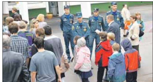
На эвакуацию школьников ушло менее пяти минут

правилам всего этого делать нельзя), а сейчас всё делают без запинки, даже с опережением графика (нормативное время для этой школы — 5 минут). Аналогичные репетиции пройдут в сентябре во всех окружных школах.