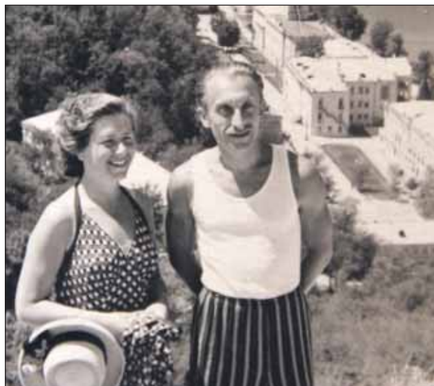
1954 год, Украина. Гора Артём

будущими учителями. Его уже несколько раз вызывали в военкомат, но на фронт так и не забрали. Почему, узнал спустя годы. Отца — участника Гражданской войны, главного инженера-механика завода «Серп и молот» — в 1937 году репрессировали и расстреляли на Бутовском полигоне. Сына с польскими корнями и такими не советскими именем и фамилией сочли неблагонадёжным для отправки на передовую. На первых порах молодого человека направили рыть окопы, устанавливать противотанковые ежи в Подмоскovie и на улицах города. Когда возникла угроза боевых