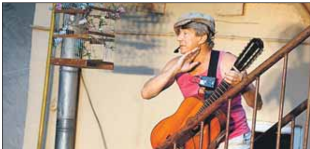
Сцена из спектакля «Песни нашего двора»

покажет спектакль «Песни нашего двора». На импровизированных подмостках актёры театра разыграют жизнь москвичей в 1930-1960-е годы. В спектакле звучат старые и всеми любимые песни «Постой, паровоз», «В этом доме большом», «Конфетки-бараночки» и многие другие. Композицию на стихи Юза Алешковского «Товарищ Сталин, вы большой учёный» по традиции исполнит Марк Розовский. Вход на спектакль бесплатный. Константин ЧУПРИНИН