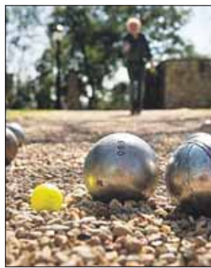
Можно будет сыграть в петанк

Гости смогут послушать французский джаз у бассейна и концерт шансонье на главной сцене. Тут же будет работать блошиный рынок La Vie