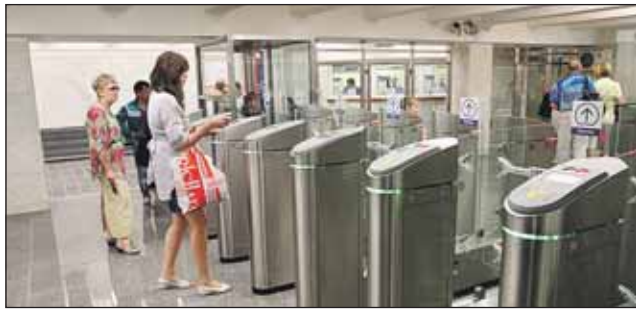
Заменили турникеты и эскалаторы

Сроки открытия южного вестибюля станции «Бабушкинская», закрытого на пла-