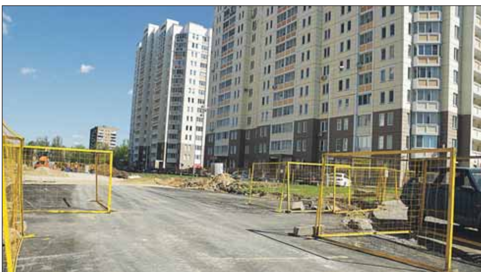
Согласно Генплану улица Большая Марфинская должна соединиться с улицей Академика Королёва

«ЗБ» уже рассказывал, что строительство дороги (она соединит улицы Большую Марфинскую и Академика Королёва) вызвало конфликт. Новые микрорайоны выступили против строи-