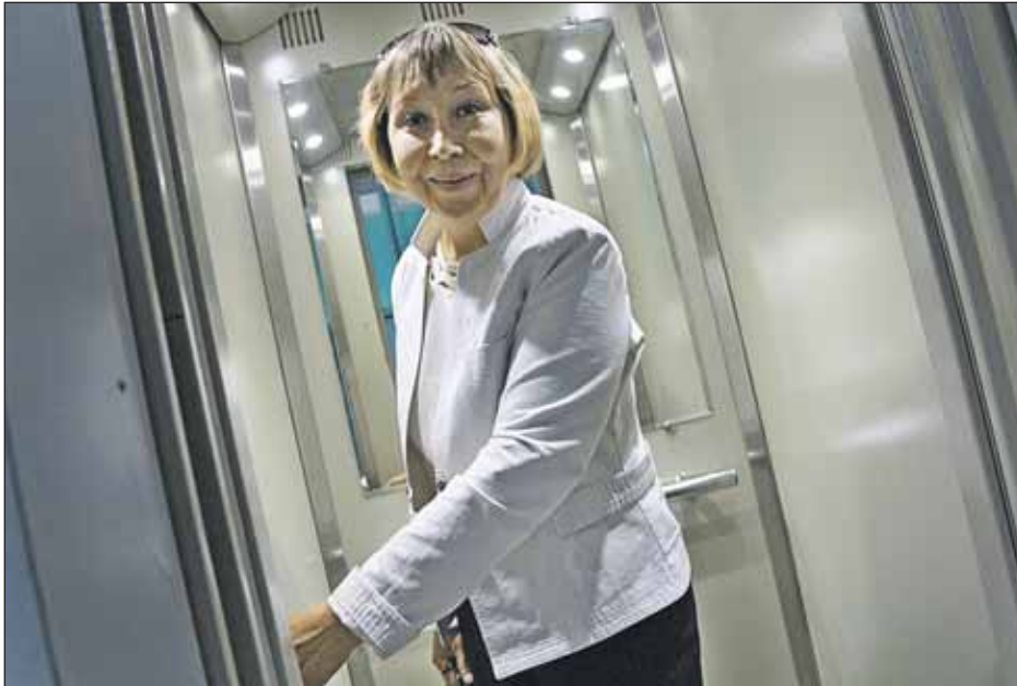
Новый лифт на улице Милашенкова, 10. Программа замены лифтов в Бутырском районе завершится к концу июля

При приёмке лифтов у специалистов «Мослифта» возникают серьёзные претензии. Это нарушение сроков их сдачи и не соответствующее нормам качество лифтового оборудования ряда мо-