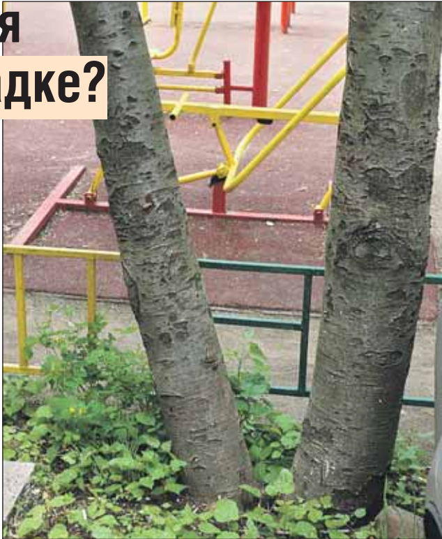
Вот так правильно: дерево в метре от площадки