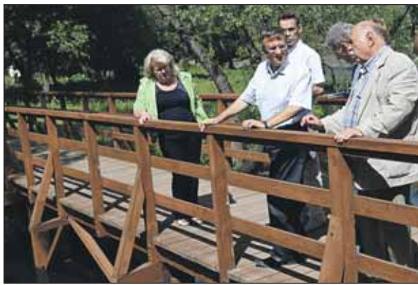
Префект поручил управе Северного Медведкова каждые 4 часа inspectировать ход работ

Префект СВАО обошёл зелёные зоны в пойме реки Яузы и проинспектировал ход работ по их благоустройству. Уже этим летом на территории Северного Медведкова и Бабушкинского района появится уникальная единая парковая зона протяжённостью около 8 километров. Сегодня здесь ведутся активные работы силами подрядных организаций.