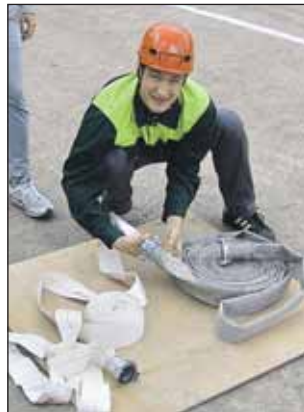
Студент МИИТа на учениях

Продолжается набор в добровольную пожарную дружину. Всех добровольцев бесплатно учат пользоваться различными огнетушителями, пожарными рукавами, проводить эвакуацию и оказывать первую помощь. Задача добровольцев — заниматься профилактикой, но при случае они могут принять участие и в настоящих спасательных операциях.