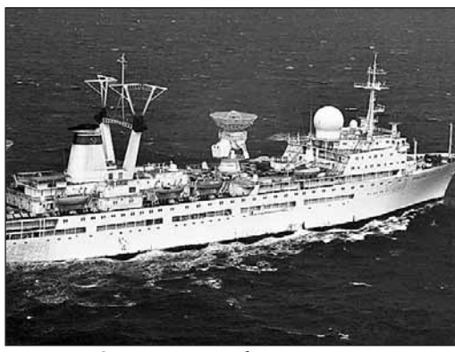
«Академик Сергей Королёв» был спущен на воду в 1971 году. Его макет можно увидеть на выставке

Мемориальный дом-музей академика С.П.Королёва: 1-я Останкинская улица, 28