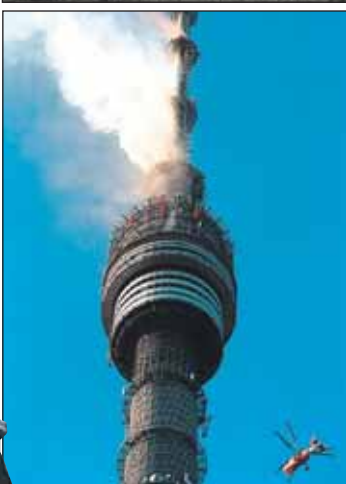
Во время пожара 2000 года лопнуло 50 канатов, удерживающих конструкцию

структоров со скептиками. Никитин стоял на своём. И хотя проект пришлось изменить, всё же при высоте 540 метров Останкинская башня имеет фундамент всего 3,5 метра. Для сравнения: многоэтажные здания в Москве стоят на сваях глубиной 20-30 метров. А для фундамента здания МГУ на Воробьёвых горах было