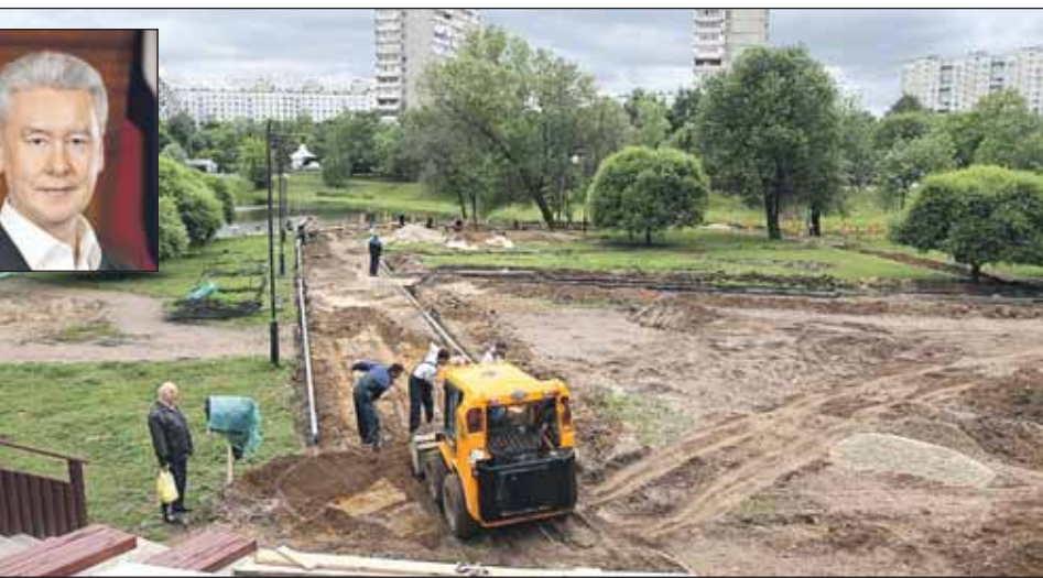
Подготовлено основание под 9 детских площадок, сцену и амфитеатр

Работы в парке начались в мае. Сейчас уже завершено сооружение двух лестниц, железобетонной подпорной стенки и пандуса у главного входа в парк, подготовлено основание под 9 детских площадок, сцену и амфитеатр, поставлены опоры 3 новых мостов через Чермянку. Сейчас рабочие настилают деревянные мостки, обу-