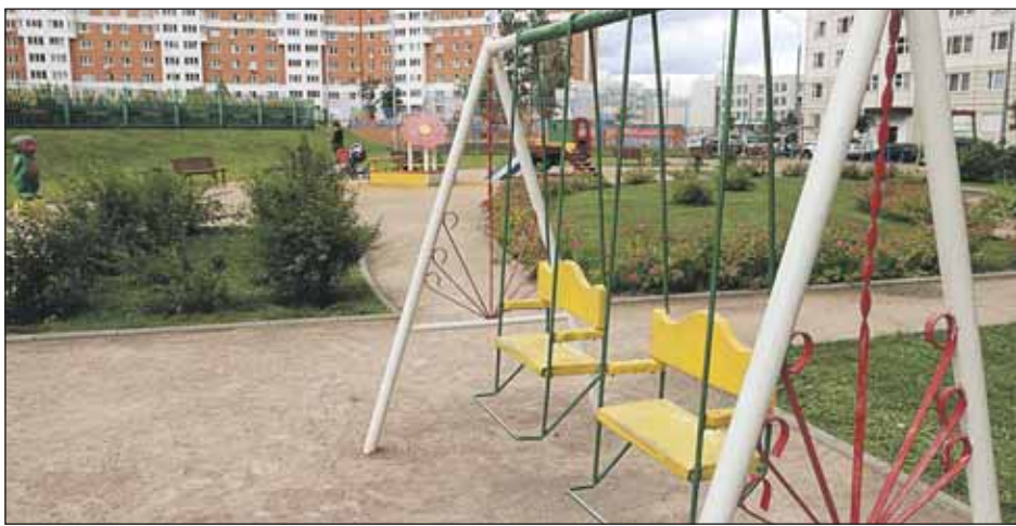
Качели на Псковской снабдят ограничителями

Площадка во дворе опасна! Горки высотой 2,5 м без бортиков, качели без ограничителей, дети крутят на них «солнце» и вываливаются. Тренажёр с тяжёлыми гириями застревает в верхнем положении, а потом сам собою падает, как гильотина. Жители дома 7, корп. 1, по Псковской ул.