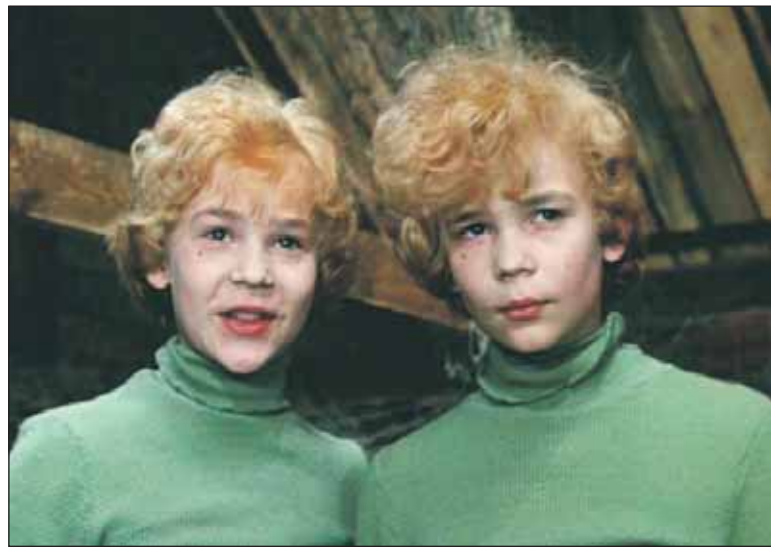
Кадр из фильма «Приключения Электроника»

ском никеле», потом в администрации Красноярского края, потом бизнес (мы строим в Новосибирске многоэтажный микрорайон). Но и там я жил не постоянно, а летал туда-обратно: закрывал квартиру в Москве и уже через 6 часов открывал сибирский офис. К счастью, современные средства коммуникации не требуют твоего постоянного присутствия на рабочем месте.