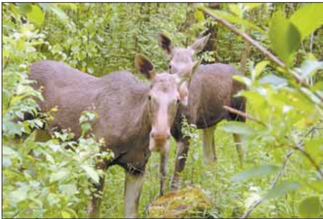
Места массового обитания животных — лосей, оленей, кабанов — планируется оградить

Рекреационная группа «Ярославская» начнётся прямо у МКАД. В радиусе 100-300 метров от существующего ныне эколого-просветительского центра «Русский быт» обустроят 4 пикниковые зоны с мангалами, столами, скамейками, 3 спортивные, в том числе с полями для игровых видов спорта и с уличными тренажерами, 2 детские с игровыми городками, качелями, каруселями, песочницами. Но центром зоны станет конный двор.