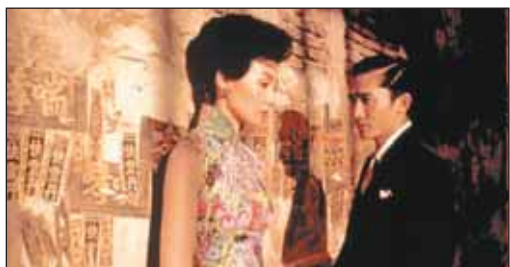
Кадр из фильма «Любовное настроение»

В клубе каждый четверг будут показывать, как классические, так и современные ленты, оставившие след в кинематографе. Формат предполагает перед сеансом встречу с критиком, который расскажет зрителям о фильме, режиссёре и актёрах. После показа будет обсуждение фильма. С августа клуб также предложит ночные показы под названием «Ночь умного кино».