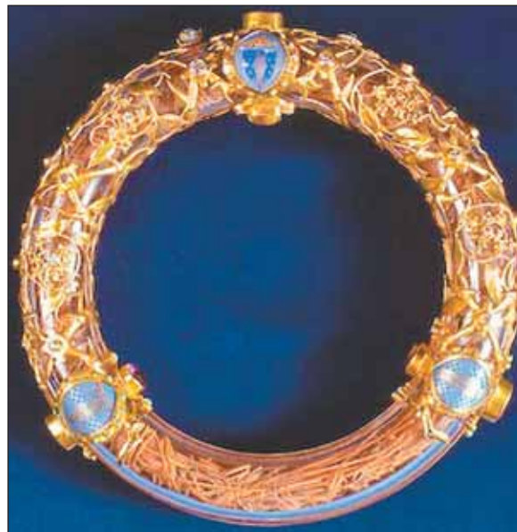
Терновыи венец — тоже православная святыня

кой нашего текста и ироническим присловьем «Россия — родина слонов», и тут же сказано, что у католиков в отличие от православных нет никаких ограничений на пользование «чужими» свечами, можно ставить да-