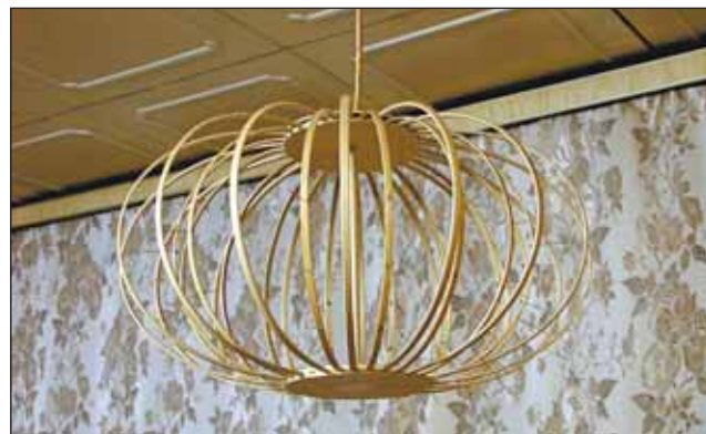
Знаменитая люстра Чижевского

Звёздный бульвар, дом 12, корпус 1, — таков послед-