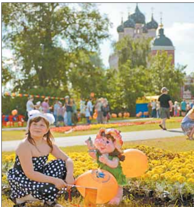
На фестивале представлено 20 композиций

У каждой клумбы — свое название: «Весёлый хоровод», «Территория любви», «Улыбка лета», «Колокольчик». Есть цветники на историческую тему — «Салют, Бородино», есть нацеленные в будущее — «Бозон Хитса». Всего на Церковной Горке, у южного входа метро «ВДНХ», разбито более 20 цветочных композиций. В прошлом году на этом месте был обычный, выжженный солнцем газон, а в этом — разноцветье.