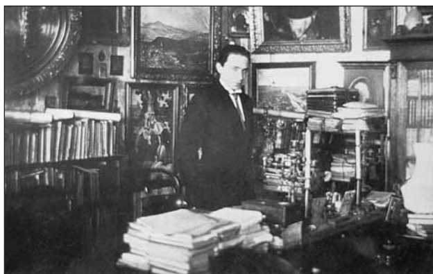
А.Л.Чижевский в своём рабочем кабинете. 1920-1925 годы