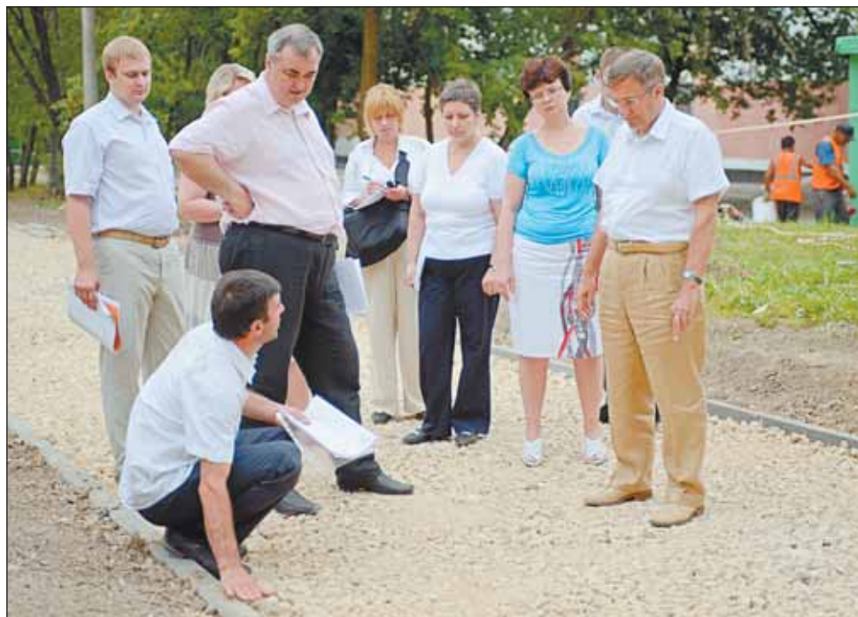
Все работы должны быть завершены к 15 августа