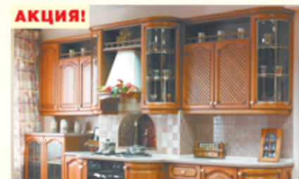
Лучшие белорусские кухни