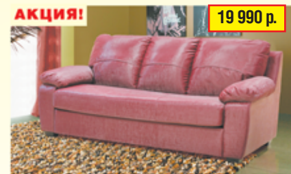
«Питбург», трехместный диван-кровать в искусственной коже с механизмом «французская раскладушка» разм. 1989*900*920, с/м 1350*1860