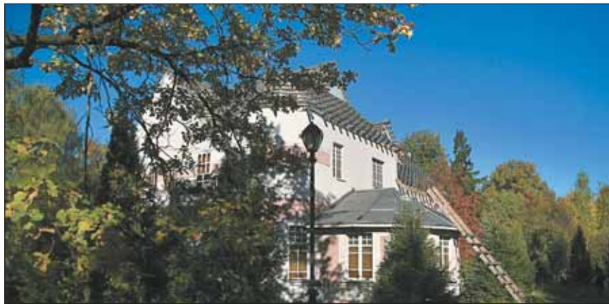
Ремонт приостановлен из-за нехватки средств