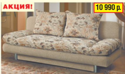
«Фантазия», тахта с механизмом «еврокнижка» ящик для белья, разм. 1920*870*900, с/м 1900*1350