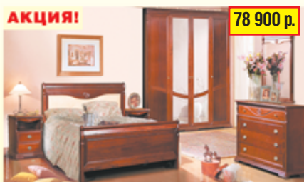
«Ли́ка» набор для спальни из массива дуба