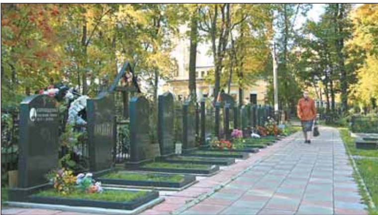
Кладбище оборудуют электронными терминалами

электронных карт, будет сложно отыскать нужную могилу. Александр ЧЕКОВ Справки о замене удостоверений на электронные карты можно получить по телефону (499) 610-0000