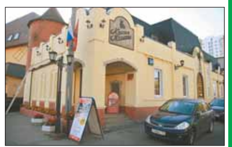
Сегодня здесь ресторан

Рядом всегда проживало немало известных людей, в том числе актеров, которые тоже уважали пиво.