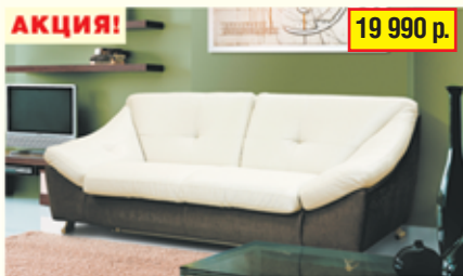
«Мичиган», трехместный диван в искусственной коже, разм. 2290*840*1020, с/м 2050*1400