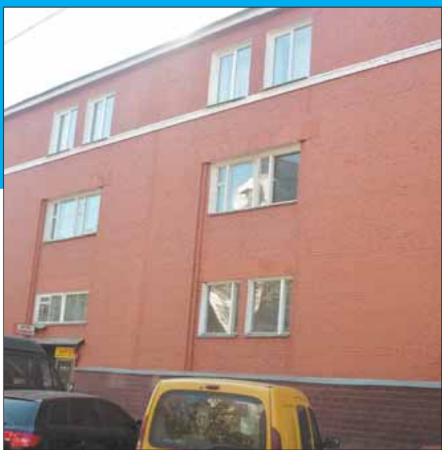
Те самые окна на последнем этаже, из которых работники фирмы выпихивали друг друга

В офис фирмы «Здоровье от природы» пришли с ордером на обыск сотрудники отдела по расследованию деятельности преступных сообществ Управления МВД. Работники фирмы решили не открывать дверь милиционерам. Пока собровцы взламывали дверь, пятеро менеджеров, испугавшись, выпрыгнули из окна 3-го этажа. Они торопились и, по словам свидетелей, бук-