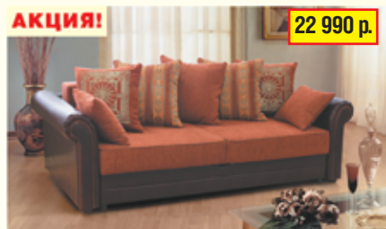
«Софи-2», трехместный диван-кровать с механизмом «тик-так», ящик для белья разм. 2350*900/750*8950, с/м 1900*1400