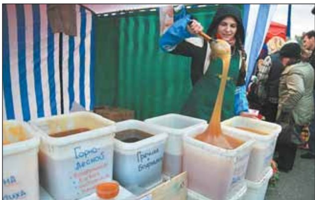
Такого меда, какой был на «Золотой осени», в магазинах не найдешь

Простым смертным тоже разрешалось попробовать любые продукты — от колбасы до пива. У стенда одной из компаний предлагали подоить корову, правда пластиковую. Тех, кто хотел посмотреть на настоящих коров, ждала экспозиция в павильоне «Космос». Здесь же прошли традиционные поросы чьи бега, ставшие в этом году международными. Победила