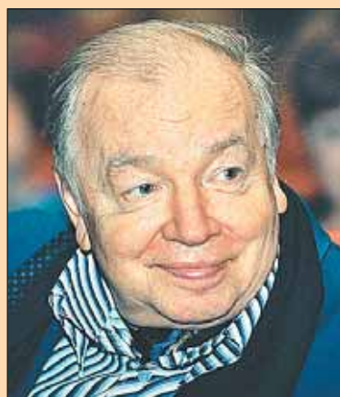
20 лет назад встречи писателя с народом шли без передышки, даже некогда было поест

З а литературным журналом «Знамя» в библиотеках по-прежнему записываются в очередь. А его главный редактор доктор филологических наук, профессор Сергей Чупринин живет в нашем округе, рядом с метро «Алексеевская». Встретившись, мы поговорили о том, как Евтушенко накормил голодных художников, о чем молчал Виктор Пелевин и как Андрей Вознесенский заговорил в полный голос.