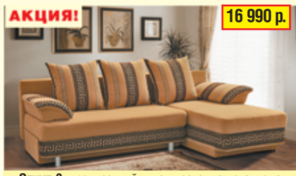
«Олимп-3», трехместный диван-кровать с механизмом «еврокнижка», два ящика для белья, разм. 2190*790/930*1360, с/м 2190*1320