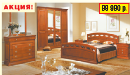
«Кармен» набор для спальни из массива ольхи

ЛУЧШИЕ БЕЛОРУССКИЕ КУХНИ Большой ассортимент кухонь из пластика, МДФ, массива дуба, ольхи, ясеня, сосны, черешни. Вся мебель произведена по современным технологиям из экологически чистых материалов, оснащена лучшими европейскими механизмами. Кухни по индивидуальным проектам. Цены от производителя.