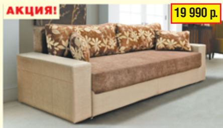
«Софи-4», трехместный диван-кровать с механизмом «еврокнижка», ящик для белья разм. 2400*900*1000, с/м 1500*2000