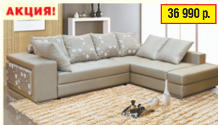
«Принцесса», угловой диван с механизмом «еврокнижка», 2 ящика для белья разм. 2750*730*2220, с/м 2190*1400