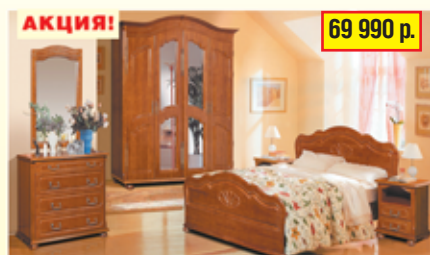
«Ромашка» набор для спальни из массива ольхи