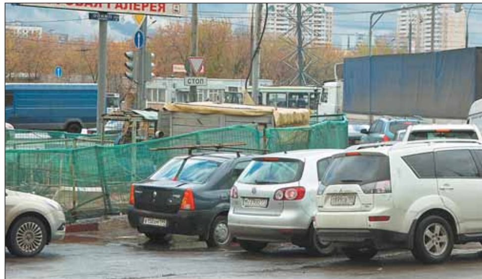
Пересечение улиц Широкой и Осташковской. Уже больше двух лет движению транспорта мешают работы по прокладке кабельного коллектора

О нарушениях при производстве работ на коммуникациях сообщайте в АТИ СВАО по телефону (499) 186-2385