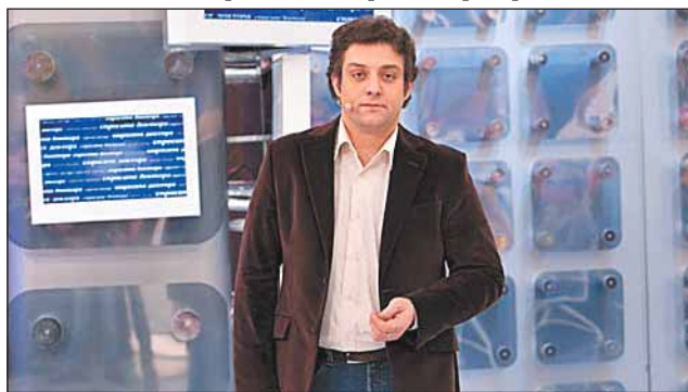
На съемках передачи «О самом главном»

сайту, который называется «Диета Полицеймако». Это вызывает у меня приступ бешенства, потому что советовать какую-либо диету я не имею права, поскольку я не диетолог и не врач. Просто кто-то зарабатывает деньги: «Пришли SMS с 10 долларами...» Нет сейчас времени с