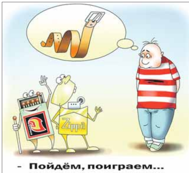
- Пойдём, поиграем...