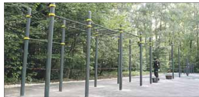
Площадь спорткомплекса — 500 кв. метров

Более 40 лет существовала на ВВЦ, в Запрудной зоне, спортивная площадка, где любители спорта могли размяться, подкачать мускулы. Но за десятилетия она пришла в упадок, снаряды поизносились. И сегодня, как рассказали в пресс-службе выставки, её решено возродить.