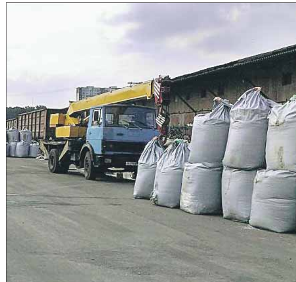
Отсюда реагент развозят по подрядным организациям города

На всякий случай мы перепроверили эту инфор-