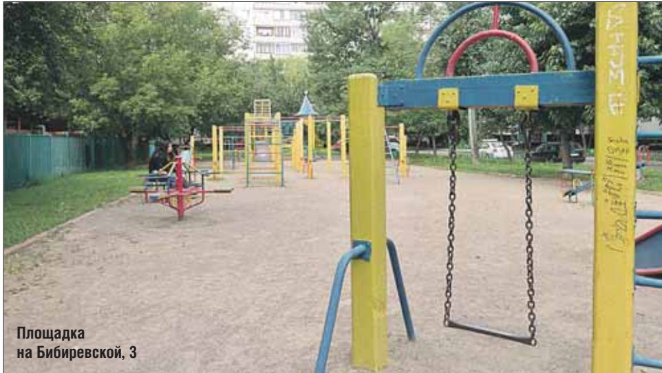
Площадка на Бибиревской, 3

Но самые ужасные качели попались мне в родном Алту-