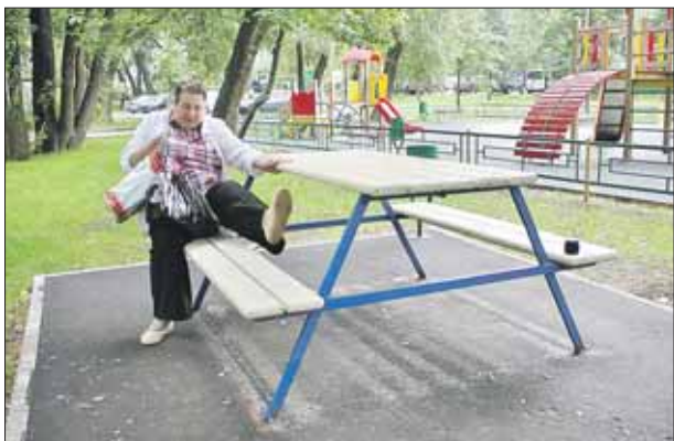
Сесть на такую лавочку пенсионеру непросто