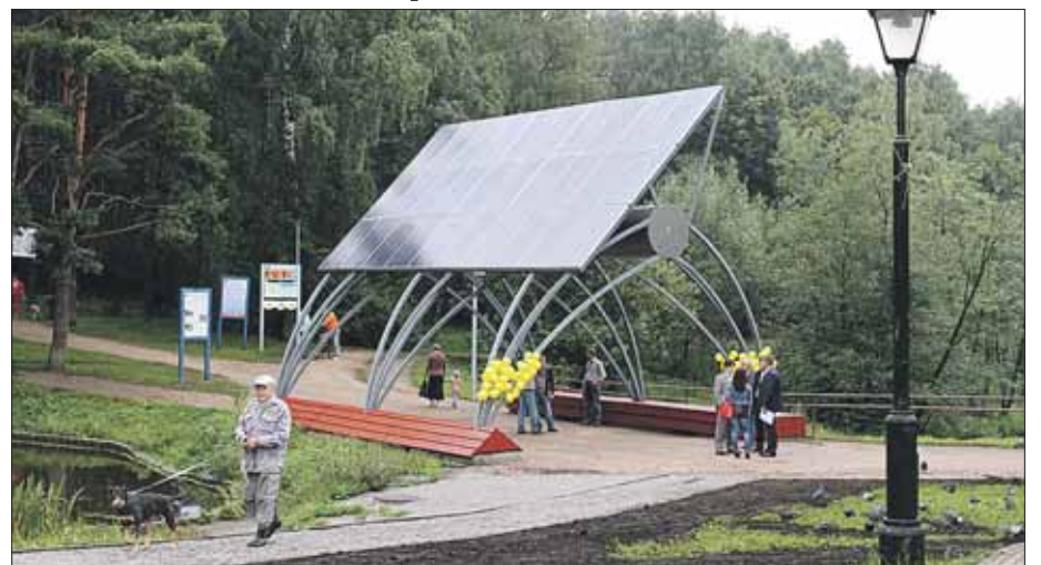
Станция стилизована под пешеходный арочный мостик

Первая в Москве солнечная электростанция «Ярослава» заработала в заказнике «Алтуфьевский» (ул. Мелиховская, 4). Установили её между двумя водоёмами и стилизовали под пешеходный арочный мостик. Она сможет давать