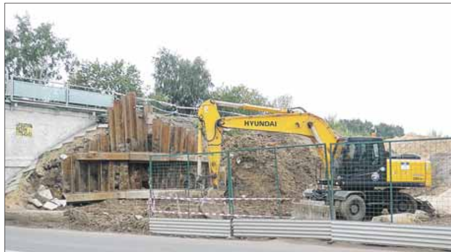
Реконструкция моста на Сельскохозяйственной улице

МКЖД должна взять на себя роль дополнительного пересадочного контура, связав как радиальные линии метро, так и радиальные направления железной дороги. В результате, совершая пересадки с помощью МКЖД, пассажиры смогут легко добраться как