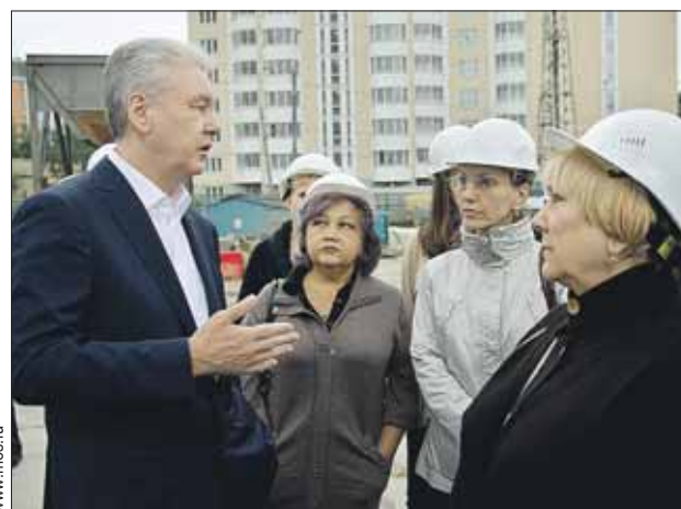
На стройплощадке метро «Фонвизинская» врио мэра Сергей Собянин провёл для жителей день открытых дверей

На «Петровско-Разумовской» работы идут в непосредственной близости от «серой» ветки: в районе буду-