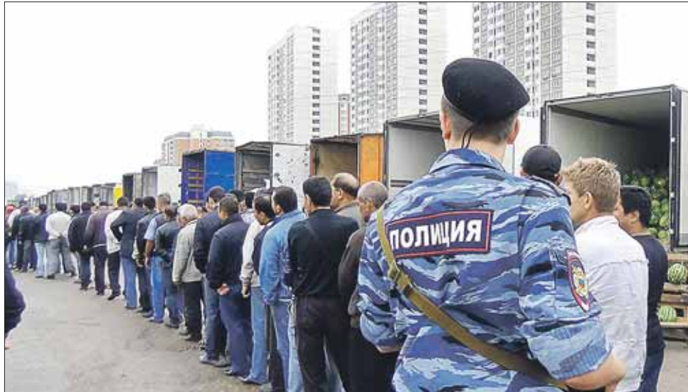
Всем задержанным сделают дактилоскопию