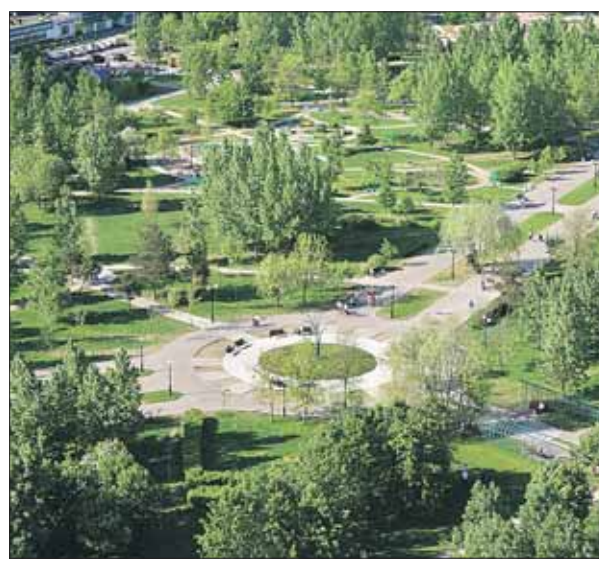
Зелёная зона в Отрадном