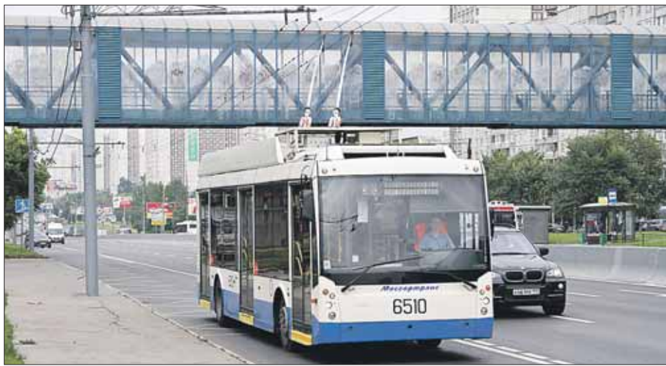
Скорость общественного транспорта по выделенке на Алтуфьевке выросла

Первое, что обращает на себя внимание: троллейбусы стартуют с очень равномерными интервалами, примерно каждые 5 минут. Вечером у метро «Алтуфьево» в машину, едущую в сторону центра, садится около 30 человек. А зачем вообще вечером в будний день так много людей едет в сторону центра? Оказывается, очень многим по пути от метро до дома надо вернуться от станции «Алтуфьево» немного назад — до Илимской, Стандартной и т.д. Ну а в обратную сторону на всём пути от Ботанического сада до метро «Алтуфье-