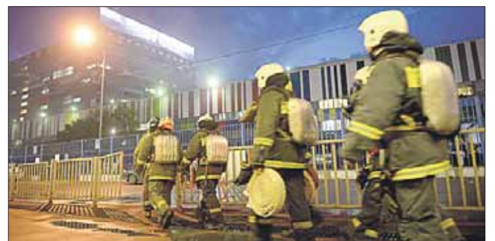
Пожарные быстро прибыли на место