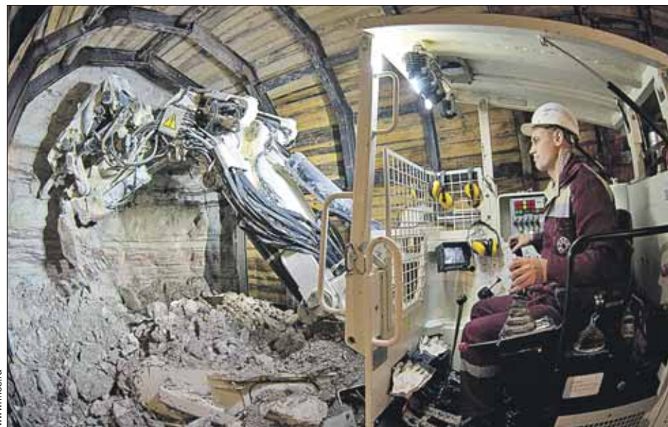
Кипит работа в забое на «Фонвизинской»

верного радиуса предполагается открыть в конце 2014 года.