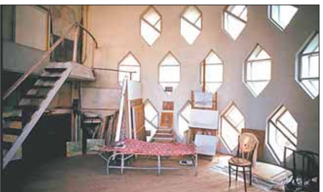
Уникальный дом-мастерская в Кривоарбатском переулке

Родился Мельников в 1890 году на Бутырском хуторе