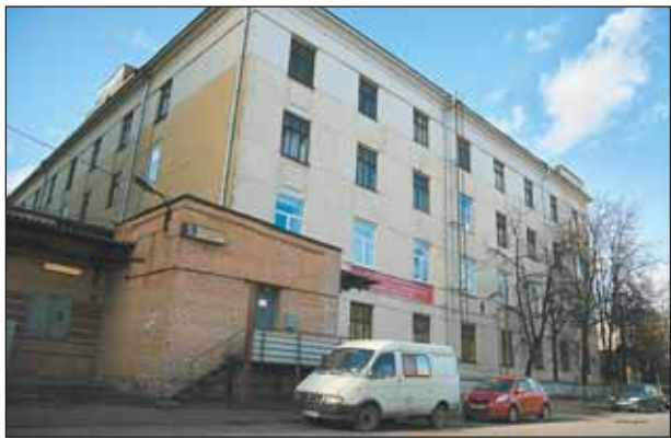
В бывшей типографии «Молодой гвардии» жили и работали нелегалы из Вьетнама

— Этот цех самый крупный из всех, которые до этого удавалось обнаружить в столице, — говорит начальник отделения