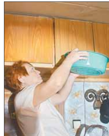
Во время визита нашего корреспондента