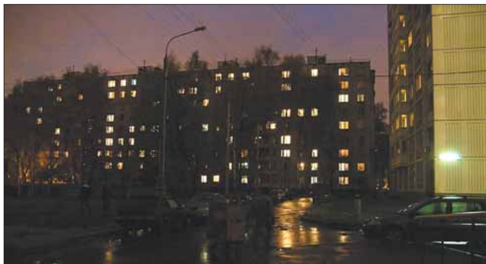
Проезд Шокальского, 47, корп. 1, этой осенью

Правда, как сообщили в управе района Северное