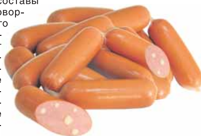
Сосиски «Рублевские» в целлофане