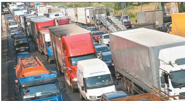
В Северном — как по всей Москве

«Мы уже зацентрализовались так, что ни вздохнуть, ни охнуть»