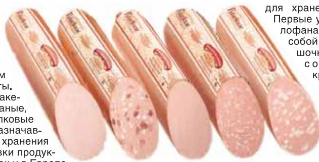
Вареные «Рублевские» колбасы в целлофане

Предтечей пакетов были кожаные, джутовые и хлопковые мешки, предназначенные для хранения и транспортировки продуктов. В России, как и в Европе, бумажные пакеты использовались для упаковки та-