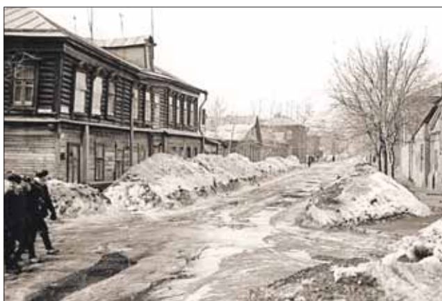
5-й проезд Марьиной Рощи в 1971 году был тихой улочкой