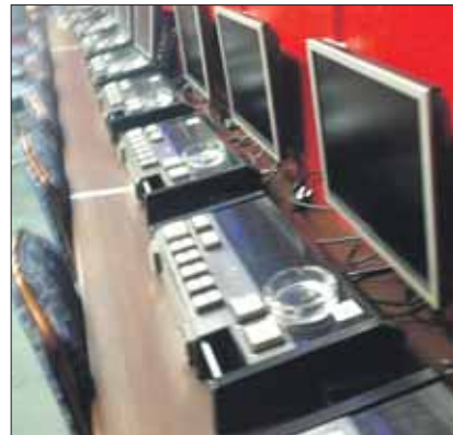
Внутри обнаружили 24 игровых автомата проверка, которая установит, кто конкретно сдал это помещение в аренду и кому. После неё будет решаться вопрос о возбуждении уголовного дела.

Организаторов казино установить пока не удалось. Поэтому в отношении руководства кинотеатра «Ладога» будет проведена