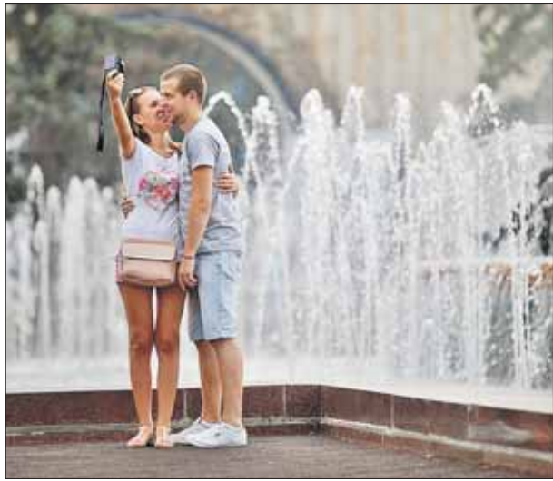
Много интересного предлагает ВДНХ

16 и 17 августа в 12.00 на площади у павильона №27 на ВДНХ состоится Кубок мэра по стритболу. Стритбол — уличная версия баскетбола. В отличие от классической игры, в уличный баскетбол игра-