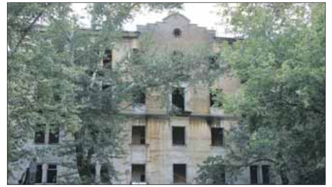
Сейчас объект культурного наследия почти разрушен и давно пустует

Власти Москвы выставили на аукцион объект культурного наследия «Суконная фабрика Кожевникова» (ул. Сельскохозяйственная, 36, стр. 2). Московский купец Иван Кожевников построил её в 1822 году. Сейчас образец промышленной культуры XIX века почти разрушен и давно пустует. Как сообщили «ЗБ» в пресс-службе столичного Департамента по конкурентной политике, по условиям купли-продажи покупатель с течение пяти лет должен будет привести в порядок фасады и интерьеры здания. Реставрации подлежат