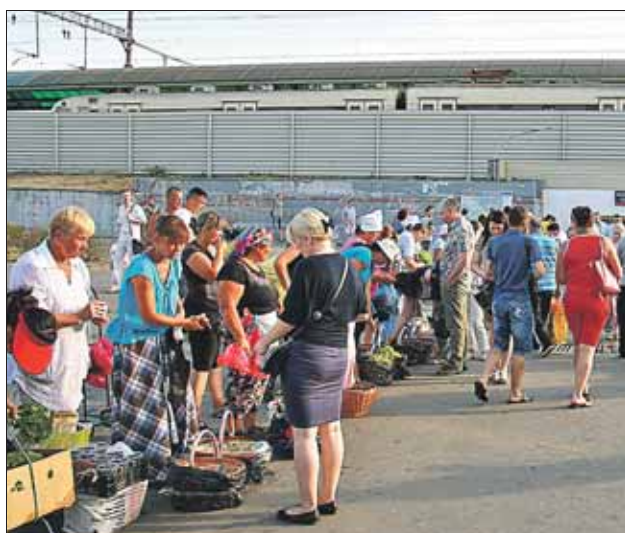
Уличная торговля портит облик города

По мнению некоторых жителей, несанкционированная торговля представляет не только опасность для здоровья, но и просто