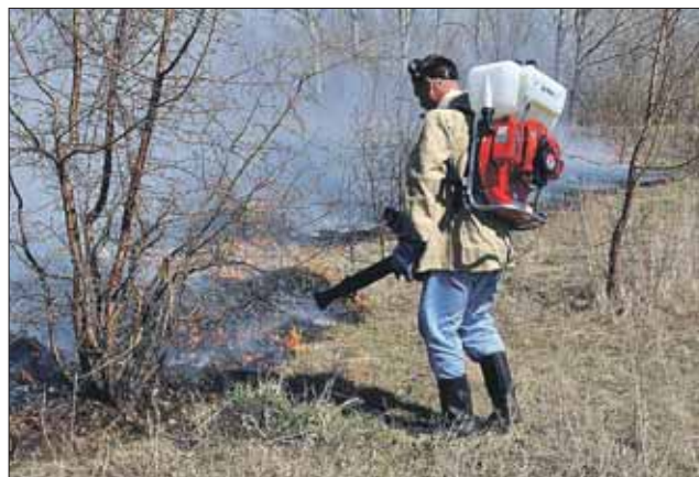
В 99 случаях из 100 причиной пожаров является человеческий фактор