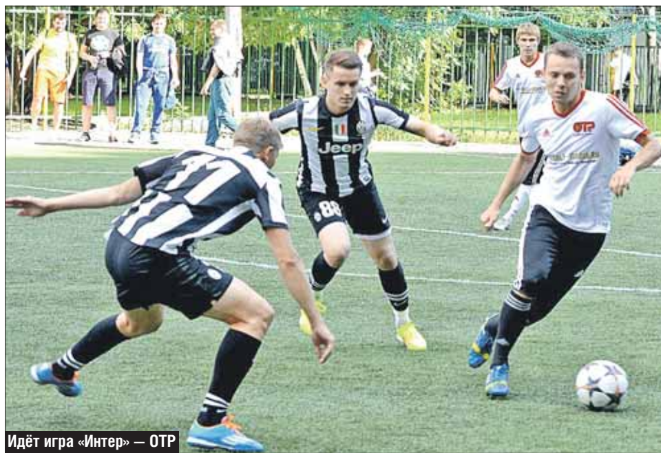
Идёт игра «Интер» — ОТР

Добавьте к этому уровень игроков. В высшем и первом дивизионах он очень высок, ведь после окончания карьеры сюда приходят играть многие известные футболисты.