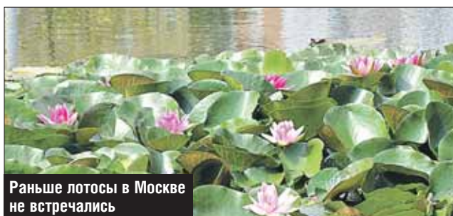
Раньше лотосы в Москве не встречались

Цветущие лотосы сфотографировал и прислал в «ЗБ» читатель. Чудо произошло на Капустянском пруду в Свиблове.