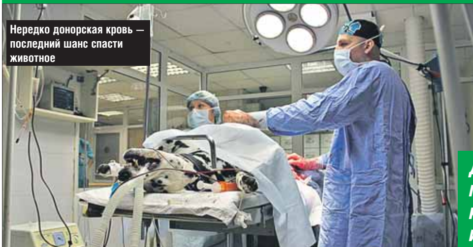
Нередко донорская кровь — последний шанс спасти животное