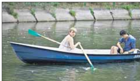
Лодочный маршрут проходит вокруг фонтана «Золотой колос»