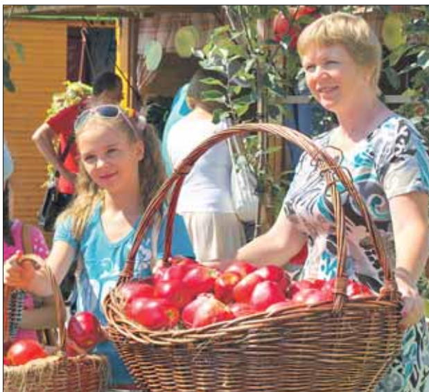
Урожай этого года

Префектурой уже предложены места для новых ярмарок в пяти районах