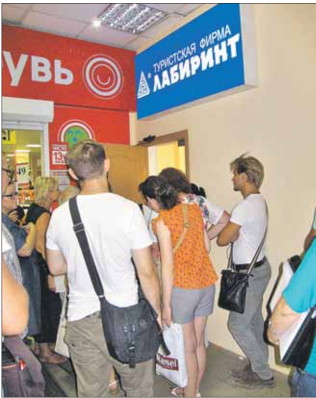
В офисе на Цандера началась выдача загранпаспортов несостоявшимся туристам

— Я стою здесь уже четвёртый час! Я без документов не уйду, а вы здесь ночевать будете, пока всем всё не выдадите!