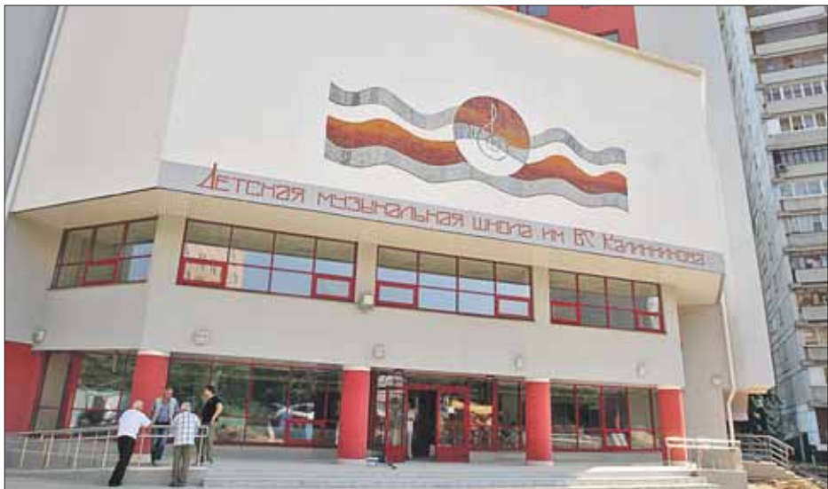
В новом здании будут учиться 1600 учеников

Обновлённая музыкальная школа имени В.С.Калинникова открывает свои двери для 1600 учеников в начале нового учебного года. В новом здании — два современных концертных класса,