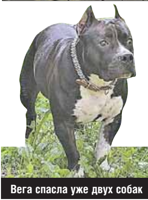
Вега спасла уже двух собак

как пироплазмоз, при отсутствии донорской крови почти всегда приводит к гибели