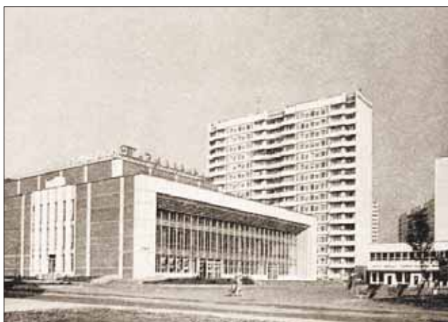
Под театр Аркадию Райкину отдали кинотеатр «Таджикистан»

— Если идти по Шереметьевской от Суцёвского Вала, то слева располагались панельные пятиэтажки. Особенно мне запомнились две. На их глухих торцевых сторонах были балконы без окон и дверей. Очевидно, что при строительстве этих домов не нашлось нужных панелей. Потом балконы, конечно, срезали. По правую сторону от Шереметьевской тянулась большая лесопарковая полоса, в которую вкраплялись редкие частные дома. А параллельно Шереметьевской, на 2-й улице Марьиной Рощи, уже разворачивалось большое строительство. Как-то я по-