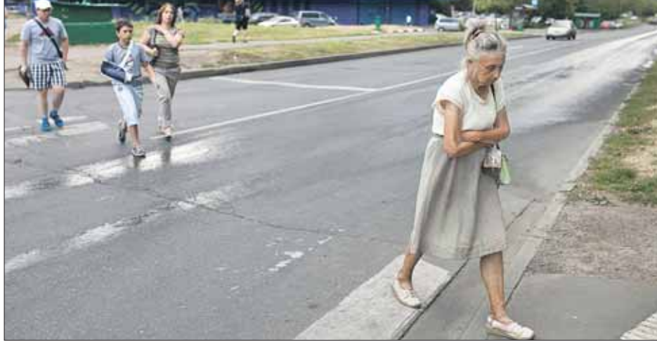
По словам жителей, на пересечении улицы Широкой с Заревым проездом это уже не первая авария

— Нужно срочно что-то делать. Например, поставить ограду, которая отделяла бы тротуар от проезжей части, поднимать тротуар или класть «лежачие полицейские», — убеждена она. Пятачок тротуара возле