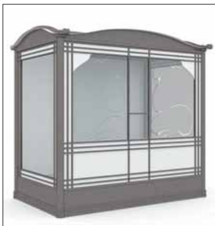
Торговый павильон в стиле модерн...

Павильоны в стиле модерн выглядят более легкими, воздушными. Это благодаря тому, что каркас, выполненный из стали с элементами чугуна, заполнен большими панелями из закаленного стекла. Такие модули будут хорошо смотреться в окраинных районах