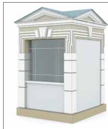
...в стиле классика