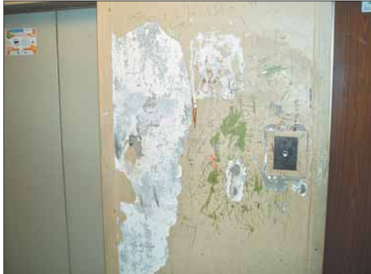
Ободранные стены — привычная картина в общежитии на Ясном проезде, 19

В редакцию пришло письмо: «Мы, жители общежития, выиграли суд, но нас не прописывают. Помогите!»