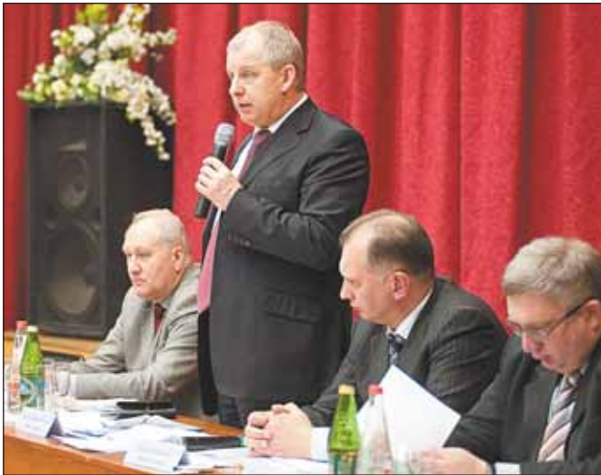
На вопросы марфинцев ответил префект СВАО

— В районе Марфино нет домов сносимых серий. Когда мы разрабатывали программу реконструкции жилого фонда района, ее планировалось реализовать по программе сноса некомфортного жилья. Но пока эта программа не принята правительством Москвы. В городе до конца не реализована программа реконструкции пятиэтажного жилого фонда домов сносимых серий: 30% такого фонда еще не снесено. На это будут направлены основные усилия. В районе Марфина Роща, например, — целый микрорайон пятиэта-