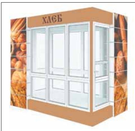
...в стиле минимализм...