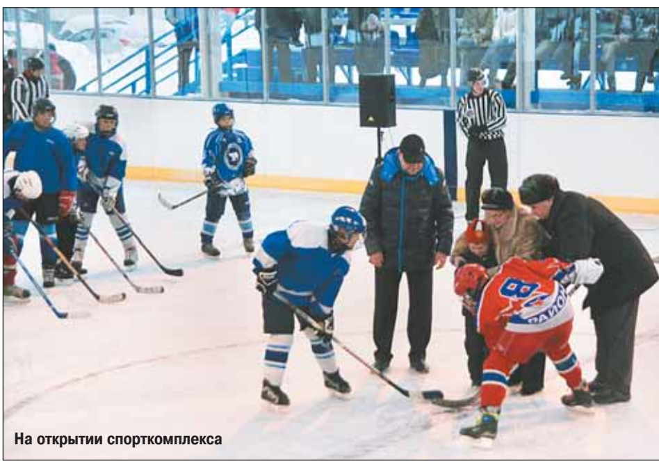
На открытии спорткомплекса