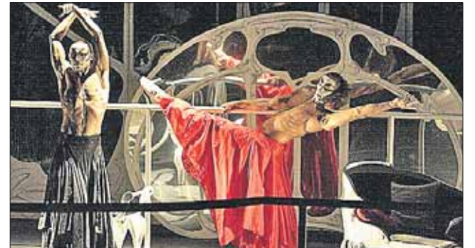
Спектакль Виктюка «Служанки»

В Еврейском общинном центре в Марьиной роще недавно состоялась встреча зрителей с режиссёром, народным артистом России и Украины Романом Виктюком. Режиссёр рассказал о себе и вспомнил артистов, с которыми ему довелось работать.