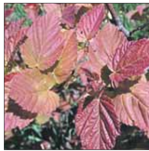
Клён татарский — небольшое деревце высотой 8-10 метров