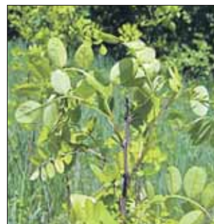
Робиния лжеакация хорошо переносит засуху и плохо — зиму