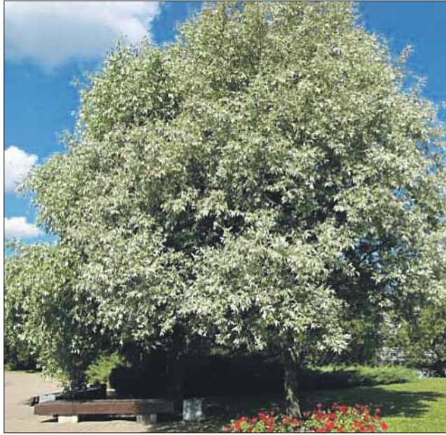
Ива белая, или серебристая, в высоту достигает 25 — 30 метров

Деревья, растущие в городе, образно говоря, испытывают постоянный стресс. Поэтому жизненного пространства им надо больше. Расстояние между деревьями должно быть не менее 5 м, иначе они начинают болеть и вырождаются. А со временем их могут вытеснить сорные породы, например клён. К тому же густые заросли нарушают режи-