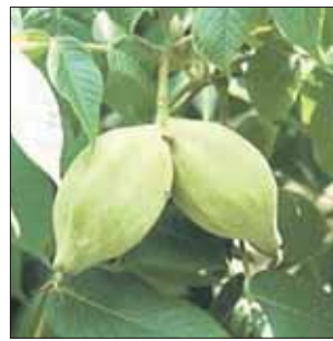
Орех серый в Москве даже плодоносит