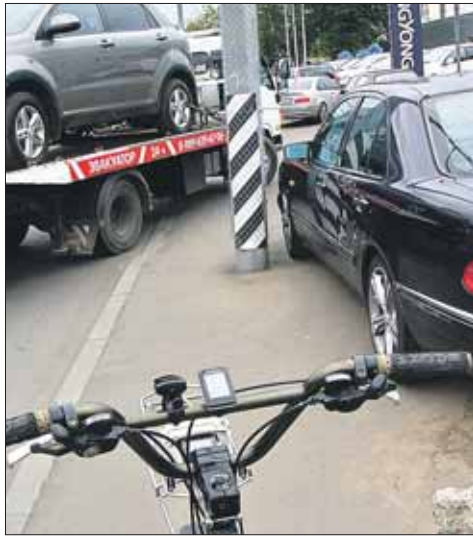
Тесновато велосипеду у торгового центра

У автосалона «БорисХоф» (Ярославское ш., 36) от забора салона до проезжей части метра два. Это тротуар? Нет, судя по знакам, это велодорожка. Но где пройти пешеходам? После ворот салона дорожка и вовсе сходит на нет: меж-