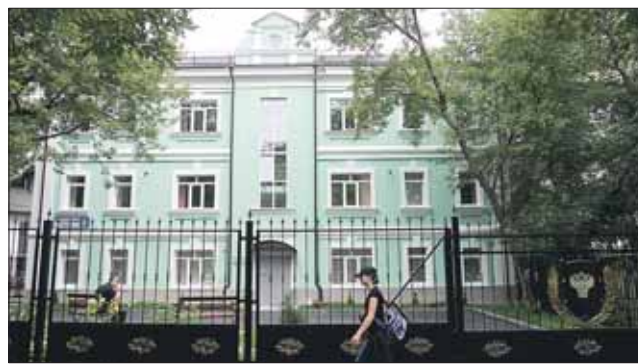
Здание в Институтском переулке, куда переехала прокуратура СВАО

Окружная прокуратура переехала из Бутырского района в Марьину рощу, на Институтский пер., 8. Об этом сообщил помощник окружного прокурора Юрий Громов. Теперь прокуратура СВАО занимает отдельное трёхэтажное здание в двух шагах от Тетра Российской армии. Как и прежде, сотрудники прокуратуры ведут приём с понедельника по четверг с 9.00 до 18.00, а по пятницам — с 9.00 до 16.45.