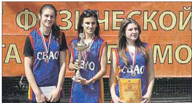
Команда СВАО заняла 2-е место