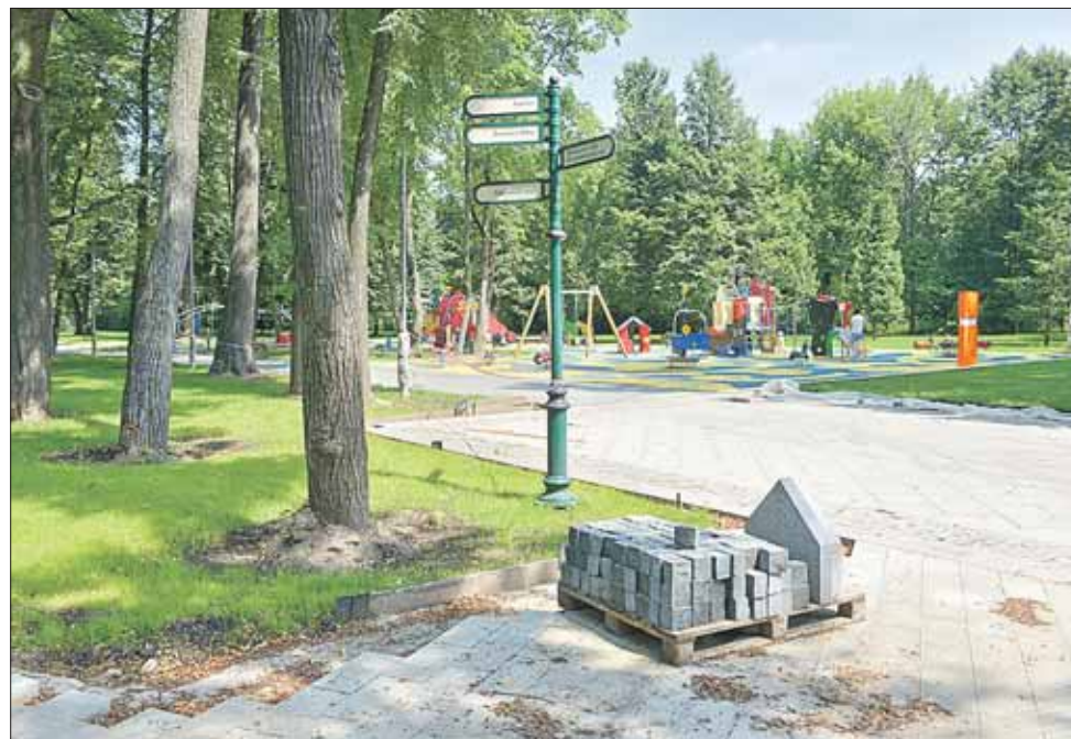
Идёт реконструкция Останкинского парка