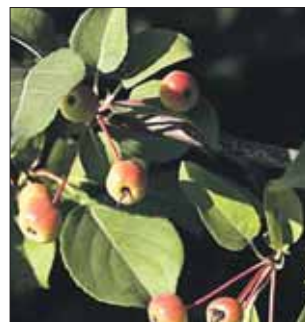
Яблоня ягодная — весьма неприхотливое дерево