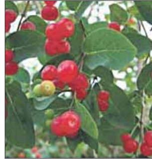
Жимолость татарская — хорошая живая изгородь