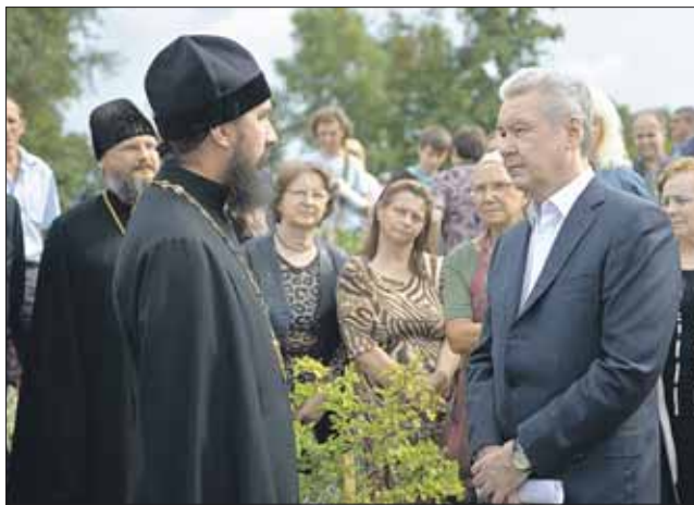
Сергей Собянин на Церковной горке

В народном парке на Церковной горке будут зоны отдыха для детей, молодёжи и пожилых людей