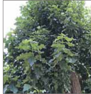
Тополь берлинский легко выдерживает стрижку