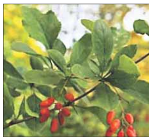
Барбарис обыкновенный — раскидистый кустарник до 2,5 метра высотой