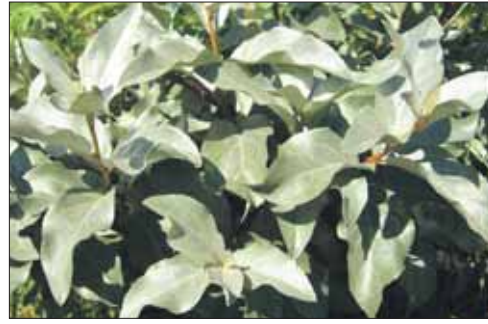
Лох серебристый. Листопадное дерево до 4 м высотой

► Деревья можно выбрать на сайте Департамента природопользования: www.eco.mos.ru