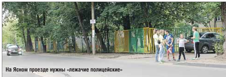
На Ясном проезде нужны «лежащие полицейские»

От ближайших домов до школ максимум метров 100. Детей здесь много даже в неучебное время. Во дворе на Полярной, 13, замечательная детская площадка. Вот на неё и бегают ребята из окрестных дворов.