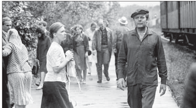
Кадр из советско-итальянского фильма «Подсолнухи»

Режиссёр рассказал о себе и об известных артистах, с которыми ему довелось работать