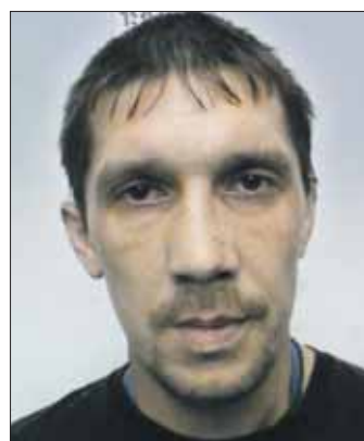
Сотрудники УВД по СВАО просят всех, кто пострадал от действий злоумышленника, обращаться по телефонам (495) 616-0601 или 02