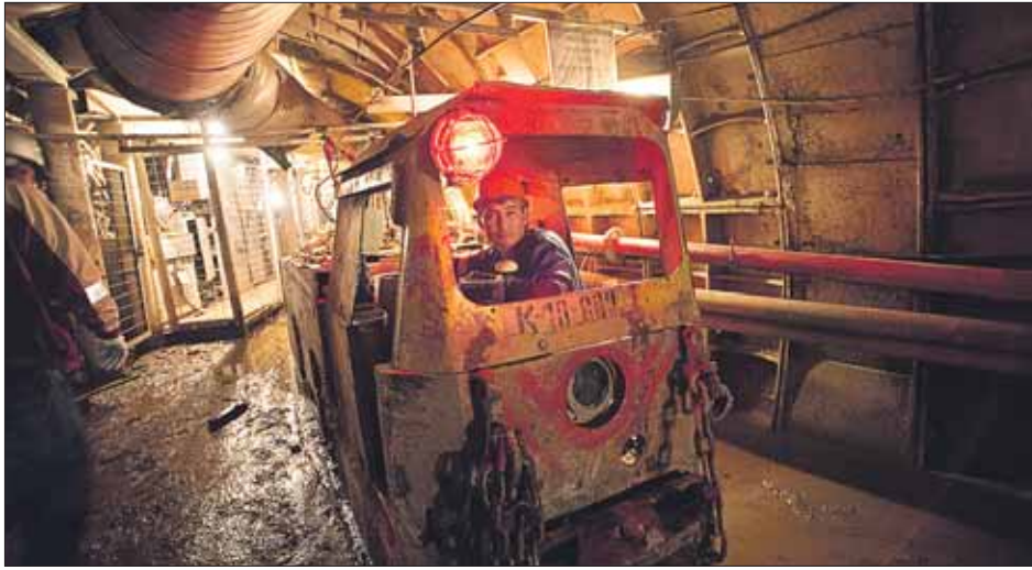
Электровозик толкает вагонетки с известняком и глиной

Наш корреспондент спустился на 64 метра под землю и увидел, как прорубают тоннель к «Петровско-Разумовской-2»