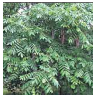
Орех маньчжурский растёт быстро, хорошо переносит зиму