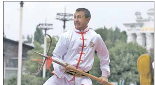
Упражнение с оружием ушу — трезубцем