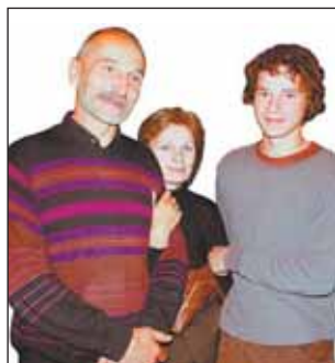
С женой и сыном