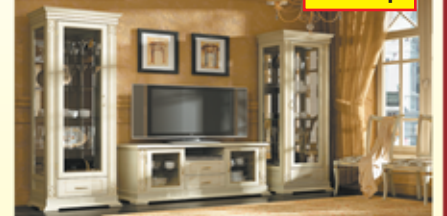
Гостиная «Верди», крашение «беленый дуб» (массив дуба)