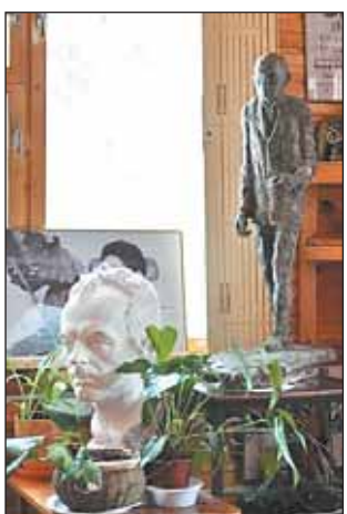
В Музее Булата Окуджавы

Стоимость экскурсии — 1150 руб. Продолжительность — 8 часов. Телефоны для заказа экскурсии: 608-5411, 643-7350 сайт www.moscowturizm.ru