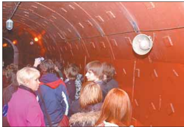
Раньше здесь был командный пункт на случай ядерного удара

Попасть в музей можно, только предварительно заказав экскурсию. Стоимость билета для взрослых — 650 руб., для студентов и школьников в рабочие дни — 300 руб. Телефон для заказа экскурсии: (495) 500-0554, (495) 500-0553 с 10.00 до 18.00, сайт www.bunker42.com Адрес: м. «Таганская», 5-й Котельнический пер., 11