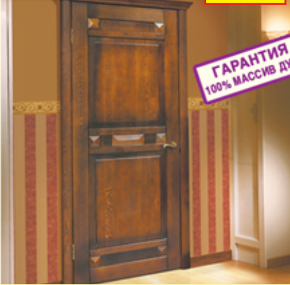
«Фараон-2», дуб античный