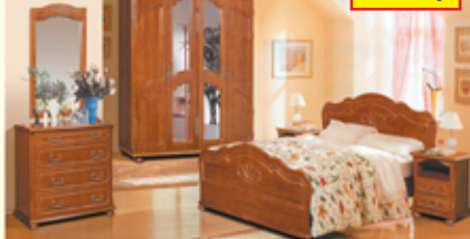
«Ромашка», набор для спальни из массива ольхи