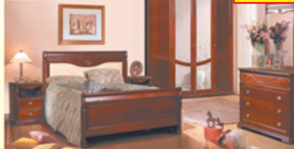
«Лица», крашение «Вишня», набор для спальни из массива дуба