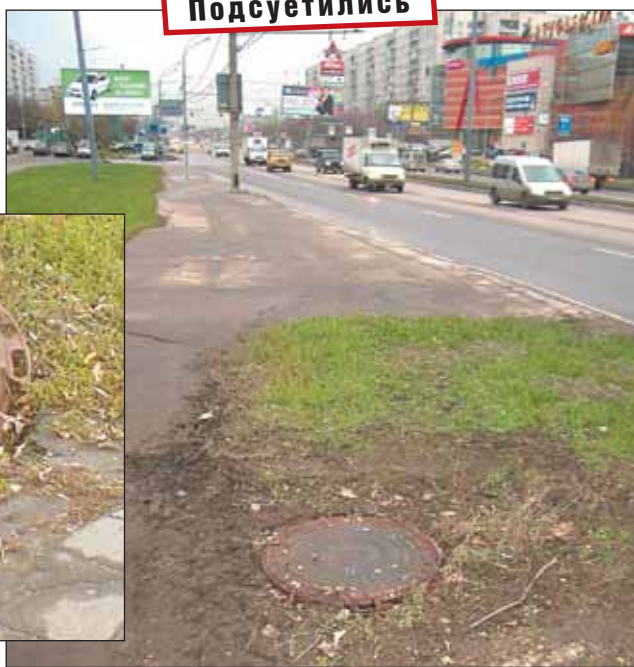
...а так стало. Можно ходить без опаски