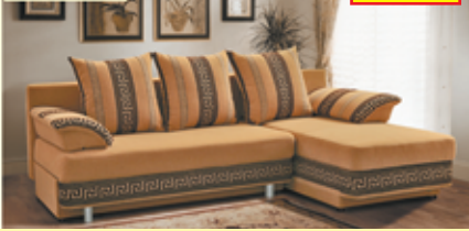
«Олимп-3», угловой диван-кровать с механизмом «еврокнижка», два ящика для белья, разм. 2190*790*930*1360, с/м 2190*1320