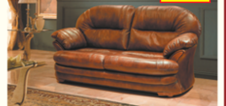
«Йорк», трехместный диван-кровать, 100% кожа, механизм трансформации «Дионис», разм. 2230*1070*1080 с/м 1350*1860