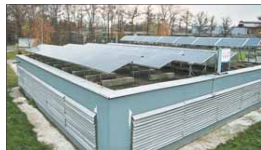
Мощность батареи — не меньше 5 кВт