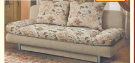
«Фантазия», тахта с механизмом «еврокнижка», ящик для белья, разм. 1920*870*900, с/м 1900*1350