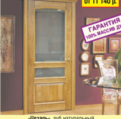
«Цезарь», дуб натуральный

АКЦИЯ! скидки до 30% на ДВЕРИ из 100% МАССИВА ДУБА