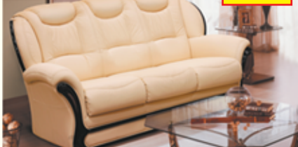
«Марсель», трехместный диван-кровать, 100% кожа, механизм трансформации «Спартак», разм. 1920*1070*1000 с/м 1350*1860