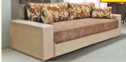
«Софи-4», трехместный диван-кровать с механизмом «еврокнижка», ящик для белья, разм. 2400*900*1000, с/м 1500*2000