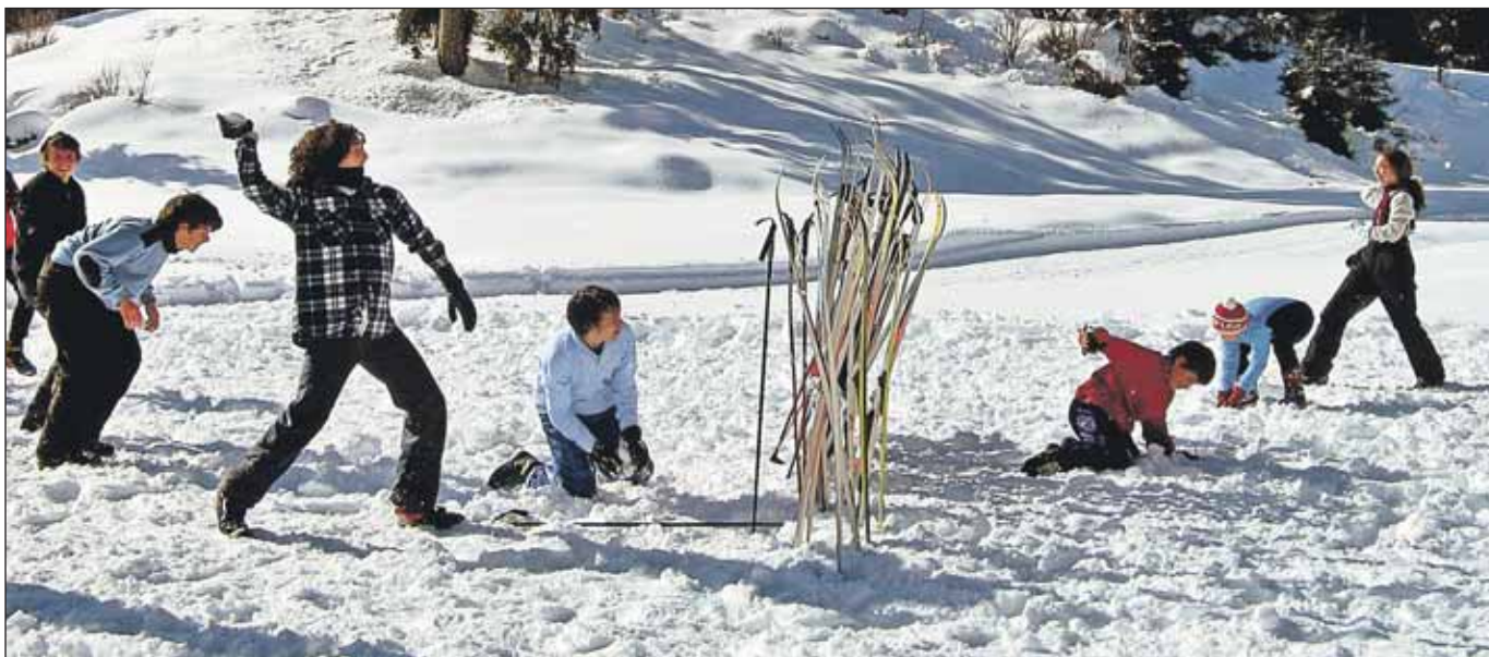
Семьям льготных категорий будут выделены путёвки в зимние загородные лагеря

За льготными путёвками для детей в лагеря и на экскурсии нужно обращаться в свою управу