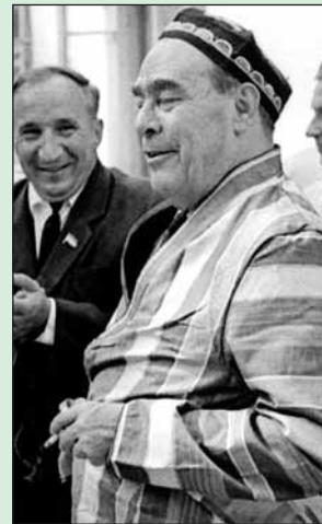
Туркмения, 1972 год