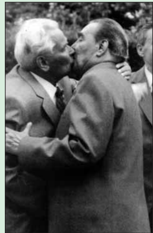
С верным соратником К.У.Черненко

Что касается курения, то курить Леонид Ильич любил. Несмотря на запреты врачей. Для него даже создали специальные сигареты с удлиненным фильтром. Но он предпочитал привычную «Новость». Потом для генсека придумали портсигар с таймером: достать очередную сигарету можно было не раньше, чем через 45 минут. Но и это не сработало. Он брал сигареты у окружения, и никто не мог ему отказать. Ведь Леонид Ильич был очень обаятельным! Считал, в этом сила дипломатии. Даже президент США Картер не устоял перед его обаянием и