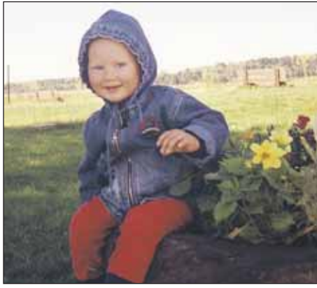
Дорогие читатели! Присылайте нам фотографии своих детей и интересные истории о них: 129090, г. Москва, просп. Мира, 18, pochta@zbulvar.ru