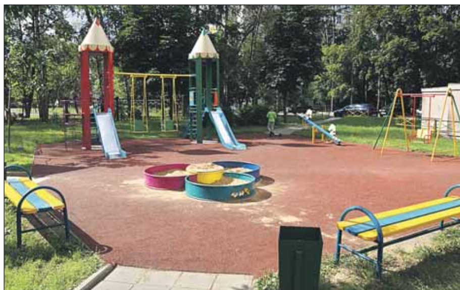
Дворик на улице Седова, 2, корпус 1

Намечено благоустроить 23 детских игровых городка.