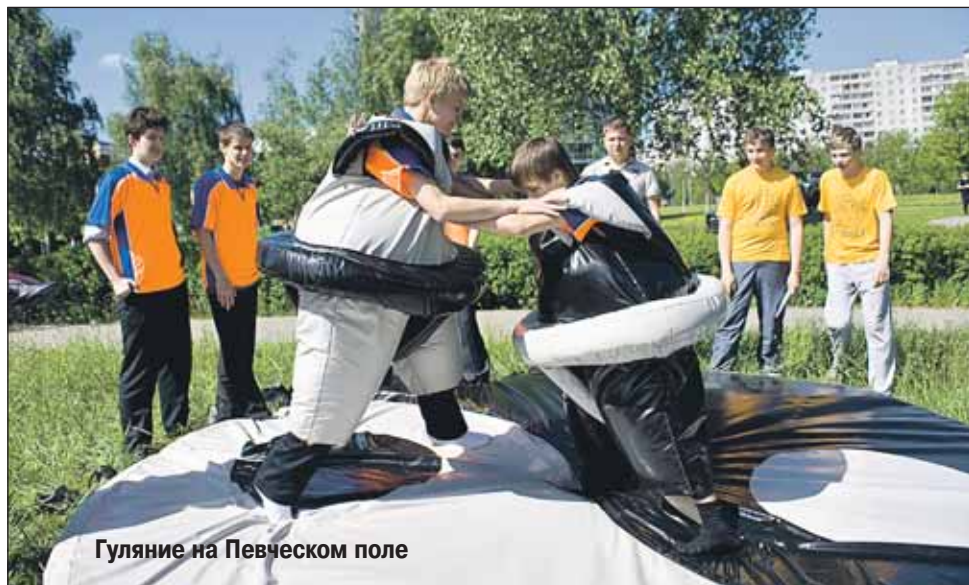
Гуляние на Певческом поле

Концерты, фестивали и представления 1 и 2 сентября пройдут по всему округу. Главными праздничными площадками станут Останкинский парк, Ростокинский акведук и Певческое поле.