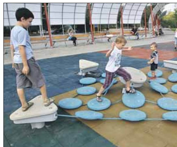
В парковой зоне на улице Северодвинской

до проезда Дежнёва; — вдоль улицы Северодвинской; — в районе Свиблово.