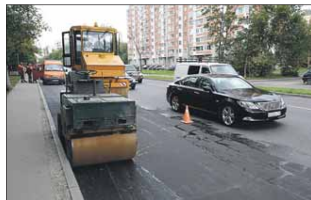
В следующем году улицу Яблочкова планируют расширить по всей длине

Когда работы завершатся, новую полосу убирать, конечно, не будут. Наоборот, в следующем году улицу Яблочкова планируется расширить уже по всей длине. Наличие четырёх полос позволит сделать её