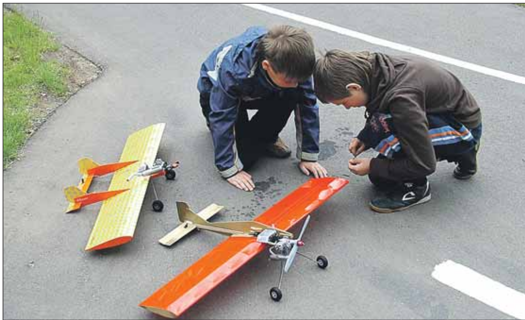
Большинство юных москвичей занимаются в центрах творчества

В художественной школе №6 на ул. Гончарова, 6, тоже подтвердили, что в учреждение ребёнка принимают только после вступитель-