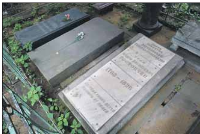
Могила Фёдора Ростопчина

В 1812 году он сжёг собственную усадьбу, чтобы она не досталась оккупантам