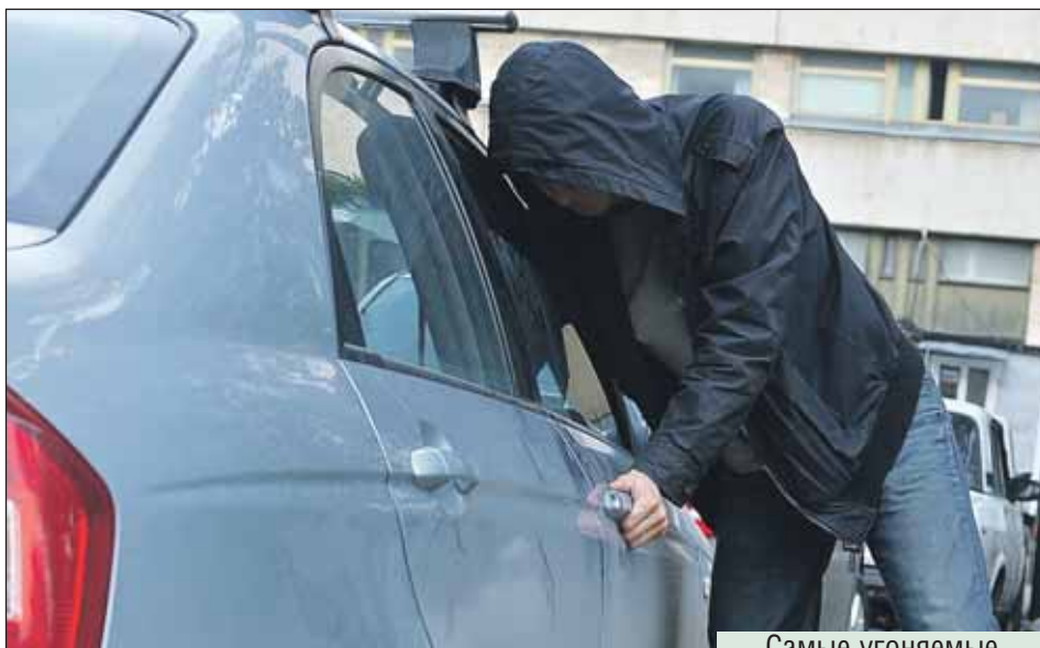
Чем больше выездов из района, тем больше он подходит угонщикам

Днём угоняют в 7 раз меньше машин, чем ночью. Чаще всего это происходит вблизи крупных торговых центров и транспортно-пересадочных узлов, особенно у метро «Алтуфьево», «От-