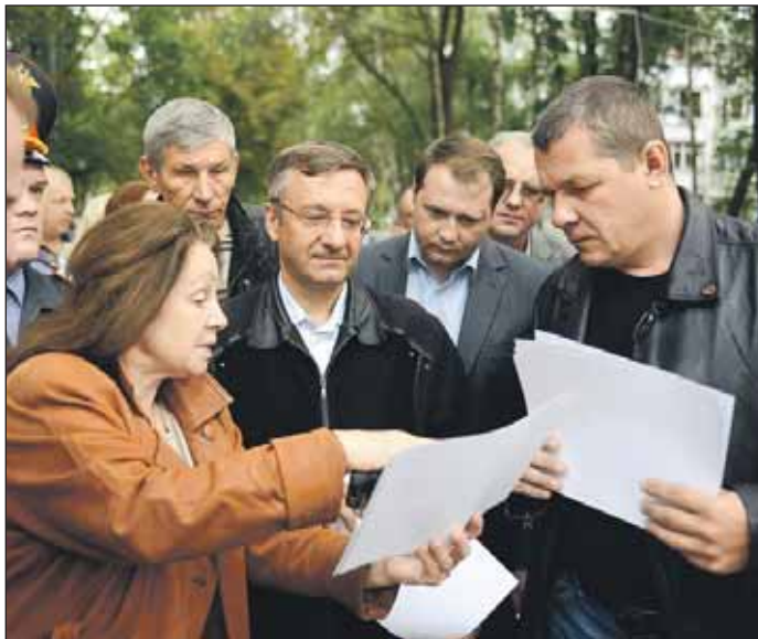
Префект взял документы, которые подготовили ему жители

Зашёл разговор о парковках и на Заповедной, 20. Но здесь проблема в другом. Места на недавно сооружённой экопарков-