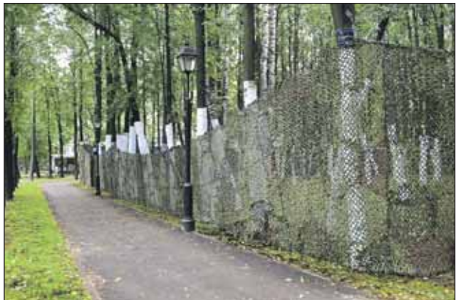
Деревья обмотали плёнкой, чтобы они не пострадали во время соревнований по пейнтболу

Как заверили в администрации парка, вырубка идёт на законных основаниях — на работы получено разрешение от Департамента природопользования.