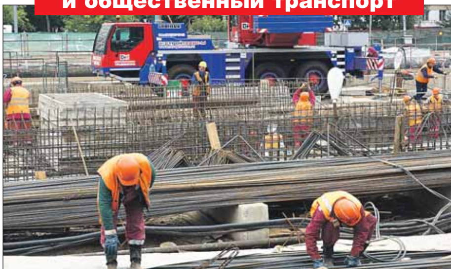
Строится второй вход в метро «Марьино Роща»

Ведётся проектирование и строительство 3 станций метро на перегоне от станции метро «Марьино Роща» до стан-