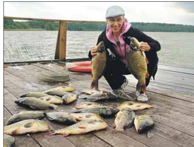
«В Подмоскowie мы с друзьями наловили карпов»

— Мне всегда было интересно актёрское поприще. В 10 лет с девочками со двора мы поставили свой спектакль. Драматургия проста: король, королева, принц, принцесса, Баба-яга.