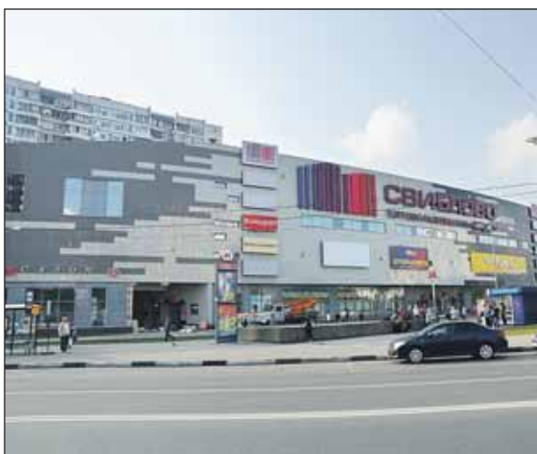
Торговый центр в Свиблове