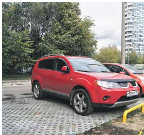
Экопарковка на улице Чичерина, 8, корпус 1

Будет введено 17 160 парковочных мест, из них 2273 новых мест для парковки во дворах.