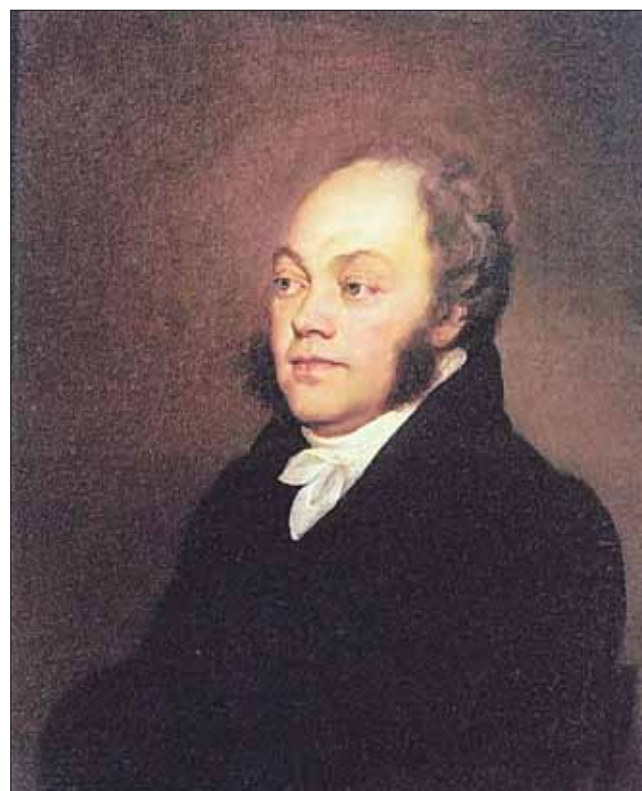
Московский генерал-губернатор Фёдор Ростопчин. Портрет работы О.А.Кипренского

заверениям Кутузова о грядущей битве у стен Москвы, поэтому собрал и вооружил несколько тысяч горожан, которые должны были встретить неприятеля у Трёх гор (место на окраине к западу от Кремля) и помочь русской армии. А ког-