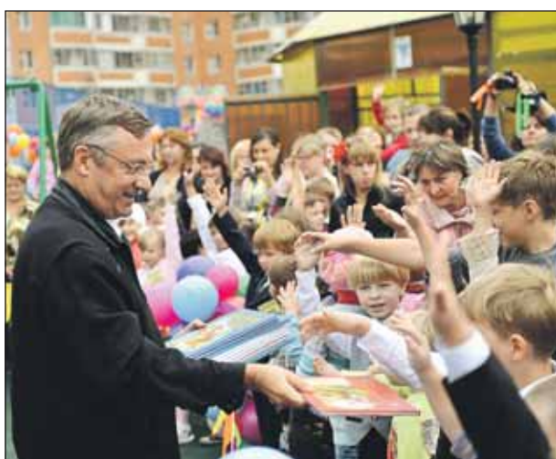
Все будущие первоклассники получили подарки

Гостей праздника встречали ростовые куклы, клоу-