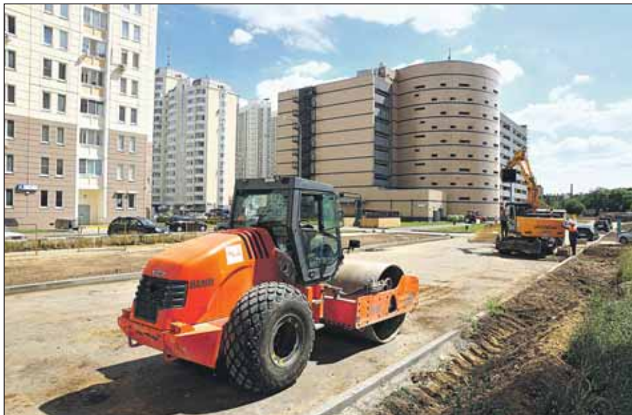
Строится новая дорога в Марфине

Будет устроено 153 заездных кармана, организовано 5,7 тыс. парковочных машино-мест. Планируется реконструировать Лианозовский проезд.