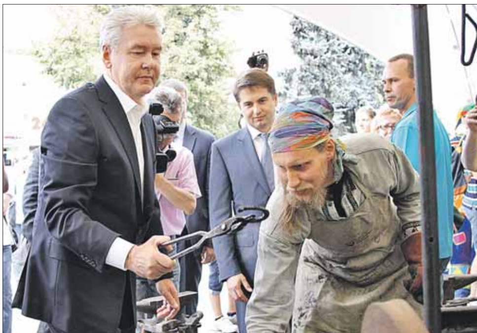
На региональной ярмарке Сергей Собянин посетил лавку кузнецов

Мэр столицы Сергей Собянин принял участие в открытии региональной ярмарки на Семёновской площади, здесь можно приобрести продукты из Белгорода. Ярмарки появятся почти во всех округах столицы, на них приглашены представители разных федеральных округов страны — Центрального, Приволжского, Южного. Кроме того, на них будут представлены продукты из Казахстана, Армении, Азербайджана и Белоруссии.