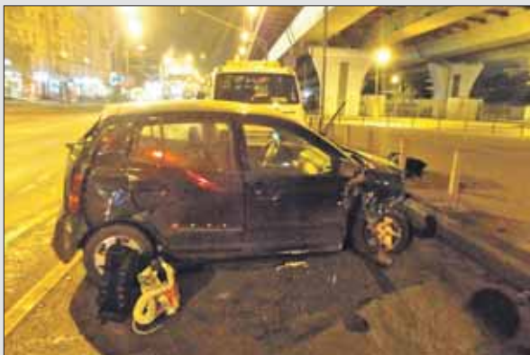
Винник ДТП на проспекте Мира скрылся с места происшествия

20 августа примерно в 16.25 на Ярославском шос-