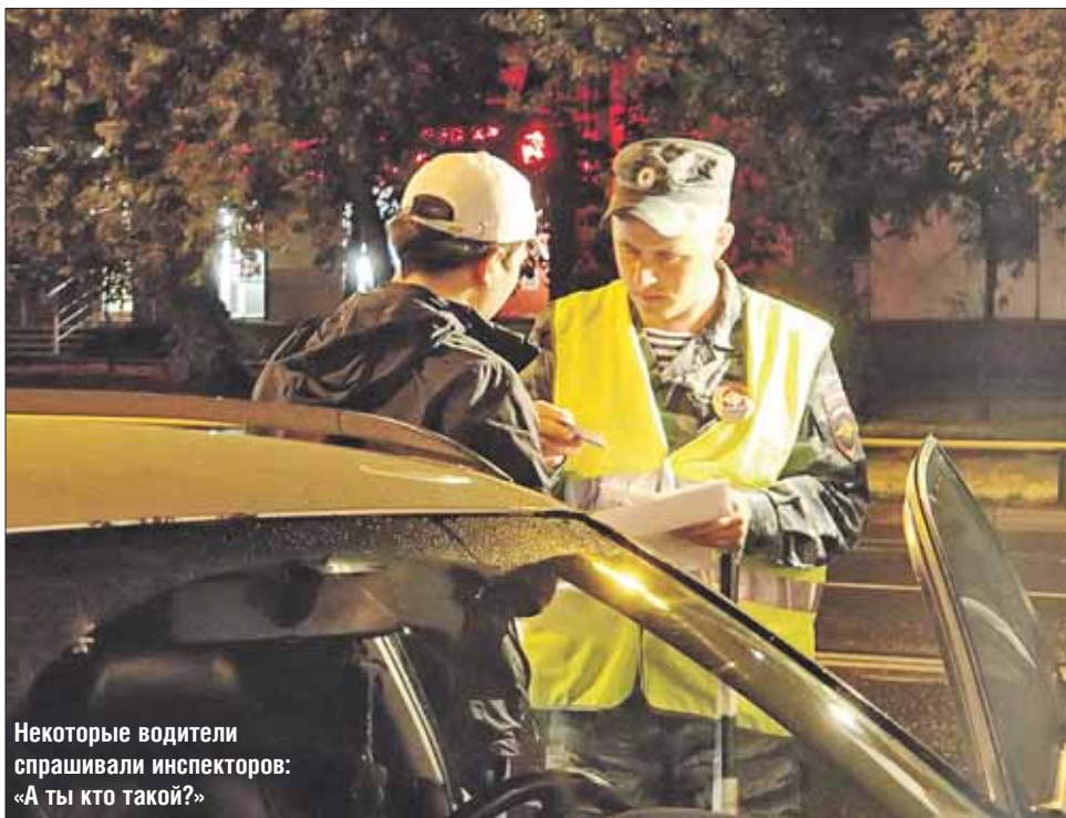
Некоторые водители спрашивали инспекторов: «А ты кто такой?»

Водители к проверкам привыкли: большинство реагируют спокойно. Но не все: некоторые из тех, кого останавливают сотрудники патрульно-постовой службы, ворчливо спрашивают: «А вы кто такой?» и говорят, что покажут документы только инспектору ДПС. В ПДД запи-