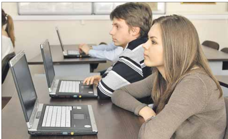
На парте ничего лишнего, только компьютер