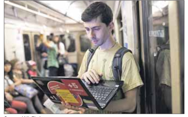
Скоро Wi-Fi будет на всех ветках московского метро

появится только по окончании монтажных работ. Скорость передачи данных у подземного Wi-Fi — от 70 до 100 Мбит в секунду. Роутеры монтируются не на станциях и пересадочных узлах, а прямо в подвижном составе. Одновременно в одном вагоне могут подключаться до 100 человек. Егор ПЕРЕЖОГИН