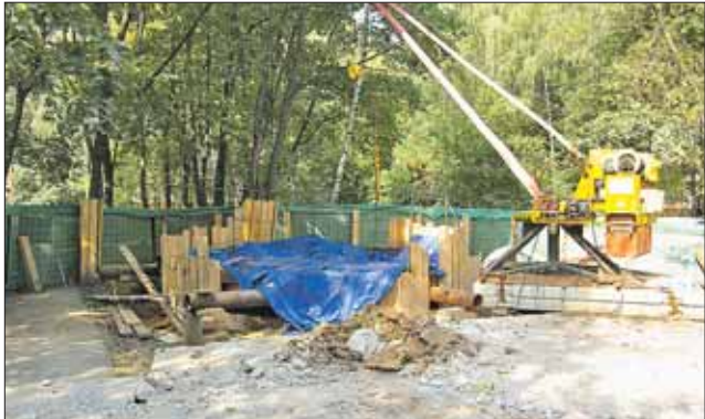
Работы ведутся уже 9 месяцев

По адресу: пр. Шокальского, 59 (корп. 2) – 63 (корп. 1) ещё в декабре 2013 года раскопали трубы для ремонта канализации. На щите было написано, что работы должны завершиться в мае 2014 года, сейчас уже август. Ничего не происходит. Рабочих не видно, а если они и бывали, то в основном сидели за сеткой. Разрытая канализация с открытыми трубами вот уже более полутора года отравляет наши дома. Дышать просто невозможно, особенно ночью. Очень хочется знать, когда же наконец жители указанных домов смогут вдохнуть полной грудью свежий воздух? Ольга С.