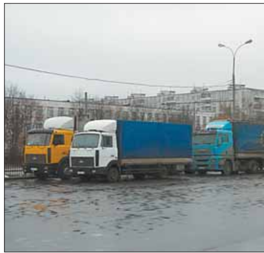
На автобусном круге на Холмогорской улице