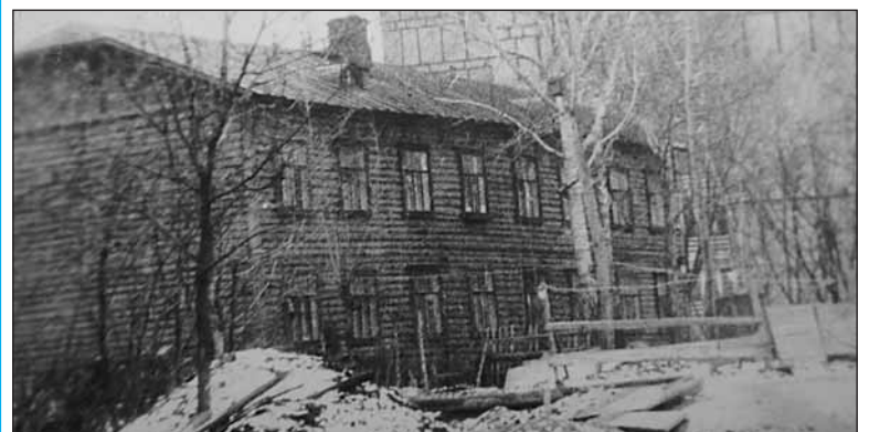
Так выглядел дом на улице Коминтерна в первой половине XX века