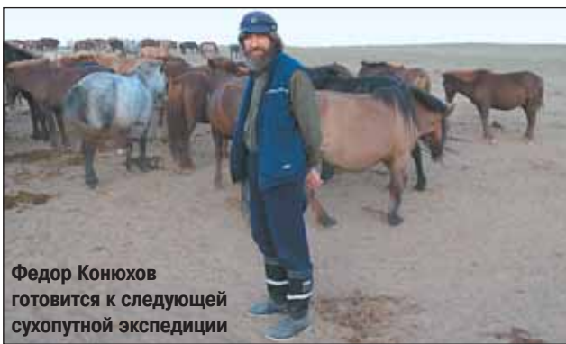
Федор Конюхов готовится к следующей сухопутной экспедиции

— Им по 93 года, отметили этим летом. Папа еще ничего, а мама уже плоховата... Они