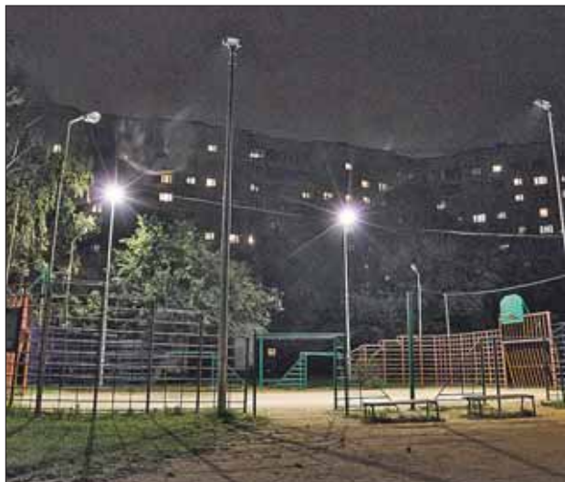
Освещенная по ночам спортплощадка во дворе дома 11 на улице Декабристов привлекает шумные компании

В редакцию регулярно обращаются жители с подобными жалобами. Один из адресов мы проверили. Спортплощадку во дворе дома 11 на улице Декабристов освещают аж 7