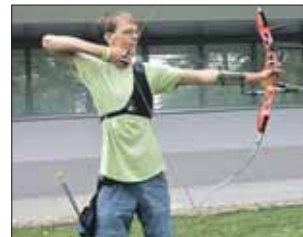
России и попасть в сборную страны.

Стрельбой из лука Ведомир занимается всего 3 года и, как признался «ЗБ» чемпион, в секцию он попал случайно, заодно с братом. Но теперь мечтает в сентябре по итогам первенства войти в тройку лучших в