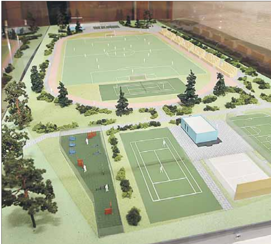
Таким будет спортивный комплекс после реконструкции