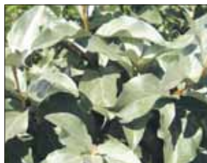
Сирень, клён татарский и лох серебристый рекомендованы для посадок в городе