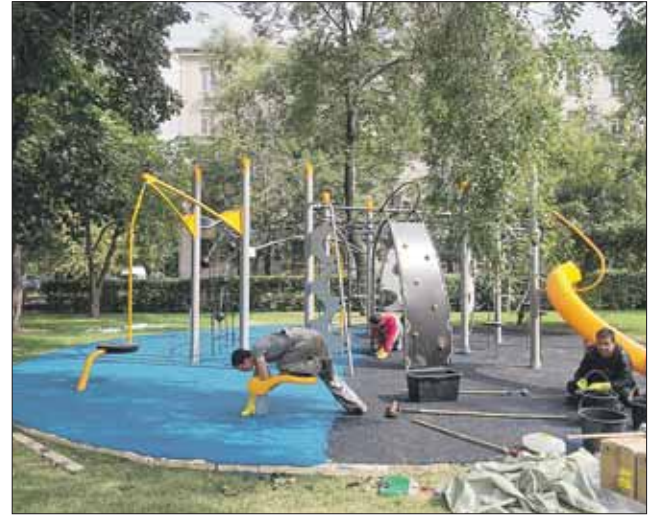
В центральной части парка разместились детские площадки

Пляж с душем и лежаками, прокат лодок и велосипедов, площадки для городков, паркура, воркаута, «зелёный офис» с Wi-Fi, шахматный клуб, танцплощадка, бельчатник — это лишь часть того, что появилось в филиале Лианозовского пар-