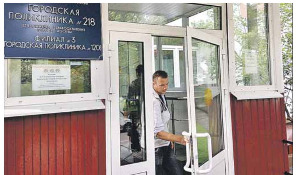
Сегодня поликлиника не справляется с потоком пациентов