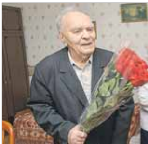
кового артиллерийского дивизиона получил за защиту Сандомирского плацдарма в Польше.