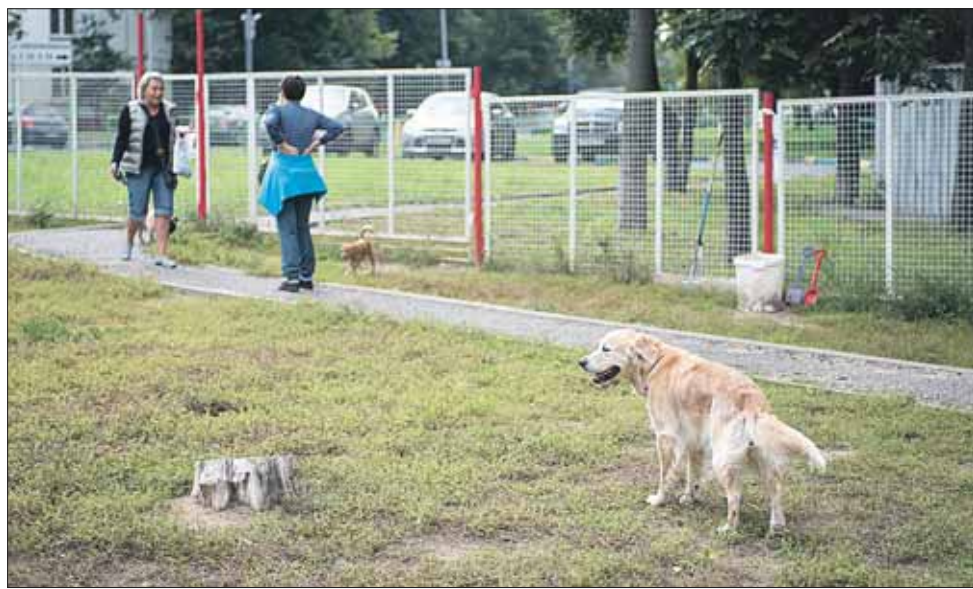
Выгул на улице Новоалексеевской пользуется популярностью у владельцев собак

Почему специализированные выгулы не пользуются популярностью у владельцев собак