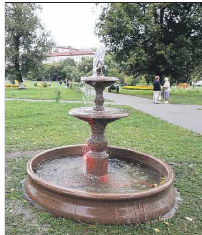
Новый фонтан в народном парке на Церковной горке