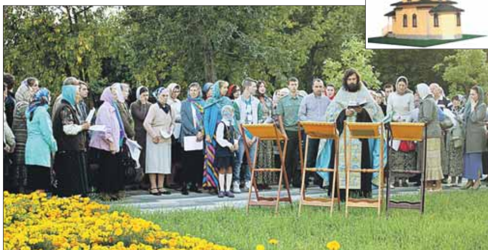
Пока храм не построен, верующие собираются на молебен в сквере, на месте будущего храма

Между тем молебен в сквере проходит не случайно. Именно на этом месте дол-