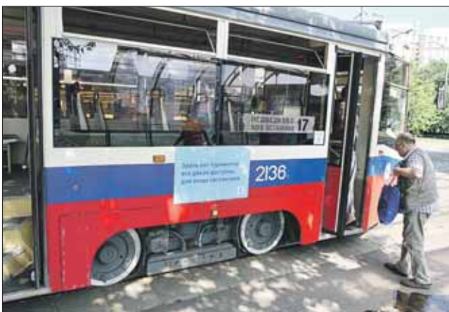
На 17-м маршруте пассажиры могут заходить в любую дверь трамвая

Трамвай №17 будет ходить без турникетов до конца года — такое решение принято Департаментом транспорта г. Москвы. Напомним, что турникеты на маршруте «Останкино — Медведково» в экспериментальном порядке отменили с начала лета. Пассажиры трамвая могут входить в любую дверь, а валидаторы для оплаты проезда стоят у каждого входа. Таким образом, отменяют ли турникеты по всей Москве, зависит от сознательности пассажиров 17-го трамвая.