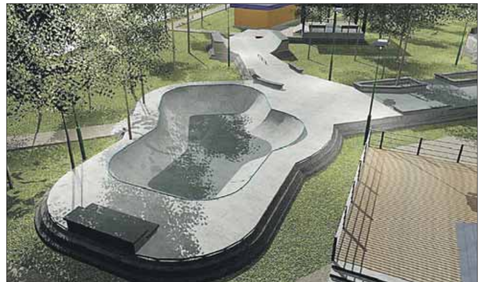
Так будет выглядеть скейт-парк

— В парке уже давно устраиваются ретровечера. Баянист играет мелодии из старых кинофильмов или времён войны.