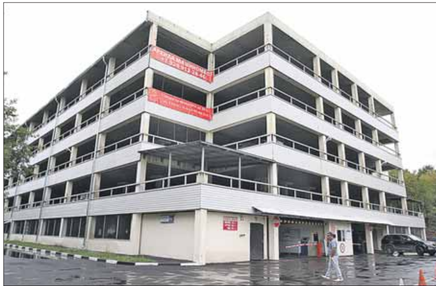
В народном гараже на Инженерной пустых мест больше половины

Вдобавок открытый паркинг — не гараж в привычном понимании. Оказалось, не все готовы платить крупные суммы за пользование неогороженной площадкой где-нибудь на третьем этаже. Если сядет аккумулятор,