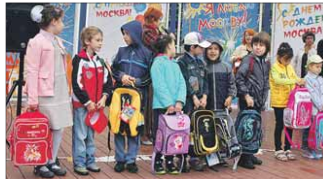
Так проходила акция в Отрадном

5 тонн одежды, 720 книг, 474 ранца и многое другое собрали в СВАО для школьников из малообеспеченных семей в ходе акции «Соберём ребёнка в школу!».