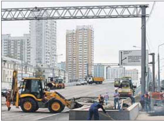
Запуск эстакады намечен на 3 сентября