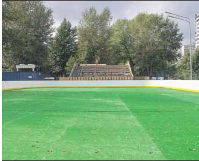
Стадион станет местом тренировок и турниров по футболу