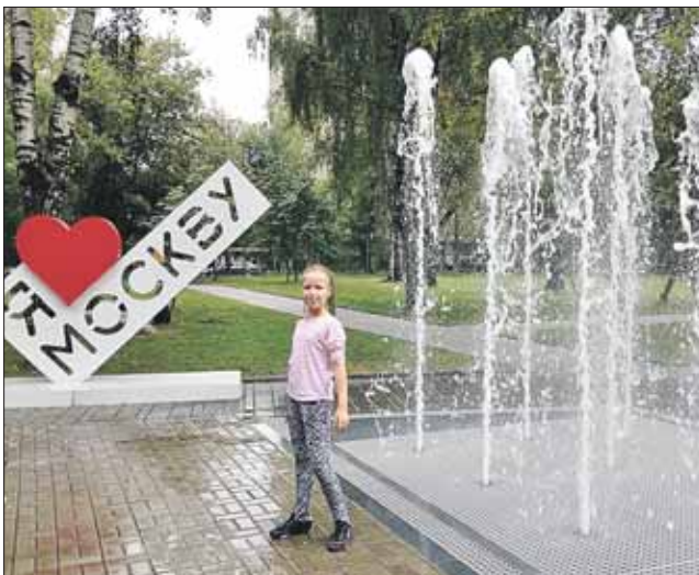
По вечерам фонтан становится светомузыкальным

Первый в Москве «сухой» фонтан появился справа от главного входа. Струи воды бьют из-под земли на высоту около 3 метров. «Сухим» фонтан называют из-за отсутствия чаши бассейна: вода уходит обратно через решётки. По вечерам фонтан превращается в театральную площадку. Здесь включается подсветка, а струи «танцуют» под музыку.