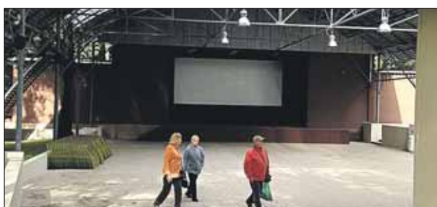
В ближайшее время начнёт работать летний кинотеатр