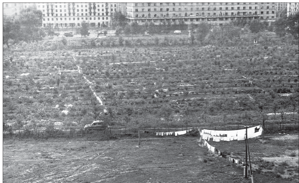
Таким был яблоневый сад у Бутырского хутора в 1960-х годах. Вид из дома 1/2 на улице Руставели