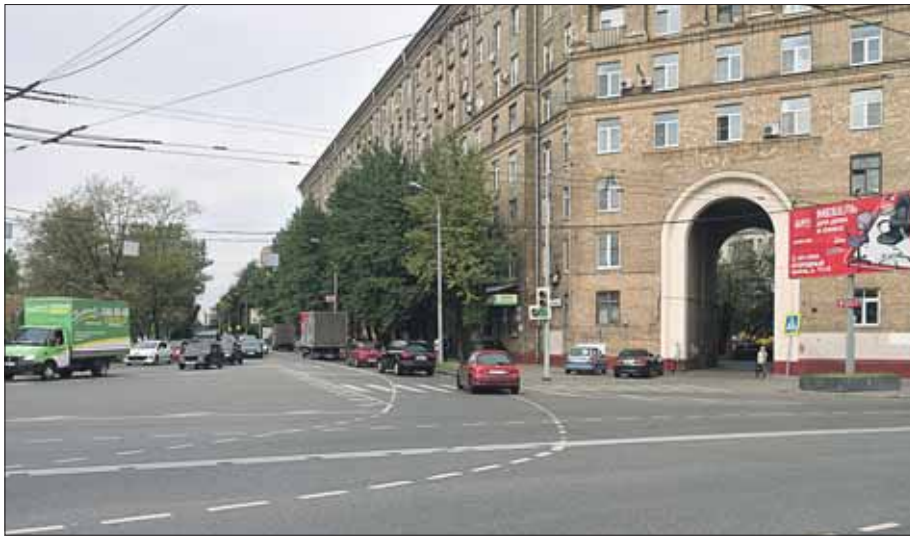
Работы планируется завершить до конца ноября

— Расширение улицы Яблочкова разгрузит дворы и увеличит пропускную способность улично-дорожной сети, — говорит