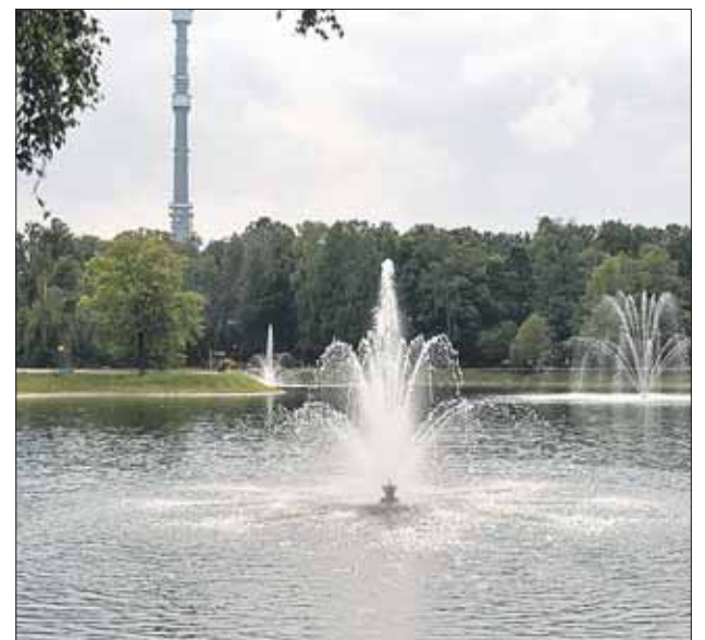
На поверхности пруда появится плавающий фонтан — это не даст воде цвести