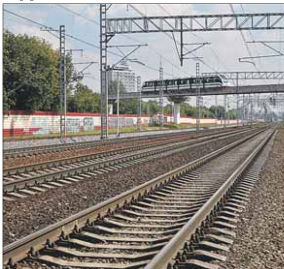
Скоро здесь начнётся строительство перехода