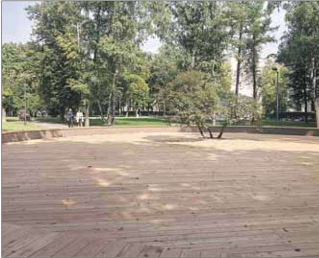
На танцплощадке будут проводить танцевальные вечера