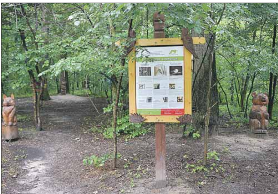
Протяжённость буферной зоны около 4 км

После реконструкции спорткомплекс сможет стать местом проведения соревнований городского масштаба