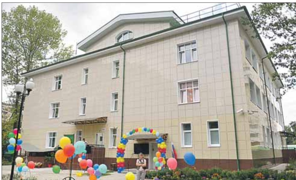
Новое здание на Молодцова, 5б, уже 2 сентября примет 95 ребят