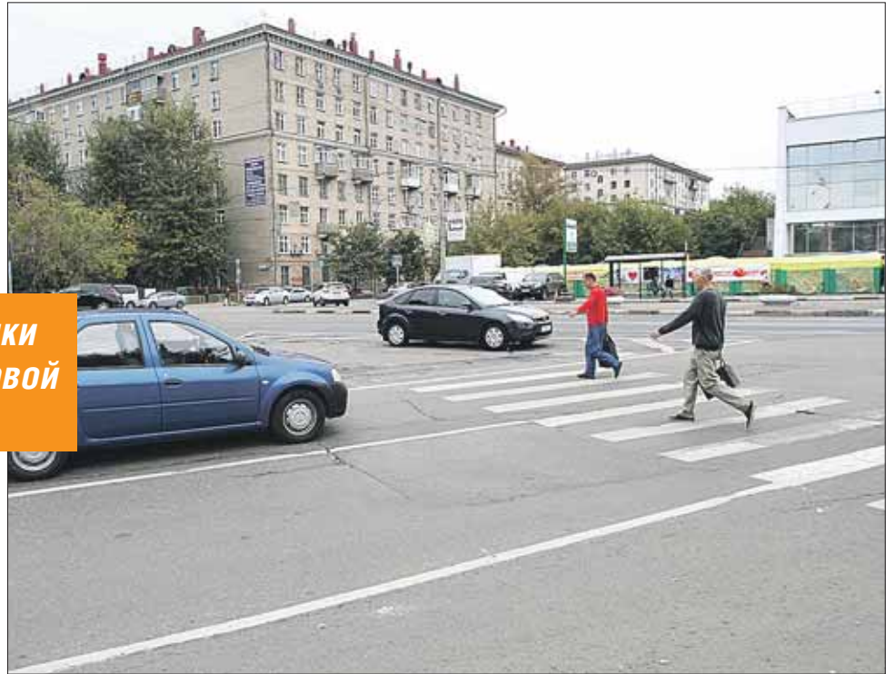
Одна из самых загруженных точек — круговое движение в месте пересечения 5 улиц