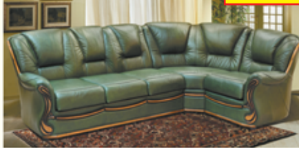
«Изабель-2», угловой диван-кровать, 100% кожа, механизм трансформации «Спартак», разм. 2830*960*1770, с/м 1350*1860