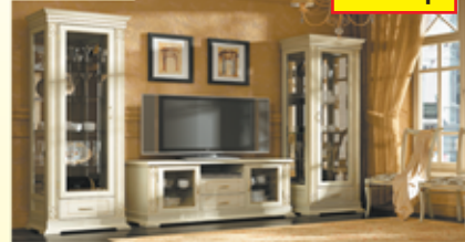
Гостиная «Верди», крашение «беленый дуб» (массив дуба)