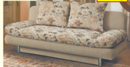
«Фантазия», тахта с механизмом «еврокнижка», ящик для белья, разм. 1920*870*900, с/м 1900*1350