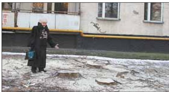
Тех, кто спилил деревья на улице Грекова, будет искать милиция