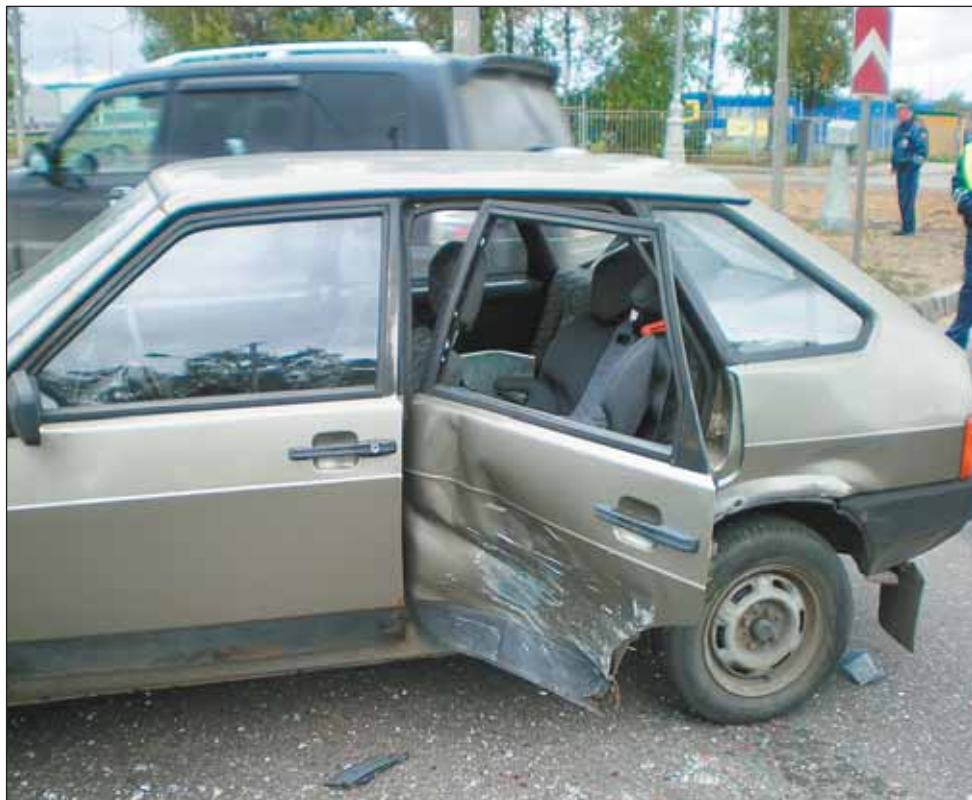
ДТП на Дмитровке. Удар пришелся туда, где сидела пятилетняя девочка, но она была пристегнута в кресле, и все обошлось

Но надо еще учесть, что взрослые сами часто нарушают правила, идя через дорогу с собственными детьми. Из 19 наездов на детей, случившихся в присутствии взрослых, 13 — по вине самих пешеходов. Среди детей, гуляющих самостоятельно, доля таких случаев заметно меньше. Интересно, что девочки, переходя дорогу без старших, попадают под машину по собственной неосторожности еще реже, чем дети в целом.