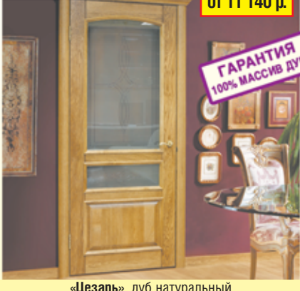
«Цезарь», дуб натуральный

АКЦИЯ! скидки до 30% НА ДВЕРИ ИЗ 100% МАССИВА ДУБА