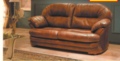
«Иорк», трехместный диван-кровать, 100% кожа, механизм трансформации «Дионис», разм. 2230*1070*1080 с/м 1350*1860