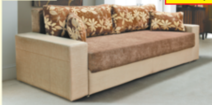
«Софи-4», трехместный диван-кровать с механизмом «еврокнижка», ящик для белья, разм. 2400*900*1000, с/м 1500*2000