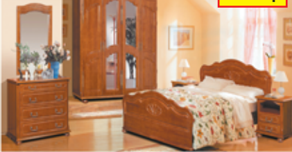
«Ромашка», набор для спальни из массива ольхи