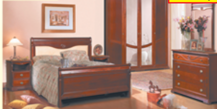
«Лица», крашение «вишня», набор для спальни из массива дуба