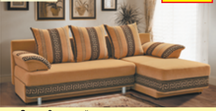
«Олимп-3», угловой диван-кровать с механизмом «еврокнижка», два ящика для белья, разм. 2190*790/930*1360, с/м 2190*1320