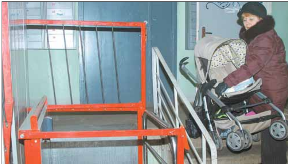
На Полярной, 32, коляску приходится таскать на руках