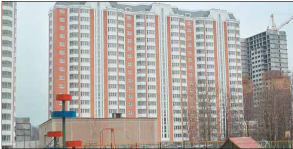
Многokвартирные дома в районе Северный объединяют в квартальные ТСЖ. Но жители новостроек требуют сначала устранить строительные недостатки

Начиная с 2007 года в суд было подано 27 исковых заявлений на незаконность создания ТСЖ. Сегодня признано незаконным создание 17 ТСЖ. А всего за два прошедших года от граждан поступило около 200 обращений граждан по вопросам создания и деятельности ТСЖ. Весной этого года началась проверка. В ТСЖ в Ростокине и Свиблове часть жителей получили уведомления о проведении общего собрания менее чем за 10 дней до окончания голосования. Не было уведомлений о проведении общих собраний в ТСЖ в Бутырском районе и Южном Медведкове. В целом нарушения обнаружены в каждом третьем проверенном товариществе. Виновных привлекли к дисциплинарной ответственности, некоторых уволили. Сегодня нарушения устранили в 51 товариществе (проведены новые общие