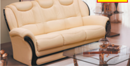
«Мартель», трехместный диван-кровать, 100% кожа, механизм трансформации «Спартак», разм. 1920*1070*1000 с/м 1350*1860