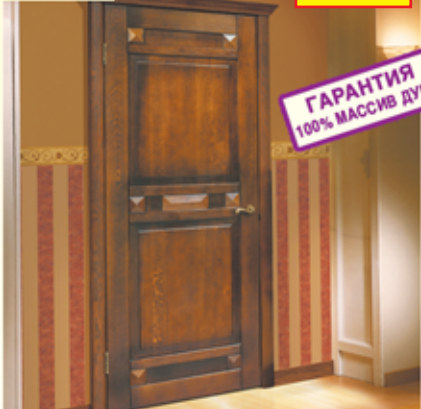
«Фараон-2», дуб античный