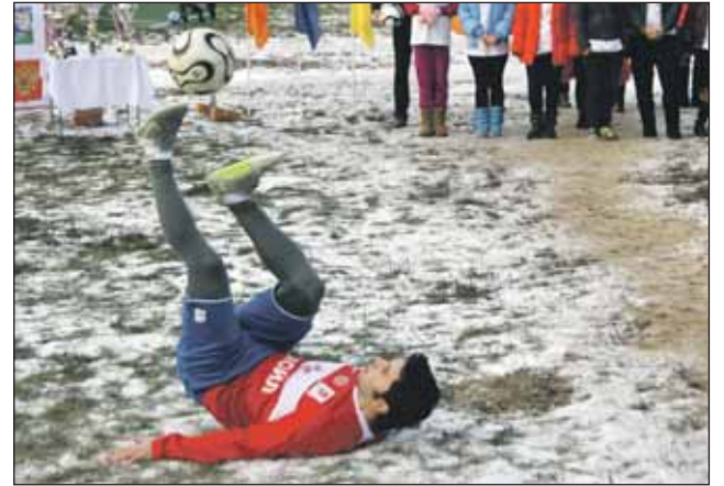
Закладке капсулы предшествовало небольшое футбольное шоу