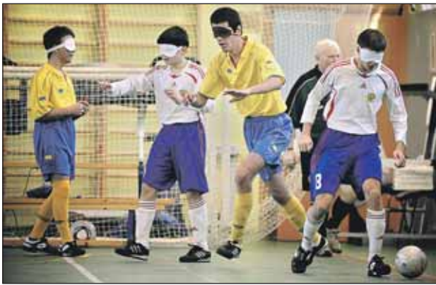
Сборная СВАО победила школу-интернат №1 из Алексеевского района

В Москве в ФОКе «Марьино роцца» прошёл второй московский турнир по футболу среди слепых (категория В1) на кубок ГУ «Гражданская смена». В нём приняли участие 4 команды, 3 из которых представляли наш округ: сборная СВАО, школа-интернат №1 (Алексеевский район) и центр детского творчества «Алексеевский», а также слепые футболисты Российского государственного университета физической культуры (ГУФК).