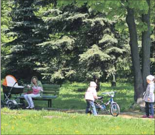
В Останкинском парке планируют обустроить спортивный городок

Социальная поддержка москвичей в следующем году существенно увеличится. Как было отмечено на коллегии префектуры, в нашем округе это коснётся более 100 тысяч семей с детьми. Ежемесячные пособия на детей от 1,5 до 3 лет вырастут в 2 раза, размер ежемесячных компенсационных выплат матерям, родившим