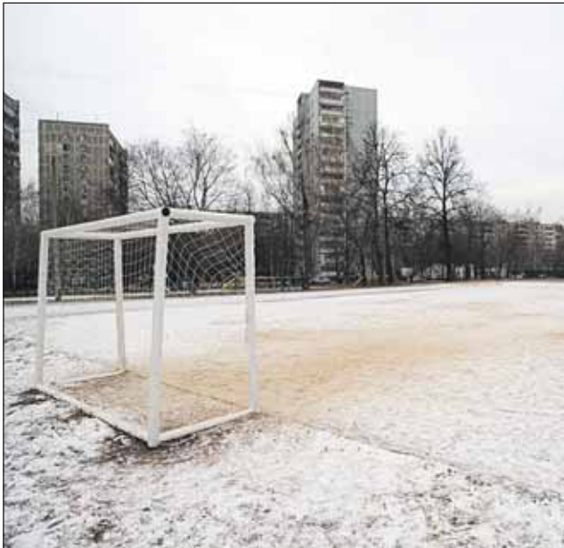
Улица Палехская, 8: здесь будет самая большая ледовая площадка среди всех межшкольных стадионов

Ближе к стабильным холодам под катки заливают 175 площадок, что на 60 больше, чем в прошлом году (тогда заливали 115 площадок). Из них 13 — это межш-