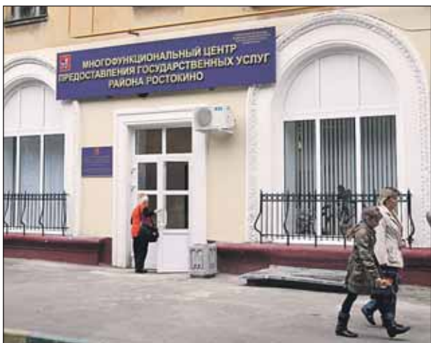
ном Медведкове, на Полярной, 2, в Северном Медвед-

Подобные центры уже открылись в Свиблове на Игарском проспекте, 8, в Юж-