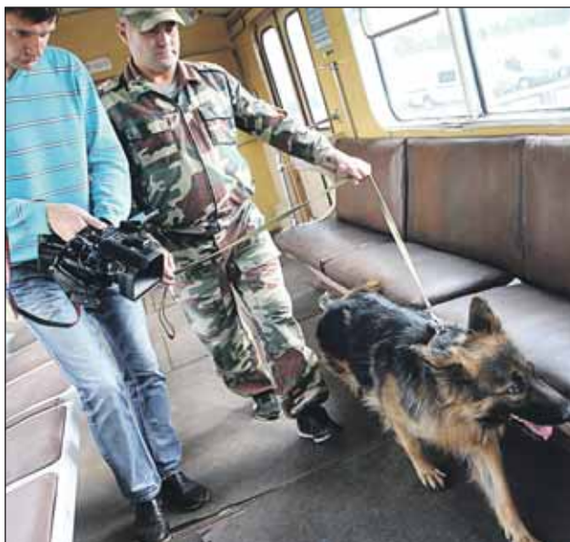
На службе в метрополитене — 103 собаки

— Всего у нас на службе 103 собаки. Называем их офицерами полиции, — рассказывает майор Тебенко. —