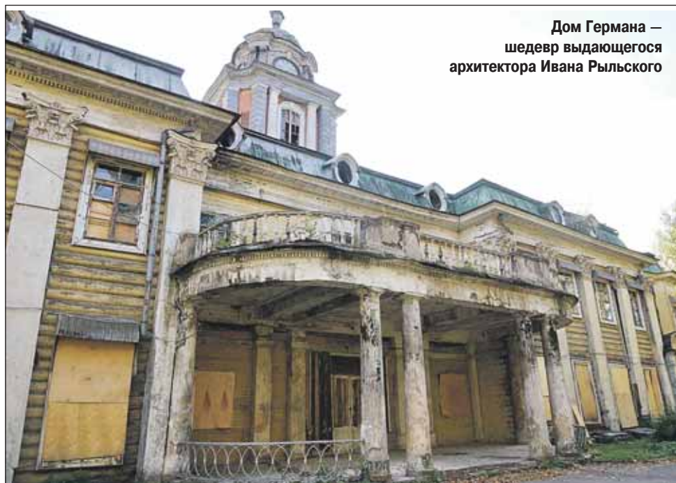
Дом Германа — шедевр выдающегося архитектора Ивана Рильского

— Здание ещё можно спасти, — уверен историк усадьбы, клирик храма Ризоположения в Леонове иерей Владис-