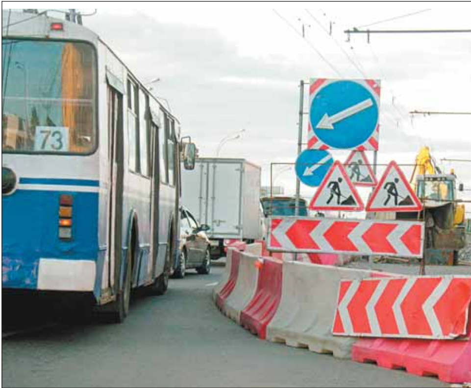
На путепроводе перед началом Алтуфьевки

Пока ремонт идёт по графику. Как сообщили в ОБ ДПС ГИБДД УВД по СВАО, ордер на производство работ на проезжей части открыт до 1 декабря. Ремонтники и вовсе надеются уложиться к ноябрю. Кстати, в начале ремонта инспекторы ГИБДД оштрафовали их за нарушение требований при производстве работ. Ремонтникам пришлось уменьшить длину «захватки» и добавить необходимые знаки. Сейчас недочёты устранены.