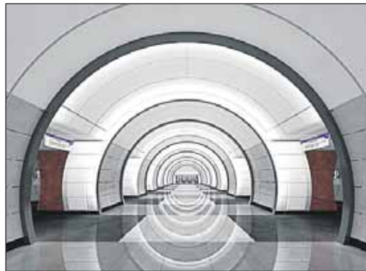
Такими будут станции «Бутырская» и «Фонвизинская»