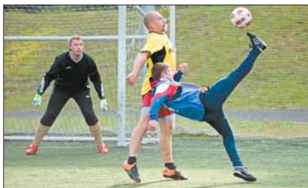
Матч между командами из Бибирева и Лианозова закончился боевой ничьей 1:1

22 сентября на межшкольных стадионах СВАО стартовал 15-й, юбилейный Кубок Сергея Широкова по дворовому футболу. В нём принимают участие 54 команды, представляющие СВАО, ЦАО, САО, ВАО столицы, а также Солнечногорский район Подмосковья и город Реутов. В основной группе — 33 команды, в женской — 11, в ветеранской — 10.