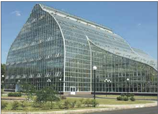
В новой оранжерее будет климат-контроль

Спонсорские средства могли бы помочь отреставрировать башенку у входа в Ботанический сад со стороны улицы Комарова. Некогда она была визитной карточкой сада. Необходимо привести в поряд-