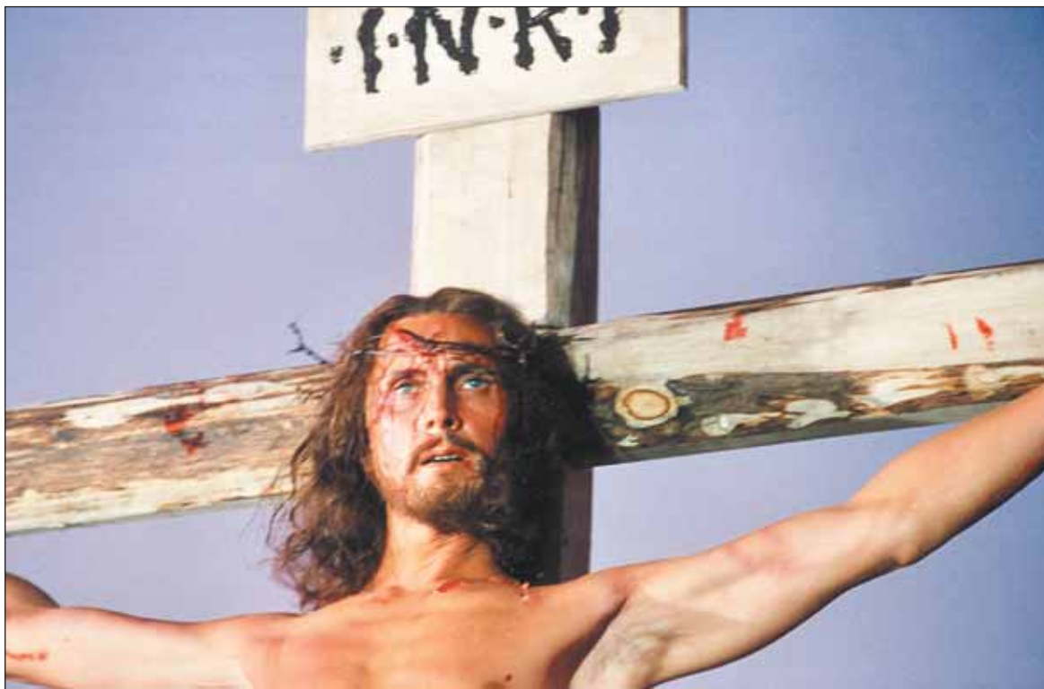
Кадр из фильма «Мастер и Маргарита»

— Я только сейчас узнал, что Кара предполагал взять на эту роль прекрасного артиста Бориса Плотникова (доктор Борменталь в «Собачьем сердце». — Ред. ) И сегодня я понимаю, что Плотников был близок к этой роли. А тогда я в гордыне Каре заявил, что, в общем, я практически один из всех актеров советского кино сейчас более-менее к этому готов. Но когда мне объявили, что художник утвердил меня, я в этот же миг дал отказ по телефону. Я сильно сомневался: имеем ли мы, грешные артисты, право касаться такого образа. И все мои православные родственники были против, и моя сестра даже ездил на остров Залит к старцу протоиерею Николаю Гурьянову жаловаться, что вот наш брат взялся за такое, что мы все против и его отговариваем. И вдруг он отвечает: «А зачем вы отговариваете? Все