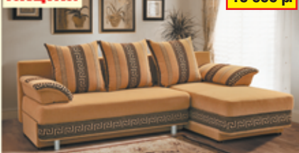
«Олимп-3», угловой диван-кровать с механизмом «еврокнижка», два ящика для белья, разм. 2190*790/930*1360, с/м 2190*1320