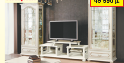
«Давиль», гостиная, массив дуба