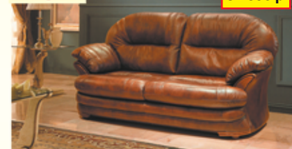
«Иорк», трехместный диван-кровать, 100% кожа, механизм трансформации «Дионис», разм. 2230*1070*1080, с/м 1350*1860