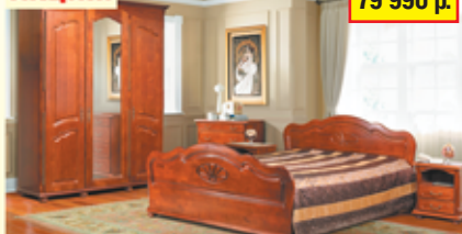
«Ромашка», набор для спальни из массива ольхи