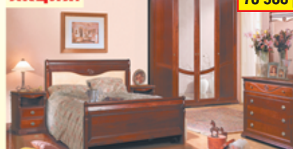
«Ли́ка», набор для спальни из массива дуба, крашение «вишня»