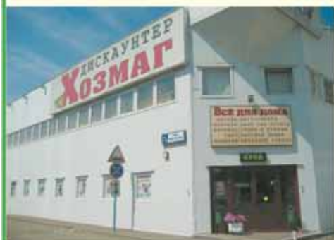
м. «Тимирязевская», ТЦ «Депо МОЛЛ» ул. Яблочкова, 21д, т. (495) 639-7409

Чтобы последние предновогодние дни не превратились в сплошную беготню по магазинам в поисках подарков, советуем уже сейчас зайти в магазин товаров для дома «Дискаунтер». Он расположен прямо у станции метро «Тимирязевская» в доме 21д по улице Яблочкова. Такой же магазин есть на 3-й Парковой. Здесь вы сможете приобрести не только красивые, оригинальные, но и нужные подарки. Благо в магазине представлено более 70 тысяч наименований товаров. Едва переступил порог, вы окунетесь в атмосферу праздника: ново-