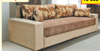
«Софи-4», трехместный диван-кровать с механизмом «еврокнижка», ящик для белья, разм. 2400*900*1000, с/м 1500*2000