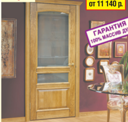
«Цезарь», дуб натуральный

АКЦИЯ! скидки до 30% на двери из 100% МАССИВА ДУБА