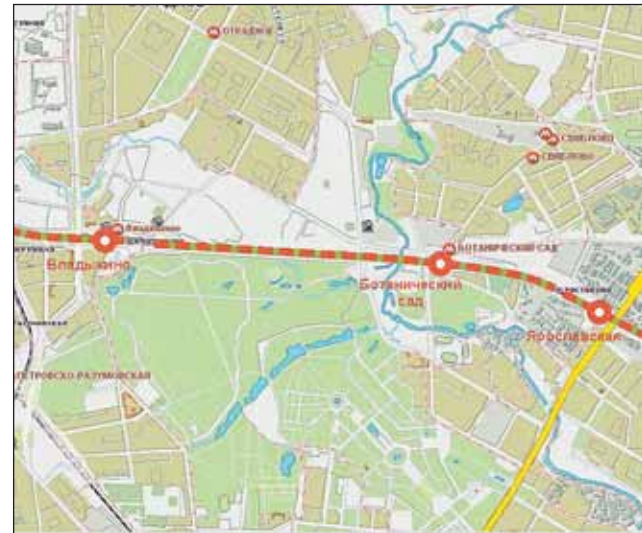
В округе будет три станции: Ботанический сад, Владыкино и Ярославская

нее резко возрастет. Кроме того, нужна диспетчеризация пассажирского движения, то есть создание новой системы управления дорогой.