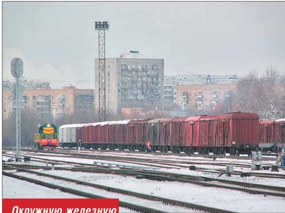
Окружную железную дорогу открыли в 1908 году

На Окружной предполагается построить 30 пассажирских станций. Их расположение, конечно, не будет со-