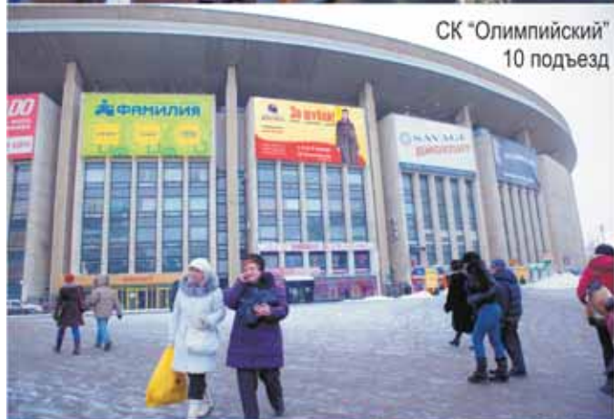
СК "Олимпийский" 10 подъезд

СК "Олимпийский", 10 подъезд. Москва, Олимпийский пр-т., 16, (м. пр-т Мира) Ярмарка работает с 10.00 до 19.00.