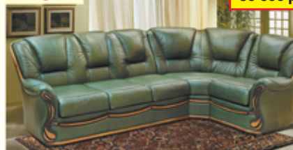
«Изабель-2», угловой диван-кровать, 100% кожа, механизм трансформации «Спартак», разм. 2830*960*1770, с/м 1350*1860