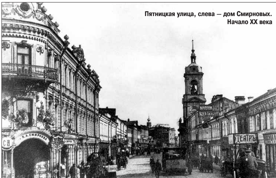
Пятницкая улица, слева — дом Смирновых. Начало XX века

Сын Арсения Петр первым в России освоил производство отечественных «высших питий» — так называли особо качественные водки, наливки и настойки. Ассортимент состоял из 4 сотен чистейших сортов: если по алфавиту, то от «Абсента швейцарского», «Бальзама Рижского» и водки