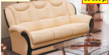
«Мартель», трехместный диван-кровать, 100% кожа, механизм трансформации «Спартак», разм. 1920*1070*1000, с/м 1350*1860