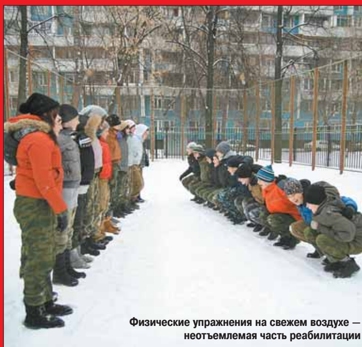
Физические упражнения на свежем воздухе — неотъемлемая часть реабилитации

На улице Проходчиков несовершеннолетним алкоголикам и наркоманам помогают избавиться от зависимости