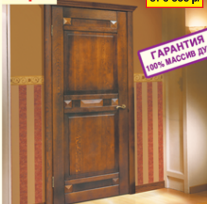
«Фараон-2», дуб античный