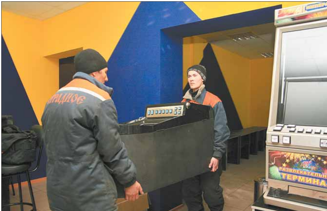
Вывоз «тела» из клуба на Каргопольской улице в Отрадном