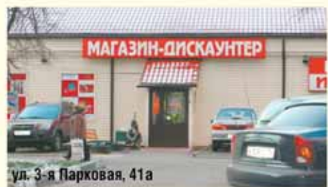
ул. 3-я Парковая, 41а