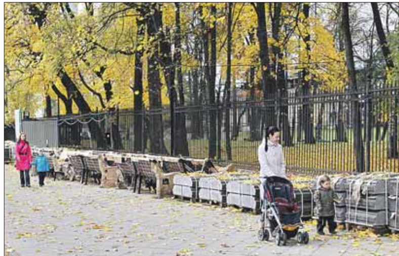
Реконструкция Останкинского парка продолжается

— Мы стараемся максимально сохранить растительность, но парк требует очистки. Останкинский парк считается английским пейзажным парком XVIII века, а в 1990-е годы, когда санитарную очистку не проводили, тут выросло большое количество деревьев-сорняков. Эту поросль и