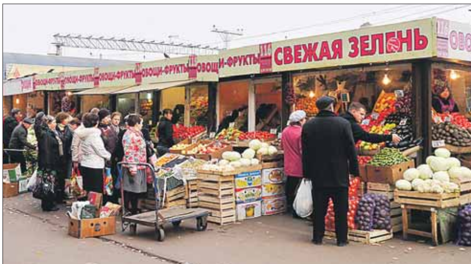
Буквально каждый пятачок оккупирован торговцами