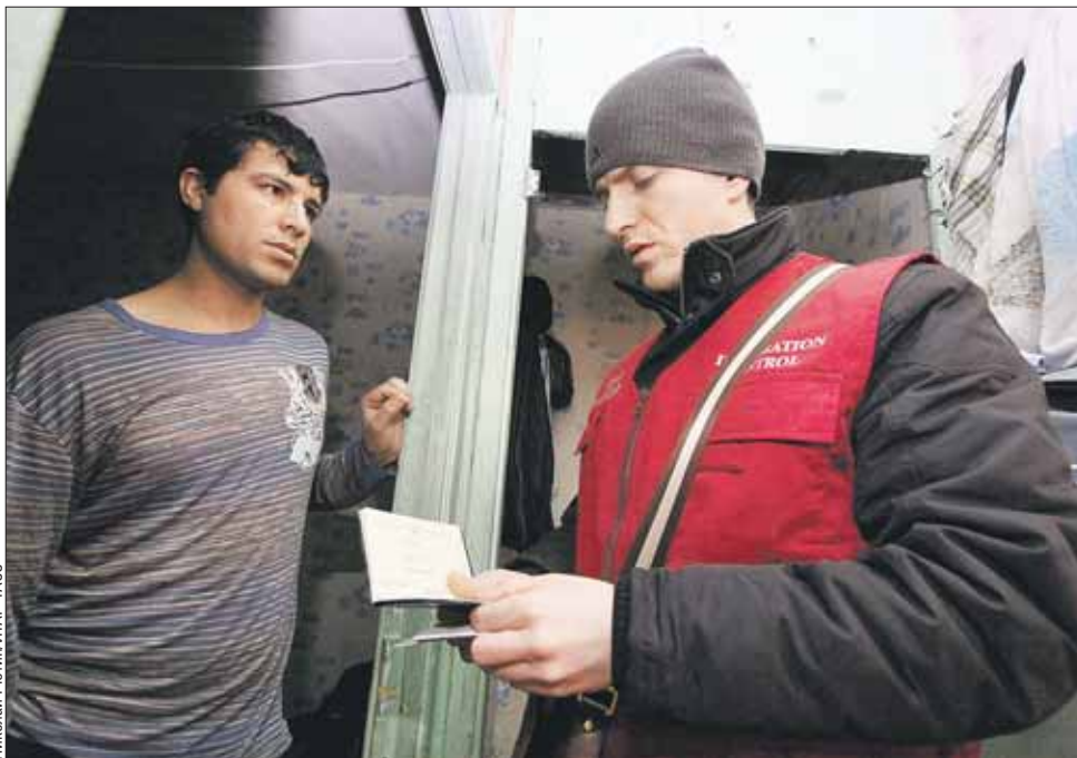
Заселять мигрантов в подвалы и подсобки домов нельзя. Но они всё равно там живут

— Очень мне такое соседство не нравится, — возмущён один из жителей подъезда. — Из подсобки чем-то воняет. К жителям 2-го и 3-го этажей оттуда лезут тараканы. И