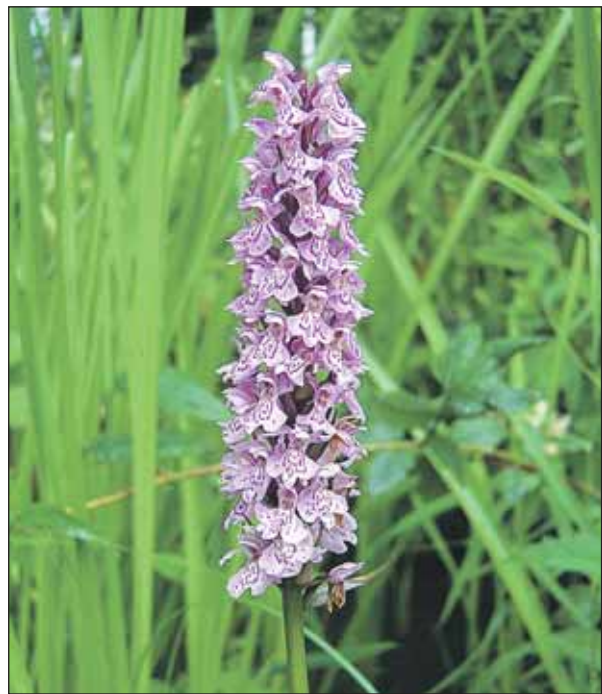
Жителей Скандинавии таким цветком не удивишь, а в Москве он обнаружен впервые

Сенсационную находку сделали экологи Управления ООПТ по СВАО: в Хлебниковском лесопарке они обнаружили редчайший для наших краёв цветок — северную орхидею — пальчатокоренник пятнистый. До этого в Москве его не встречали ни в одном заказнике, а в Подмоскovie он очень редок и занесён в Красную книгу.