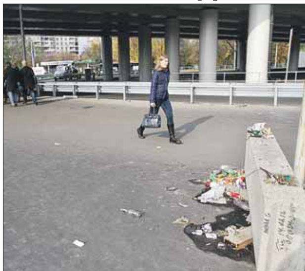
Под эстакадой копят горы мусора

Наш корреспондент удостоверился: под недавно возведённой эстакадой на Ярославке практически у каждого столба — будь то фонарь освещения или светофор — навален мусор. На новеньком асфальте пустые бутылки, бумажки и рваные упаковки смотрятся особенно неприятно. Уборкой на городских