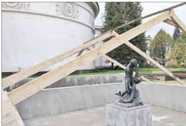
«Мальчик и рыба» — старейший фонтан на ВВЦ