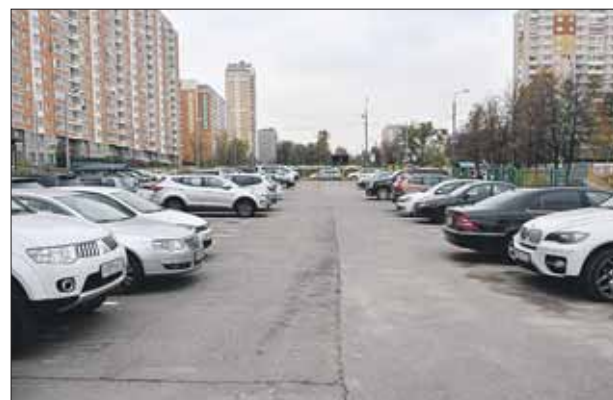
Та самая парковка на улице Грекова