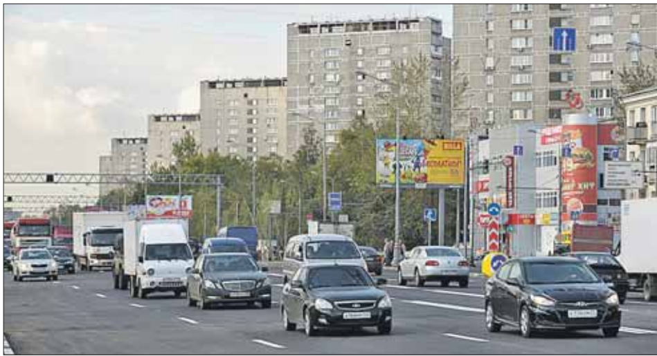
Теперь по Ярославке стали ездить и те, кто раньше пользовался другими трассами