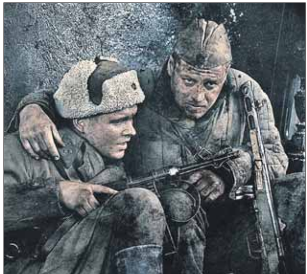
«Сталинград» стал самым ожидаемым фильмом этой осени