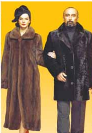
Норковая шуба «Элегия», 98 000 руб. Мужская шуба «Форест», 31 980 руб.