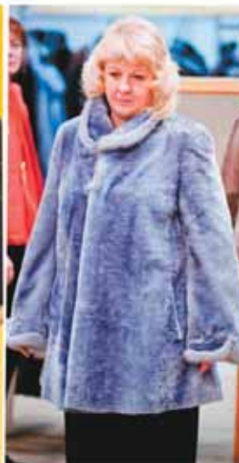
Овчина-премиум, «Мадам», 31 980 руб.

«ЖЮЛИ» — мутон с пушиной». На воротниках, манжетах, капюшонах таких шуб — норка, каракуль, серебристо-чёрная лиса, енот, фрот, песец. Силуэты подчеркивают стройность фигуры. Цена — от 24 до 62 тысяч рублей.