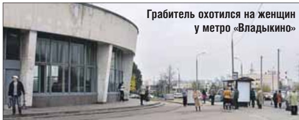
Грабитель охотился на женщин у метро «Владыкино»