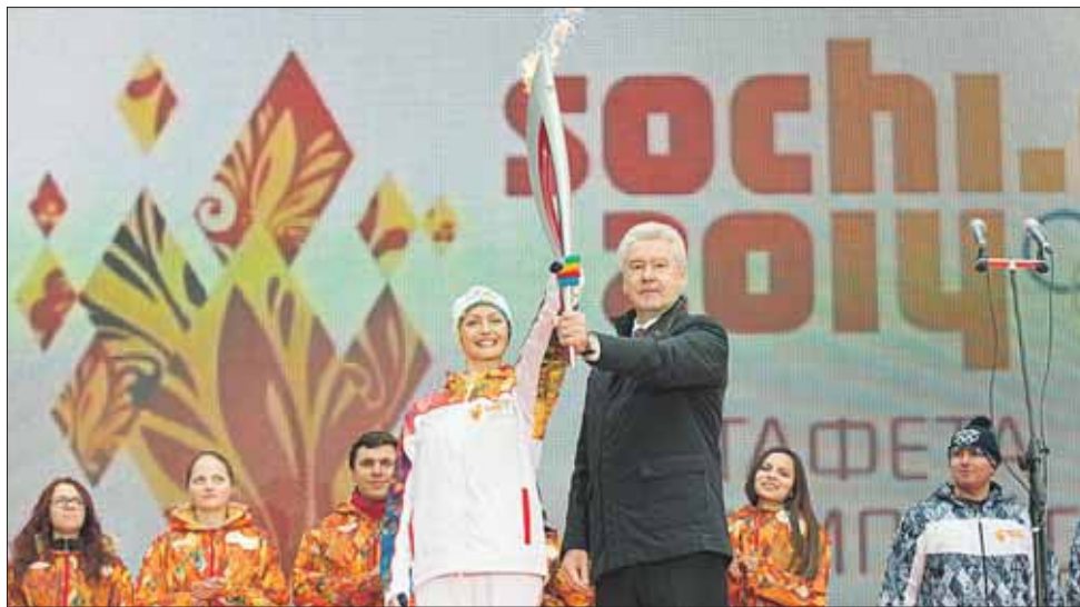
Старт эстафете в Москве дал Сергей Собянин

правила в оргкомитет. Не представляете, какая обрадовалась, когда меня выбрали среди сотен других претендентов! — сказала она. — Я всегда занималась спортом, как и любой спортсмен, мечтала об участии в Олимпиаде. И хотя чемпионом не стала, это событие много значит для меня.