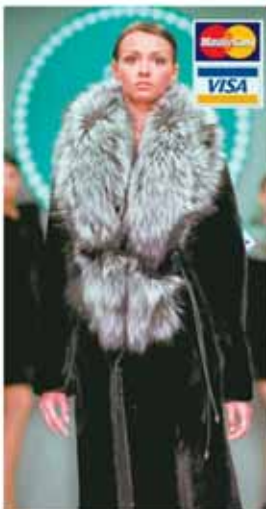
Мутон с пушиной, «Кармен», 43 980 руб.

Модниц на Новоторжской ярмарке порадуют мутоновые шубы прилегающих и модных силуэтов из коллекции