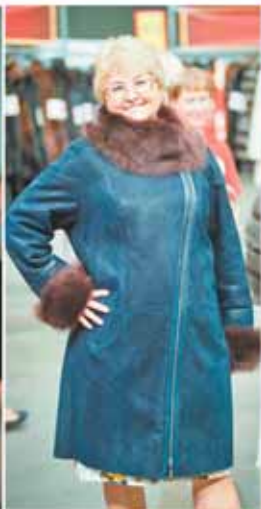
Дублёнка «Токио», 41 980 руб.