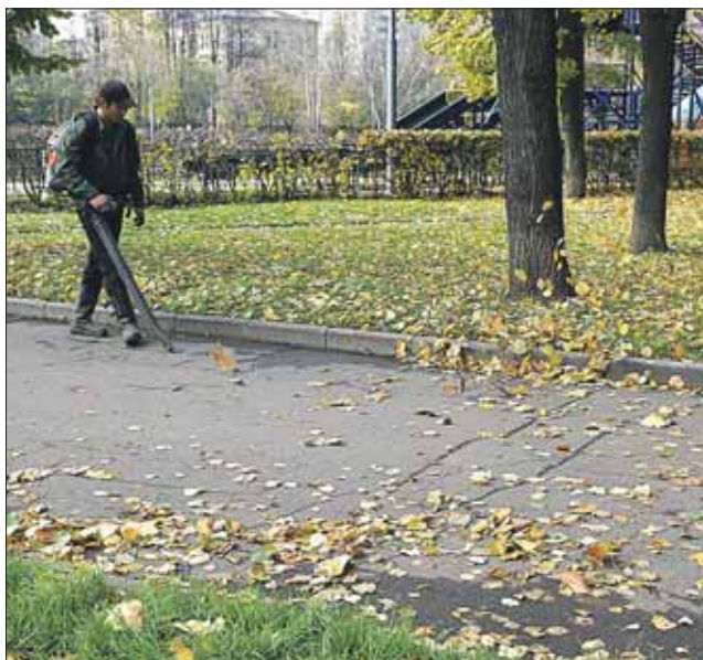
Отказаться от уборки опавшей листвы можно

Тем не менее отказаться от уборки листьев рядом с домом можно. Так, например, сделали жители дома ба на