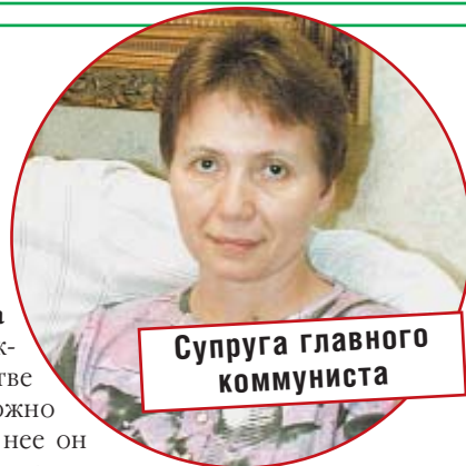
Супруга главного коммуниста