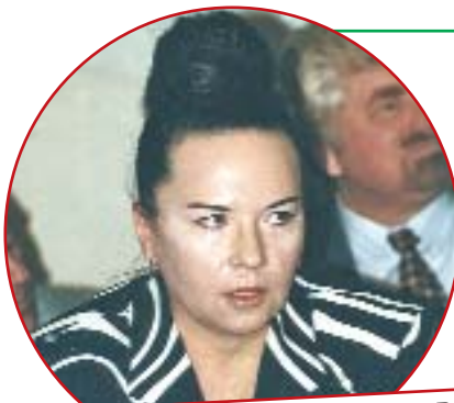
«Половинка» лидера ЛДПР

Французы не зря говорят: «Ищите женщину». От кого, как не от женщин, зависит то, как выглядят мужчины, что они едят и пьют, как спят... А ведь и кандидатам в президенты ничто человеческое не чуждо.