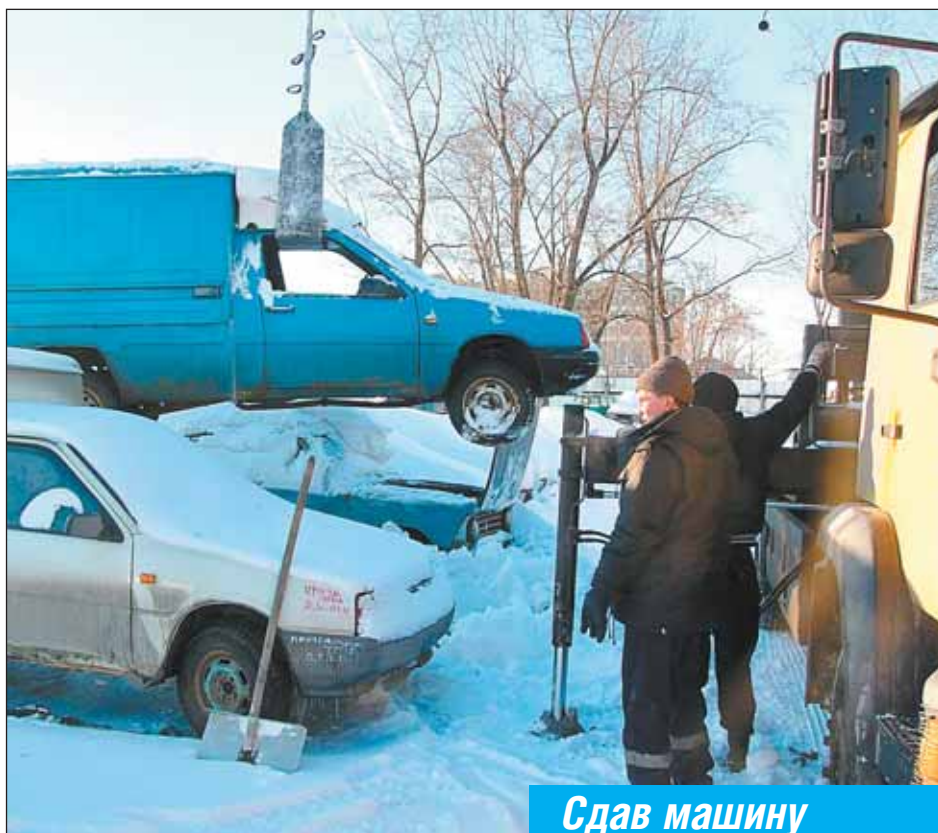
На территории предприятия

С марта прошлого года в стране действует программа Минпромторга РФ. По ней, сдав старое авто, можно получить 50 тысяч рублей в счет покупки нового. Правда, новую машину можно купить не всякую: ее надо выбрать из списка, включающего несколько десятков моделей разных фирм, но все они соби-