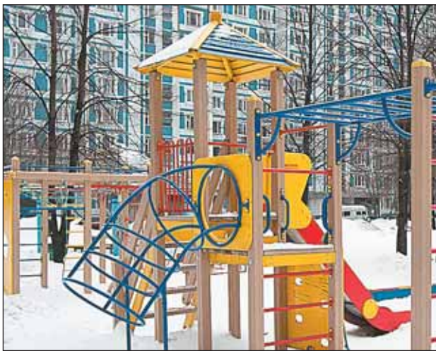
После ремонта площадки будут выглядеть так, как на улице Чичерина, 8, корп. 2