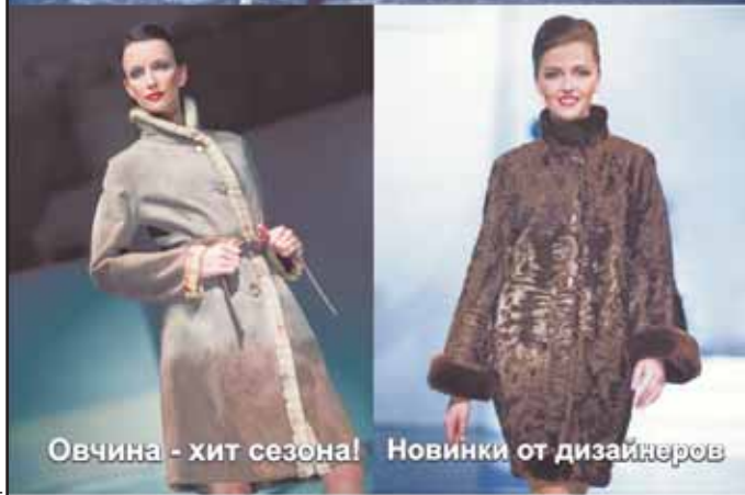
Овчина - хит сезона!

с 17 по 20 февраля 2011 СК «Олимпийский»