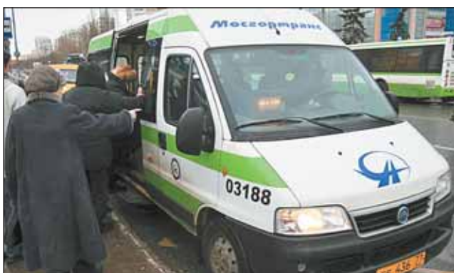
У метро «Отрадное»

На автобусных маршрутах №605 и 124 совместно с большими машинами давно уже работают 18-местные микроавтобусы «Фиат» ГУП «Мосгортранс». Эксперимент оказался удачным.