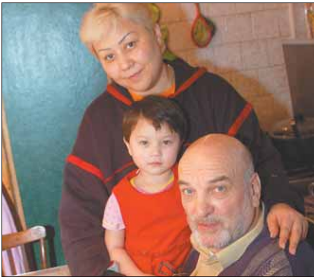
С женой и дочкой