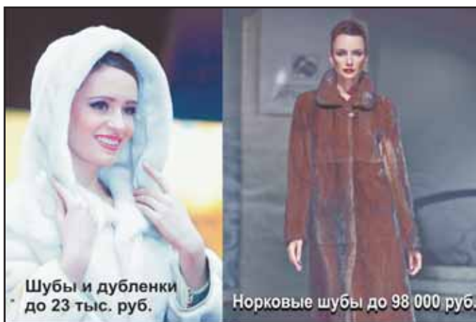
Шубы и дубленки до 23 тыс. руб.