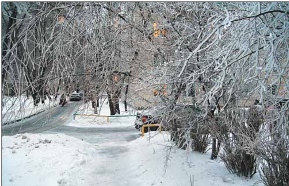
На улице Гончарова, 3, после ледяного дождя

— Ослабленные после слома веток деревья восприимчивы к любой инфекции, — говорит дендролог, научный