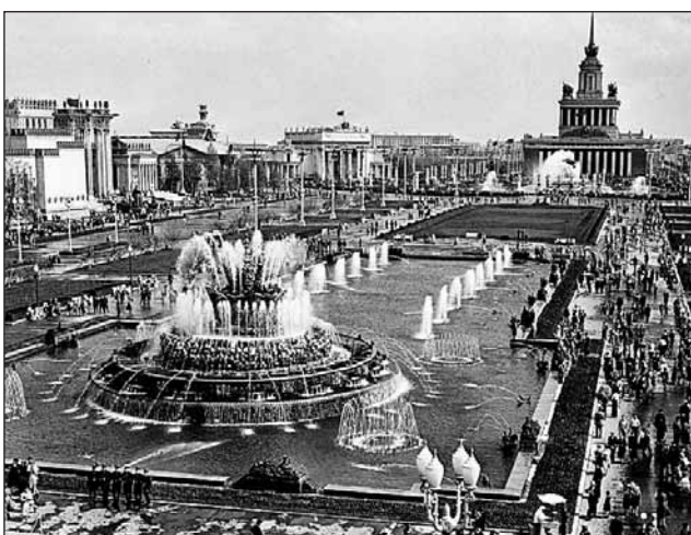
ВДНХ. 50-е годы XX века