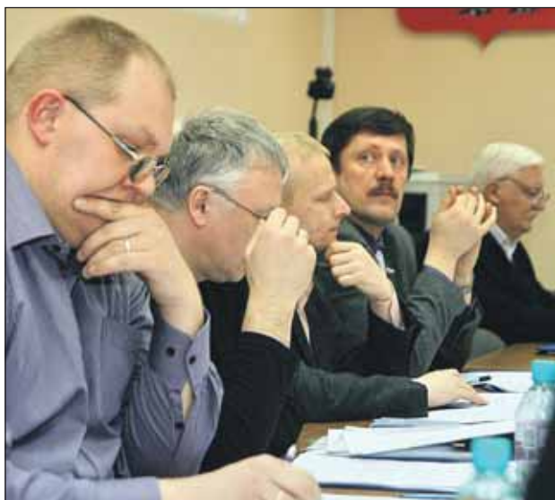
На муниципальных собраниях обсуждаются важные для района проблемы: строительство, снос, благоустройство

Все выдвиженцы представили в территориальные избирательные комиссии (ТИК) первые финансовые отчёты. Те, кто не собирал подписи, были избавлены от денежных трат, поэтому у них на счету всего 10 рублей. А вот собиравшие под-