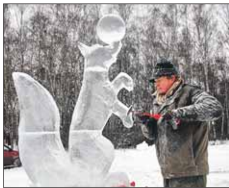
В заказнике «Медведковский»