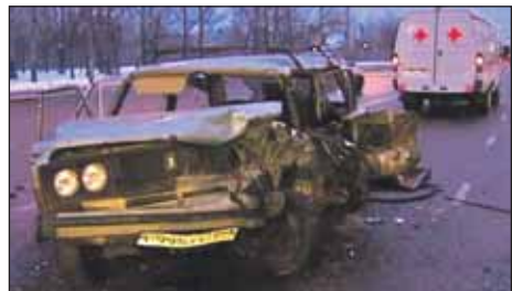
Водитель «шестёрки» погиб на месте