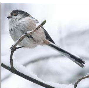
щеница Антон Шапурко, — и ранее в нашем округе её

Очень редкий вид синицы: длиннохвостая, или ополовник, — случайно заметили в ходе учёта водолавающих сотрудники Управления ООПТ по СВАО в пойме Яузы, в районе моста между Полярной и Кольской улицами.