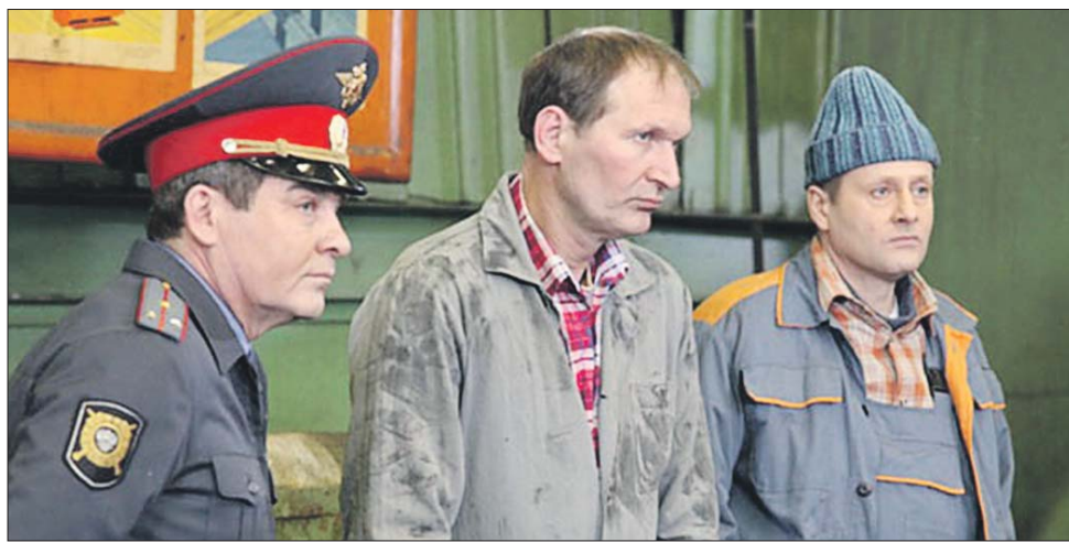
Эпизод из шоу «6 кадров»