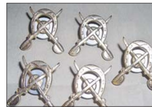
Эмблемы кавалерийских полков времён СССР

— Однажды мне довелось делать фотосъёмку реконструкторов, снимать конную