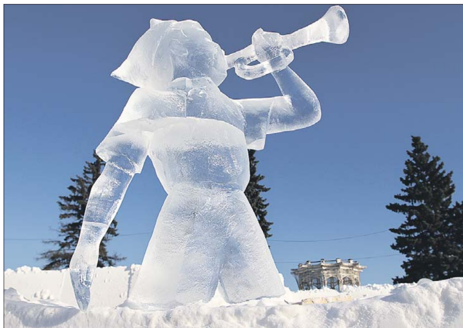
Ледяные скульптуры выполнены в стиле соцреализма

Лабиринт из льда и снега расположен на катке за фонтаном «Дружба народов». Это не только комплекс запутанных ходов, но и «парк советского периода» с ледяными скульптурами. Как рассказали в пресс-службе ВВЦ, своё мастерство продемонстриру-