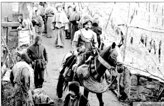
Кадр из фильма «Трудно быть богом»

Герман просил актёров ругаться матом. Чтобы лица были более осмысленными