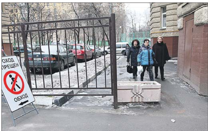
Справа от ворот оставлен проход для пешеходов

«Наш двор по адресу: просп. Мира, 118 и 118а, перекрыли воротами с дистанционным управлением. Для пешеходов оставили узенькие проходы прямо вплотную к стенам домов, теперь с детскими колясками трудно пройти». Такое письмо пришло в редакцию «ЗБ». Наш корреспондент отправился проверить, что за ворота и на каком основании появились во дворе.