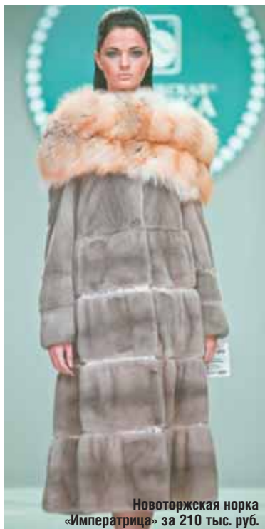
Новоторжская норка «Императрица» за 210 тыс. руб.

Мутон — популярный мех для носки долгой русской зимой. Мутон — очень практичный, тёплый и красивый мех. При правильной эксплуатации и уходе муто-