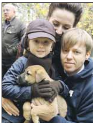
У метиса Кузи теперь есть своя семья

На 1-й Останкинской волонтеры приюта «Дубовая Роща» провели акцию по раздаче животных. В этот раз москвичи взяли из приюта 13 бездомных собак.