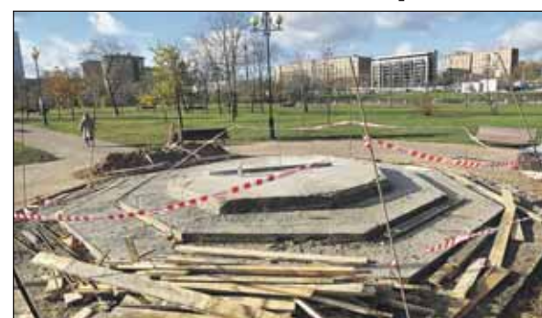
Постамент для памятника уже сделан