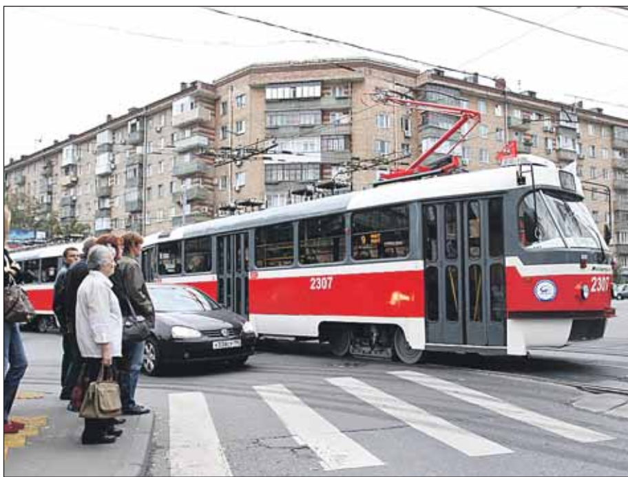
9-й маршрут связывал СВАО с центром города

Недавно в городе появился трамвайный маршрут №9, связавший Марьино рощу со станцией метро «Белорусская». От «Белорусской» трамвай идёт по Лесной улице и улице Палихе, после чего делает круг: Перуновский переулок, улица