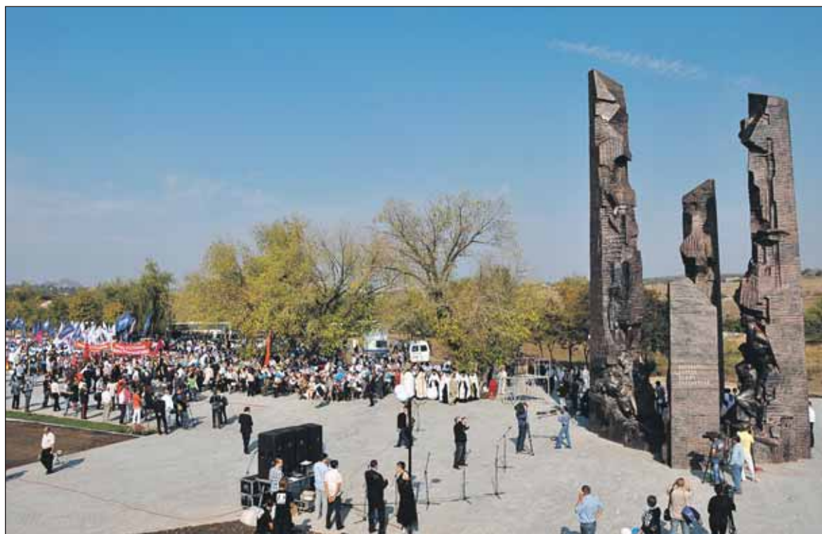
Краснодон. Памятник погибшим героям