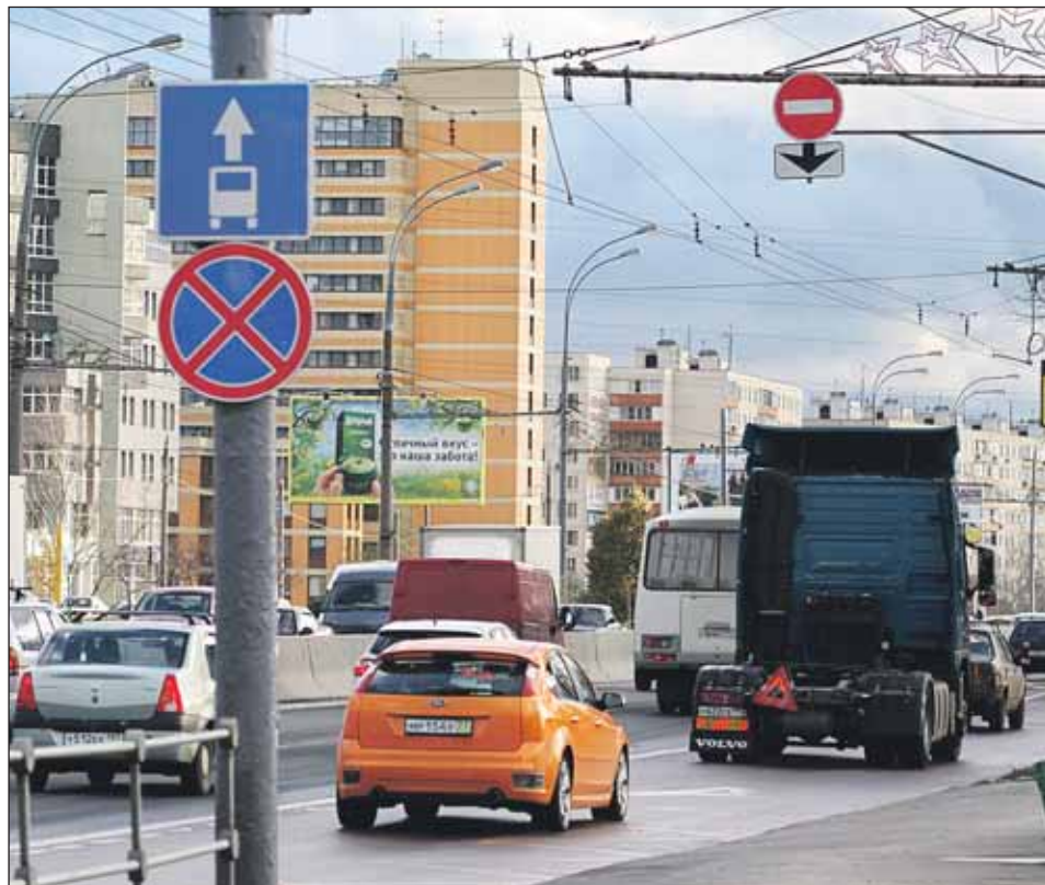
Пока за выезд под «кирпич» полиция не штрафует

Но с другой стороны, на разных уровнях не раз говорилось о том, что ввод выделенных полос на Алтуфьевке вообще будет отложен до её реконструкции. И это логично. Правые полосы на Алтуфьевском шоссе очень широкие (хотя, чтобы по нормам сделать из одной полосы две, они недостаточно широкие), но, если сейчас отдать их автобусам, пропускная способность трассы упадёт чуть ли не вдвое.