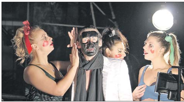
Сцена из спектакля «Отелло»

— Название «Райкин Плаза» никого не должно шокировать. Мне уже пришлось слышать, что мы, дескать, торгуем этим именем. Ничего подобного. Что такое «Райкин Плаза»? Это место, освещённое именем Аркадия Райкина. Мне кажется, это правильно. Сюда входят очень важные куль-