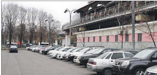
Что за машины здесь паркуются — неизвестно

А ведь ещё не так давно жители обратились на сайт префектуры с предложением организовать на огороженной площадке перехватывающую парковку. Желающих оставить здесь своё авто немало. 16 октября на сайте префектуры появился и ответ гла-