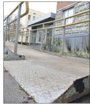
В управляющей компании мелкие недочёты обещают устранить