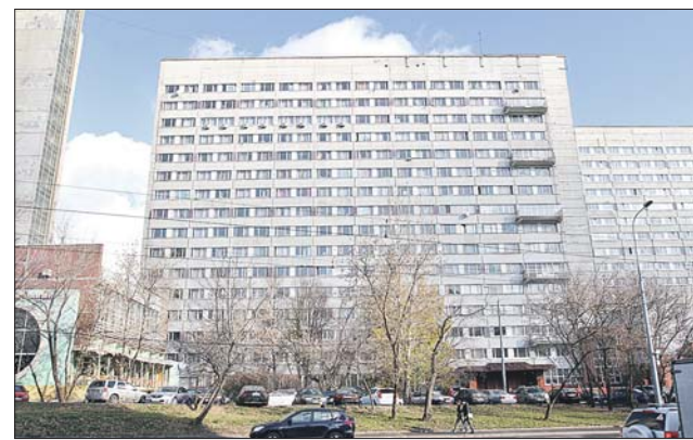
Трагедия произошла здесь

Охранники общежития ВГИКа на улице Бориса Галущина увидели тело молодого парня, свесившегося с козырька подъезда. Приехавшая скорая констатировала смерть. Погибший — 24-летний студент 3-го курса сценарно-кинематографического факультета. Он приехал в Москву из Якутии.