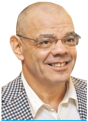
«Сатирикон» ждёт реконструкция

— Будет ли реконструировано здание «Сатирикона»?