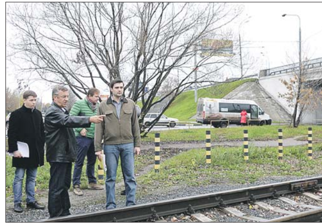
Префект изучил проблему на месте

Эту тему префект затронул во время недавнего объезда округа, когда вместе с представителями экспертного центра Probok.net побывал на стыке районов Отрадное и Алтуфьевский и убедился, что переход через железнодорожный путь в этом месте находится в запущенном состоянии. При этом местные жители пользуются им очень активно. Ветка принадлежит МГОО «Промжелдортранс», и