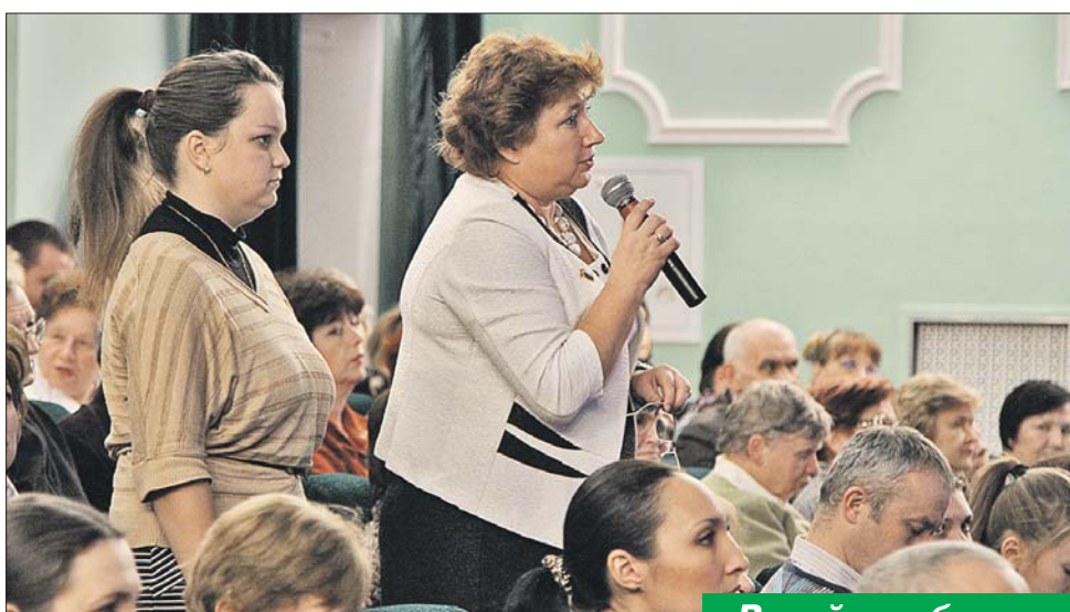
Зал театра В.Спесивцева был полон

— Сегодня происходит возрождение системы, когда за