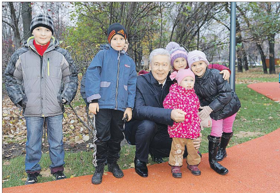
Сергей Собянин был удовлетворён благоустройством парка

Мэр Москвы Сергей Собянин на минувшей неделе посетил филиал Лианозовского парка на улице Гончарова. Нынешним летом парк комплексно благоустроили. Были восстановлены газоны, обустроены детские площадки, проложена велодорожка, появились шахматный павильон, танцевальная площадка, открытая сцена, бельчатник, летнее кафе и фонтан.