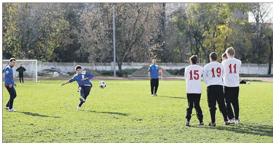
Здесь в 2018 году будут тренироваться звезды мирового футбола