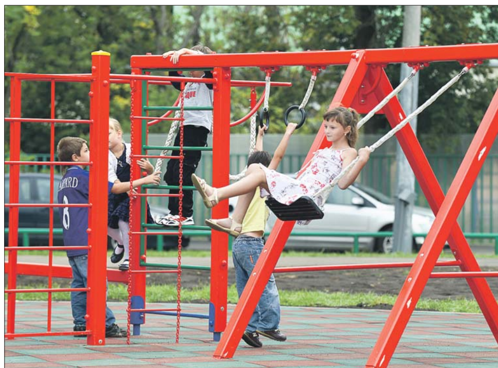
Народный парк на Церковной горке благоустроили в этом году

Тот же набор в Бибиреве — пешеходная зона протянется от ул. Корнейчука, 16, до Белозерской, 1а-3б.