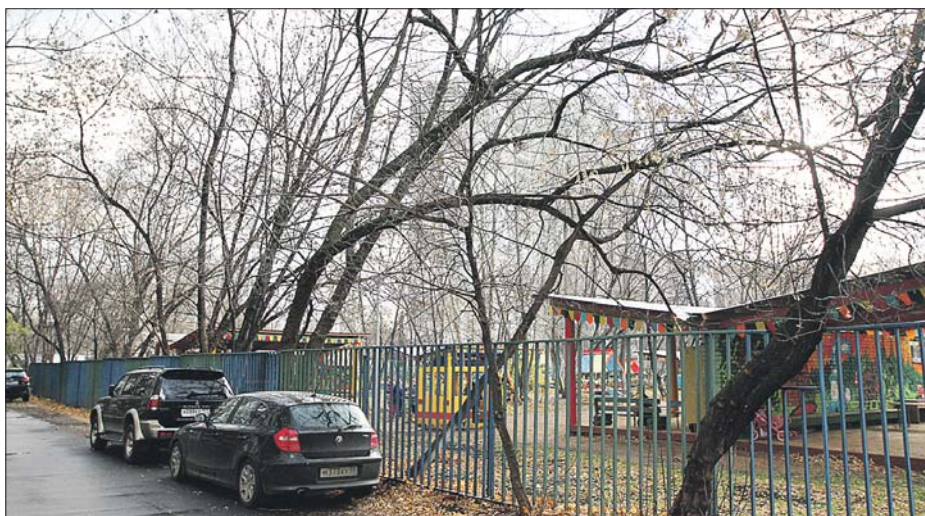
Наклонившиеся деревья представляют опасность для детей

Секрет прост. Раньше в городе действовало положение, которое обязывало организации содержать 5-метровую зону за своей территорией. Но года три