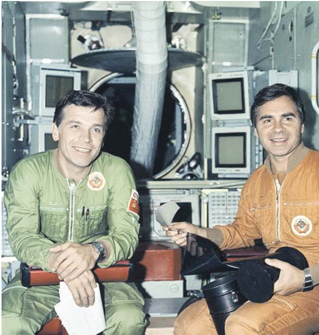
Александр Серебров (слева) полетел в космос поздно — лишь в 38 лет. Но успел увидеть больше многих космонавтов

Я решил стать космонавтом ещё до полёта Гагарина, когда увидел первый спутник. И когда услышал, что у МФТИ есть аэродром, решил, что это поможет мне