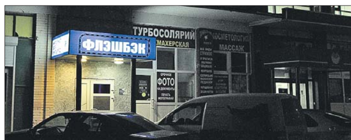
Реклама интернет-клуба на Ясном проезде навязчиво мигает по ночам

Захожу в клуб часов в восемь вечера. Внутри традиционный