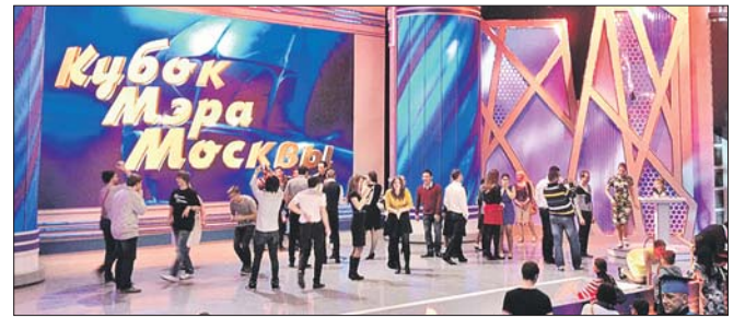
Бывший кинотеатр «Гавана» преобразился