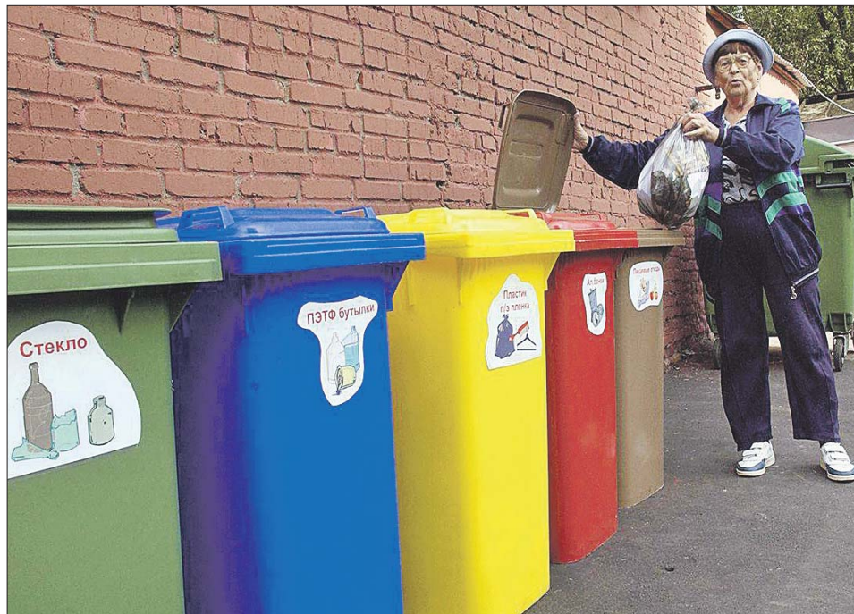
В СВАО эксперимент по раздельному сбору мусора начнётся с 1 января следующего года

Москва уже не раз замахивалась на то, чтобы наладить