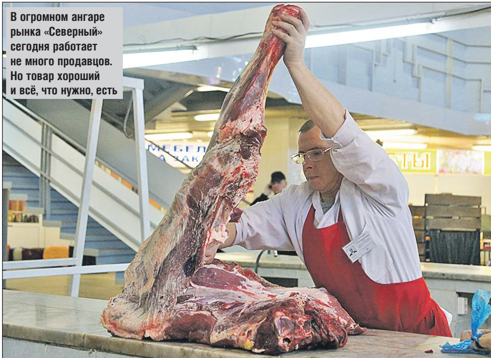
В огромном ангаре рынка «Северный» сегодня работает не много продавцов. Но товар хороший и всё, что нужно, есть