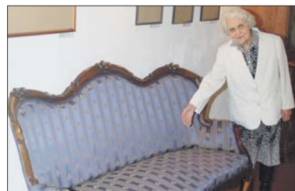
На этом диване Достоевский писал «Преступление и наказание»