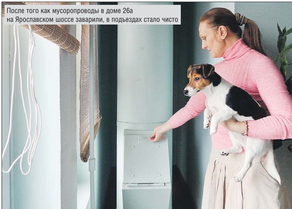
После того как мусоропроводы в доме 26а на Ярославском шоссе заварили, в подъездах стало чисто

А в новостройке на Высоковольном пр., 1, корп. 6, та-