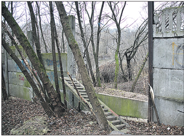
Пока у Яузы встречаются и такие места. Все они будут облагорожены