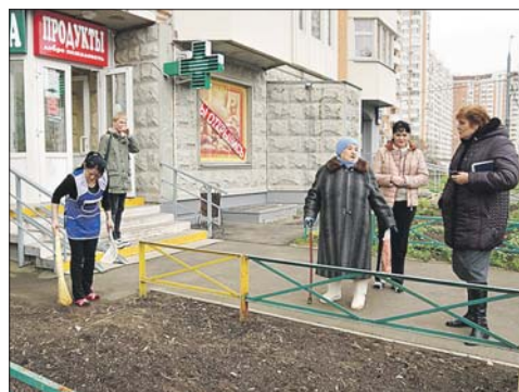
Весной на этом газоне разобьют клумбу