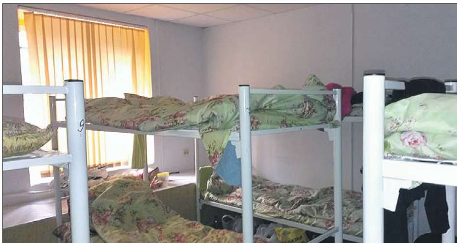
Такие двухъярусные кровати корреспондент «ЗБ» обнаружил в «апартаментах»

— У нас четыре комнаты, плата посуточная: за