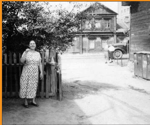
На заднем плане — старинный купеческий особняк с мезонином и нарядными наличниками

На фотографии 1950-х годов из семейного архива Натальи Карасёвой запечатлён один из уголков уходящей Марьиной рощи. Это двор невдалеке от перекрёстка Старомарьинского шоссе и 13-го проезда Марьиной Рощи, где-то в районе нынешнего дома 15 по Старомарьинскому шоссе (снимали от дома 16, направление съёмки — запад).