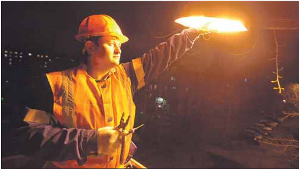
Замена лампы фонаря на Радужной

5 вопросов про освещение в домах и на улице