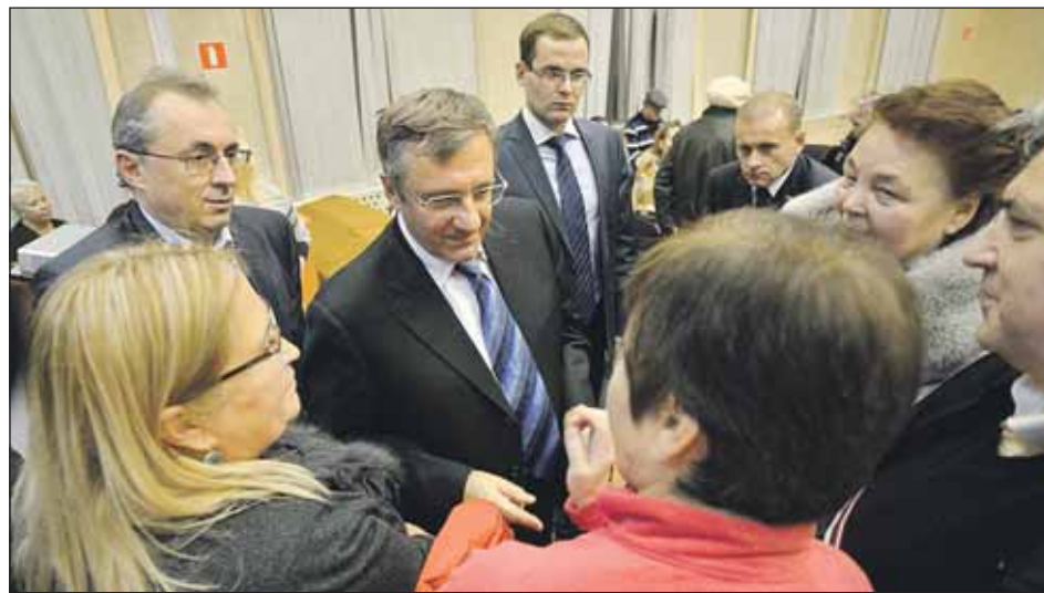
На встрече с алтуфьевцами префекту задали много вопросов

Руководителя округа спросили, когда начнётся реконструкция Алтуфьевского шоссе. Он сообщил, что работы по проектированию находятся в завершающей стадии.