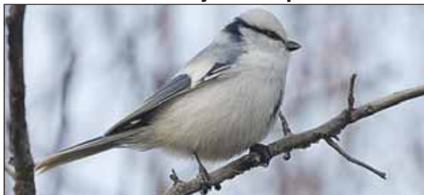
Князёк занесён в Красную книгу нескольких стран

Очень красивая бело-голубая птичка появилась в фаунистическом заказнике «Долгие пруды». Это белая лазоревка, или князёк. Она прилетела сюда из северных краёв зимовать. — Князёк — птица для Москвы и Подмоскovie не просто редкая, а редчайшая,