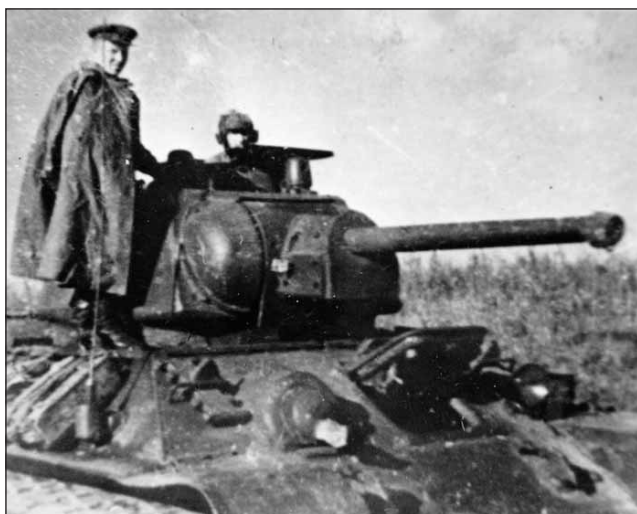
Первый гвардейский корпус на марше