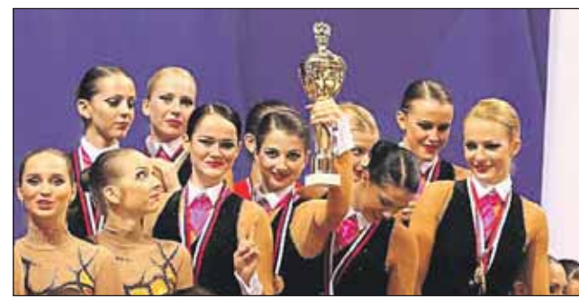
Наша команда здорово выступила в Италии