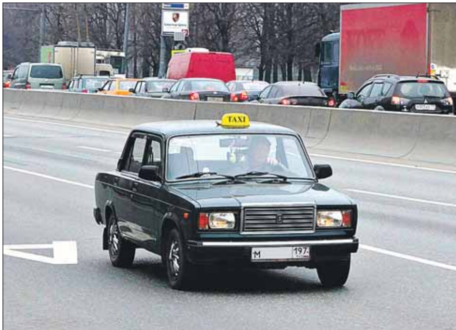
Таксисты на выделенках в Москве оказались вне закона из-за повешенных «кирпичей»

По сути, «кирпичи» над выделенками служат именно этой цели — не пускать на полосу такси. Ведь, согласно ПДД, действие знака 3.1 не распространяется на маршрутные транспортные