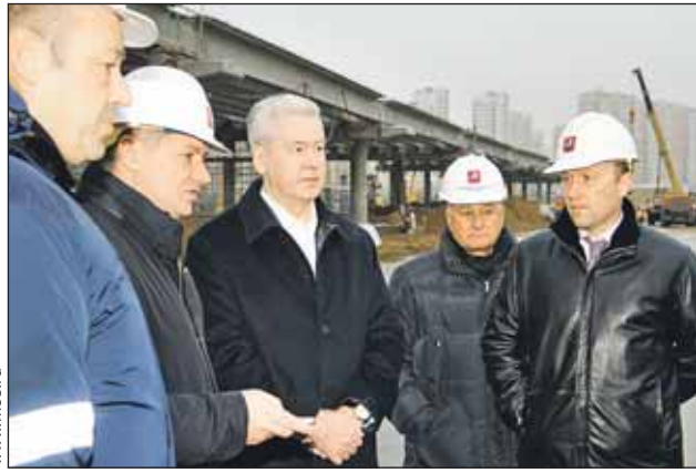
Сергей Собянин проверил, как идут работы

Сергей Собянин посетил реконструируемый участок Дмитровского шоссе на пересечении с МКАД. Как сообщил зам. мэра Москвы по вопросам градостроительной политики и строительства Марат Хуснуллин , сейчас здесь ведётся строительство транзитной шестиполосной эстакады и реконструкция развязки с Кольцевой автодорогой. По словам зам. мэра, все работы планируется завершить к концу 2013 года.