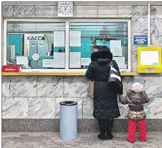
Видов билетов станет больше