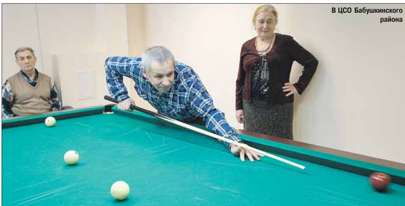
В ЦСО Бабушкинского района