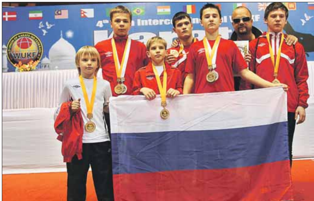
Завоевано 6 золотых и 2 серебряных медали