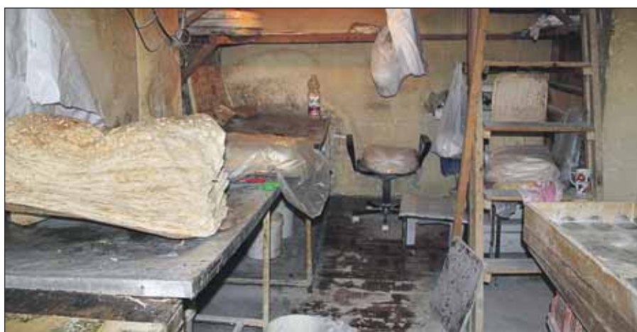
Хлебушек пекли здесь

У директора фирмы сразу изъяли документы. Ока-