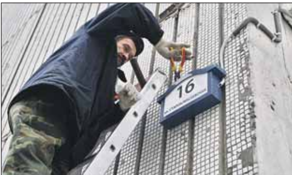
Указатели развешивают в квартале между Новоалексеевской, Староалексеевской улицами и проспектом Мира

Москомархитектура разработала единую для всей Москвы концепцию размещения и дизайна указателей улиц и номеров домов. На пешеходных улицах в центре города предлагается развешивать коричневые указатели. Есть фигурные таблички для центральных (к которым отнесли и Алексеевский район) и периферийных районов,