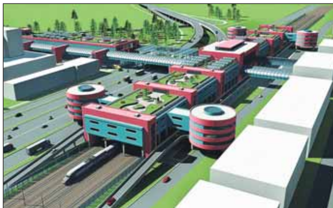
Проект Лианозовского ТПУ

На совещании шла речь о составляющих ТПУ: транспортной (здесь «сойдутся» метро, наземный транспорт, железная дорога), торгово-коммерческой (в точках пересечения пассажиропотоков размещаются торговые комплексы), а также о том, что связано с безопасностью и обеспечением правопорядка (во всех ТПУ предусмотрена система видеонаблюдения, будут созданы посты ОМВД). Об этом рассказали представители городского Департамента потребительского рынка и услуг и ОАО «РВ-метро» —