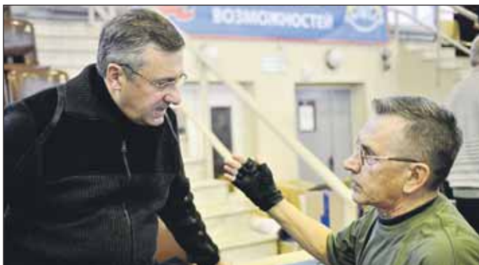
Префект пообещал последовательно решать в округе проблемы людей с ограниченными возможностями

В Спортивном центре им. братьев Знаменских состоялось открытие 15-й Окружной спартакиады среди инвалидов СВАО. Они состязаются в 8 видах спорта: бег на 60 метров, поднятие гири, мини-гольф, жим штанги лёжа, дартс, толкание ядра, интерактивная стрельба и шашки.