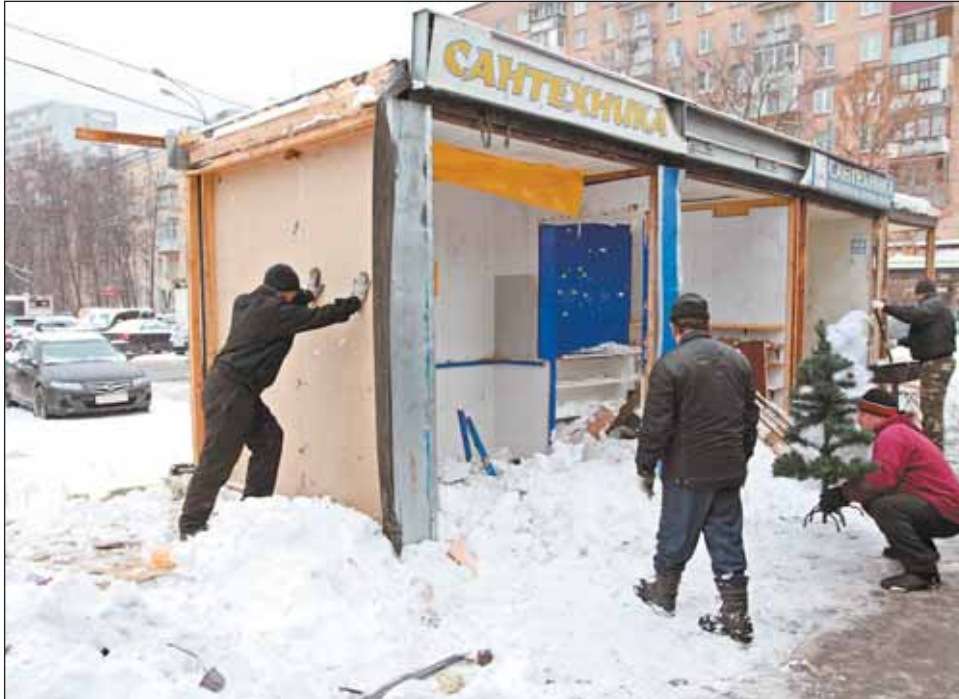
Снос павильона на станции Лосиноостровская

— Ещё в прошлом году на уровне города была утверждена постоянная схема размещения нестационарных торговых объектов, — говорит зам. начальника управления потребительского