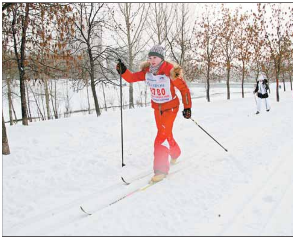
Большинство трасс в округе — прогулочные. Они доступны и мастерам, и начинающим

Самые большие лыжни проложены в сквере у метро «Ботанический сад» и в сквере на Певчевском поле — их протяжённость 7 км. А вот на территории филиала Лианозовского парка (ул. Руставели, вл. 7)