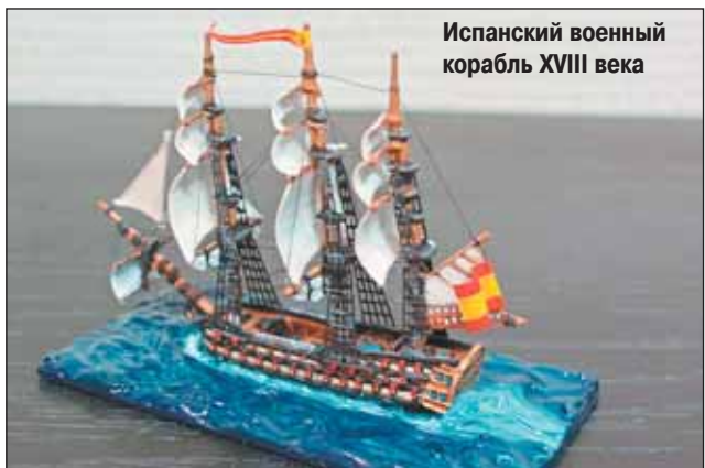
Испанский военный корабль XVIII века

Клуб исторической миниатюры «Оловянный марш» открывает новое направление — военно-морское. Скоро все, кому интересна история морских баталий, смогут принять участие в играх-сражениях.