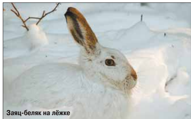
Заяц-беляк на лёжке