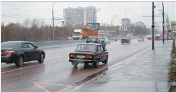
К середине ноября проехать по Алтуфьевке стало легче, но всё испортила погода