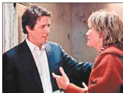
Кадр из фильма «Реальная любовь»

▶ «Экспериментаниум»: ул. Бутырская, 46/2