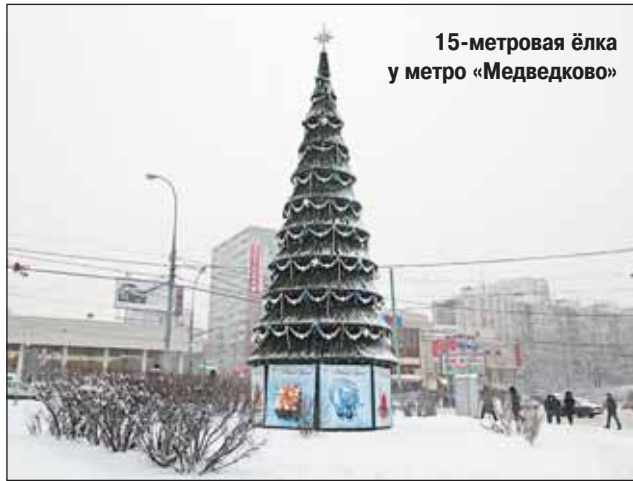
15-метровая ёлка у метро «Медведково»

Также 20 декабря в округе начнут работать ёлочные базары — вплоть до 31 декабря. Как сообщили в управлении потребительского рынка и услуг префектуры, в этом году в СВАО откроются 30 ёлочных базаров