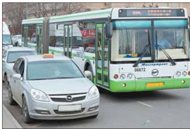
В России такси не считается общественным транспортом

выглядел пустым! Говорят, зачастую это проходит. А пассажиры автобусов справедливо негодуют.