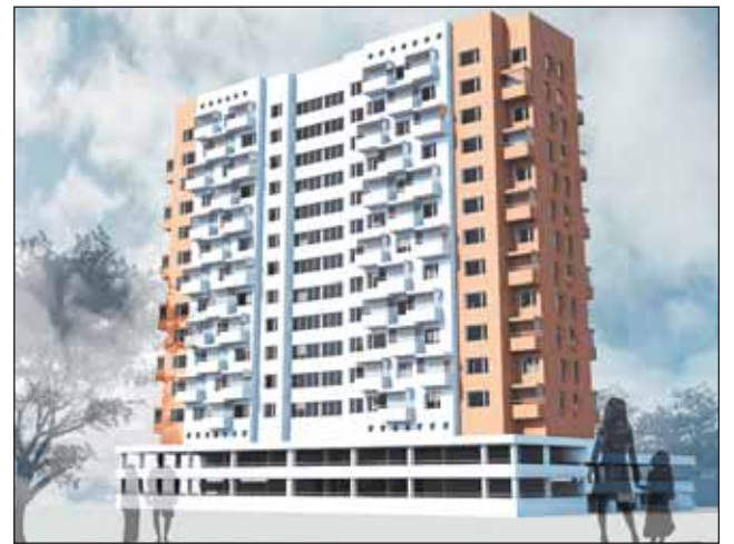
Так будет выглядеть дом на Ясном проезде. На первых двух этажах разместится автостоянка