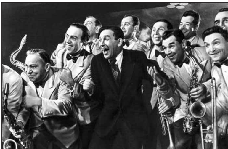
Леонид Утёсов на пике славы со своим оркестром

— В то время отдельных гримёрок ни у кого не было, и Леонид Осипович Утёсов перед концертом передевался вместе со всеми, — вспоминает он. — Так получилось, что я положил свой пиджак на концертный галстук Утёсова. Вышли мы на сцену, играем увертюру, после которой должен появиться Утёсов, и вдруг из-за кулис громкий шёпот Леонида Осиповича: «Где мой галстук?!» После выступления пошёл извиняться. А Утёсов отвёл