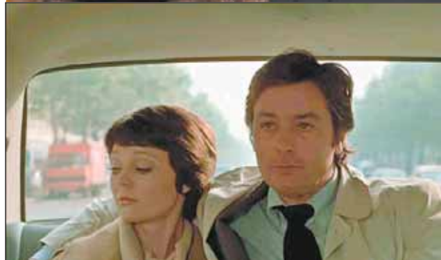
Наталия Белохвостикова и Ален Делон в фильме «Тегеран-43»

— Не страшно было вот так ехать во ВГИК?