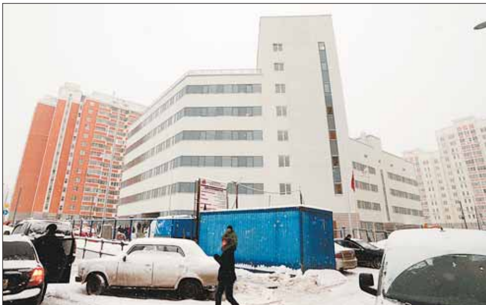
Новая поликлиника будет обслуживать и детей и взрослых всего района

Префект осмотрел кабинеты врачей и процедурные, зал лечебной физкультуры, другие помещения. Сегодня строительные работы пол-