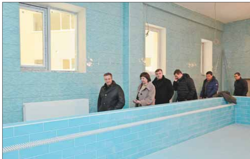
Префект осмотрел бассейн для детей в цокольном этаже поликлиники

ностью завершены, идёт отделка и подготовка к установке оборудования. В середине декабря здание будет переведено на постоянную схему электроснабжения, составлен посуточный и покabinetный графики поставки аппаратуры.