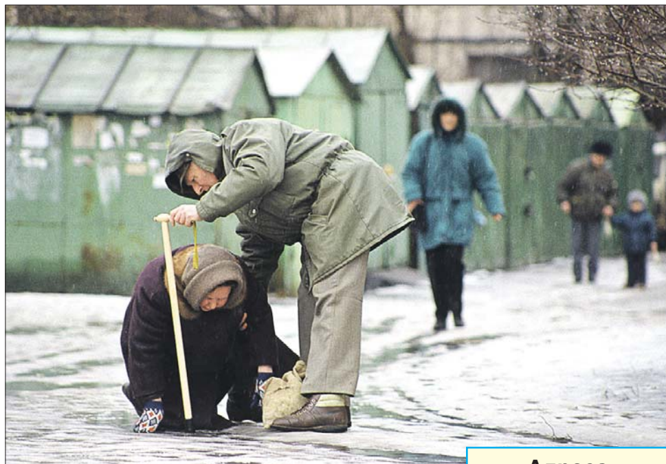
Наплыв пострадавших, по словам травматологов, ещё впереди

— Но основной поток пострадавших идёт не в первые дни гололёда, а через пару недель, когда люди уже расла-