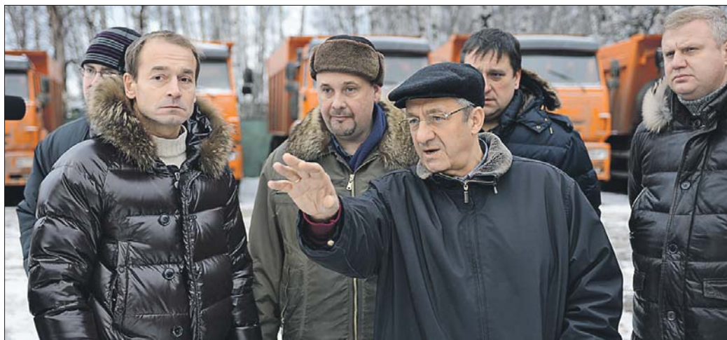
В Северном Медведкове префект осмотрел базу недавно созданного ГБУ «Жилищник» и высказал ряд замечаний