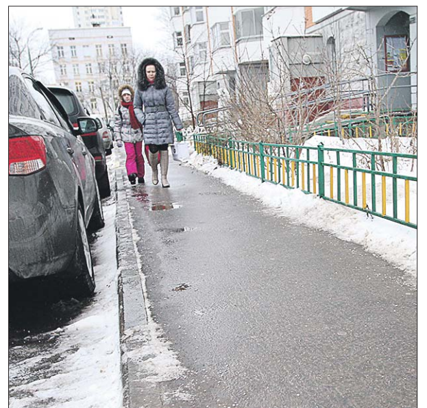
Уже к 9 утра все подходы к подъездам должны быть расчищены