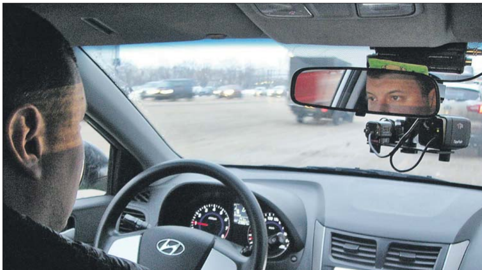
В машине работают две камеры — обзорная и распознающая

Уже по 10 маршрутам СВАО курсируют автомобили, оборудованные мобильными комплексами фотовидеофиксации нарушений ПДД. А в январе их может стать больше — ведь число «Паркрайтов» в столице возрастёт почти на треть! Корреспондент «ЗБ» вместе с сотрудниками Центра организации дорожного движения проехал по одному из маршрутов, что проходит по Сущёвке от метро «Марьино Роцца» до развязки у Савёловского вокзала.