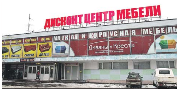
Тот самый магазин на Полярной