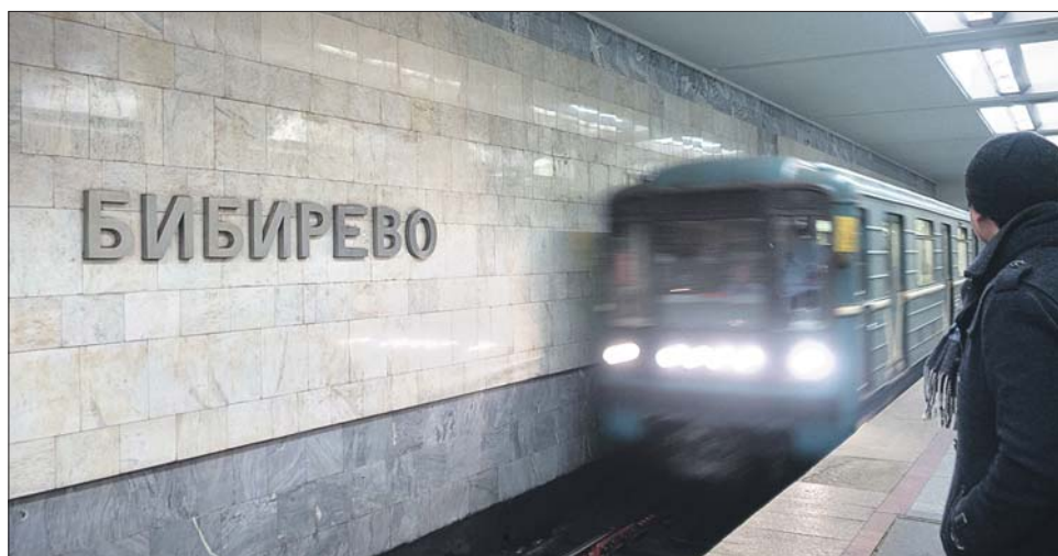
Инцидент произошел в час пик, когда на платформе было много народа

количество людей: час пик. Неожиданно женщина, стоящая у края платформы, рхнула вниз. — В этот момент из тун-