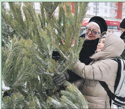
Купить елку на базаре можно будет вплоть до 31 декабря

Адреса ёлочных базаров: просп. Мира, 122, стр. 1; ул. Плещеева, 4, корп. 1; ул. Лескова, 19а; ул. Пришвина, вл. 32; Абрамцевская ул., 24; Дмитровское ш., 116д; Анадырский пр., 8; ул. Шереметьевская, 13, корп. 1; 1-я Останкинская ул., 53-55; ул. Хачатуряна, 17г; ул. Амундсена, 14; 9-я Северная линия, 19; пр. Дежнёва, 17; ул. Малахитовая, 14, стр. 1; Ярославское ш., 54