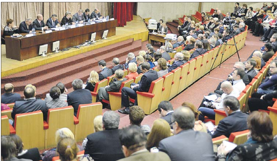
На традиционной ежегодной встрече с депутатами шёл разговор о самых важных проблемах округа

По словам префекта, с января будущего года в округе появится ещё четыре бюджетных учреждения в сфере ЖКХ. ГБУ «Жилищник» заработают в Свиблове, Ростокине, Останкине и Марьиной роще. Ещё