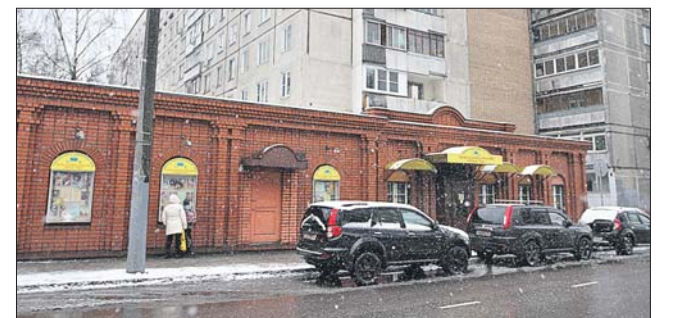
Жилец второго этажа на Октябрьской, 91, корпус 1, всюду пользуется крышей пристройки