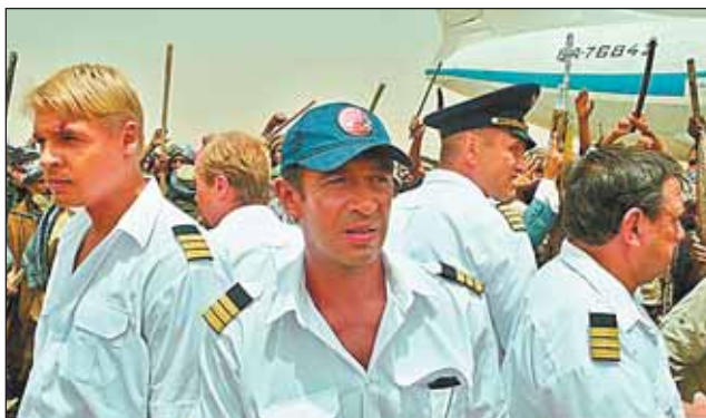
Вот так они выглядят в фильме «Кандагар»