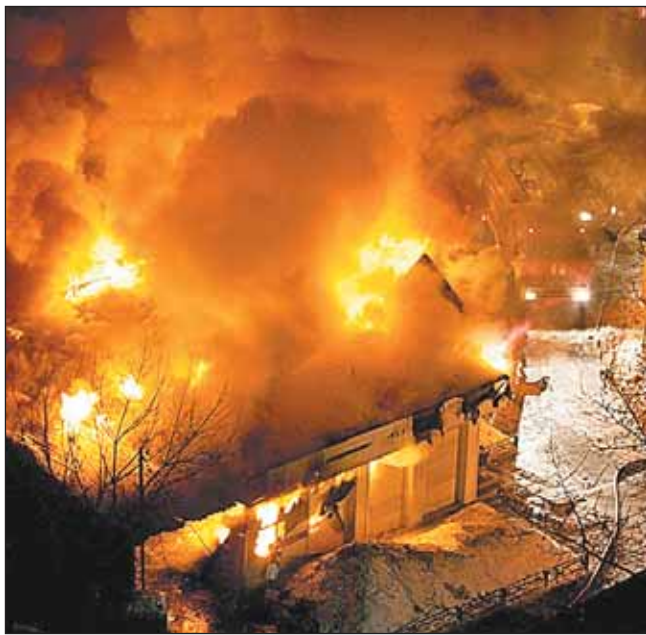
Магазин на Каргопольской выгорел до основания