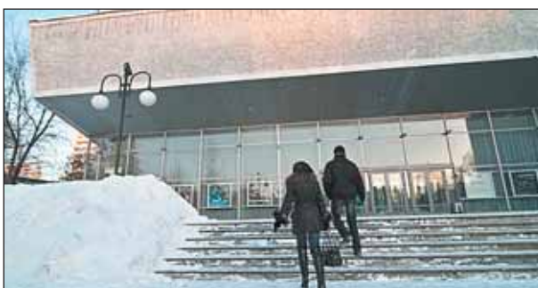
У этого крыльца и произошла потасовка