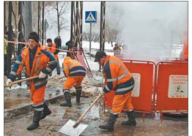
Через два часа после случившегося