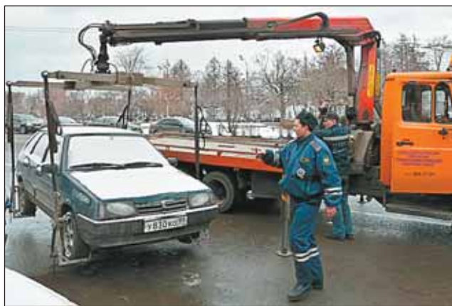
Такие сцены нередки у Театра Российской Армии

В ГУ ЗВБ считают, что имеющегося количества снегоуборочной техники вполне достаточно. Единственное, чего не хватает, — содействия автовладельцев. Перед тем как при-