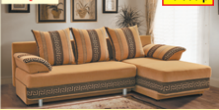
«Олимп-3», угловой диван-кровать с механизмом «еврокнижка», два ящика для белья, разм. 2190*790/930*1360, с/м 2190*1320