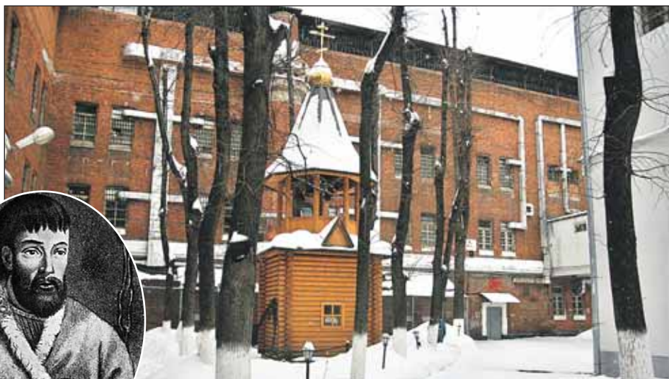
Емельян Пугачев — один из знаменитых сидельцев Бутырки, которой без малого 240 лет

Просторные и светлые коридоры продолжают. В них тянутся ровные ряды камер. А это что такое? Между камерами к стенам прилегают и упираются в пол непо-