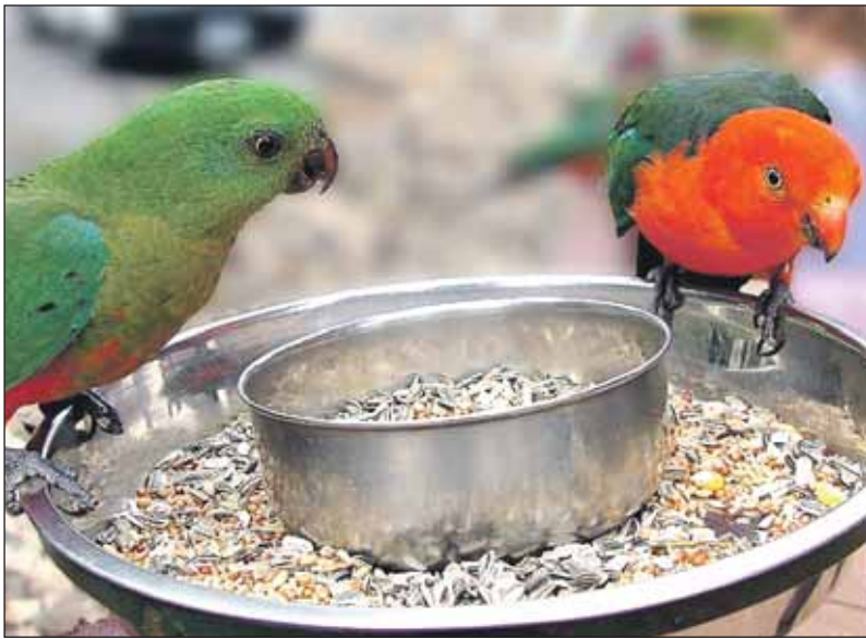
«Слушай, ты у нас случайно не заболел?»

Несколько случаев орнитоза у человека уже были зафиксированы в Москве в конце декабря — начале января. Поэтому ветеринарные врачи