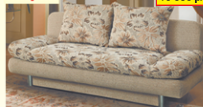
«Фантазия», тахта с механизмом «еврокнижка», ящик для белья, разм. 1920*870*900, с/м 1900*1350