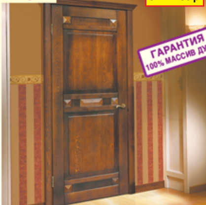
«Фараон-2», дуб античный