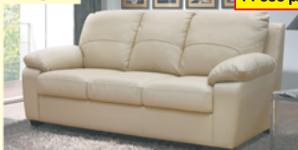
«Питсбург», трехместный диван, иск. кожа, разм. 1980*900*920