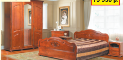
«Ромашка», набор для спальни из массива ольхи