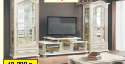
«Давиль», гостиная, массив дуба