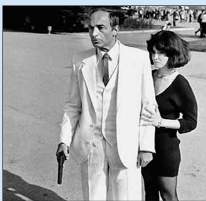
Кадр из ленты «Воры в законе»