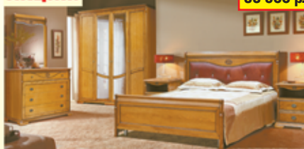
«Лица», набор для спальни из массива дуба, крашение давил