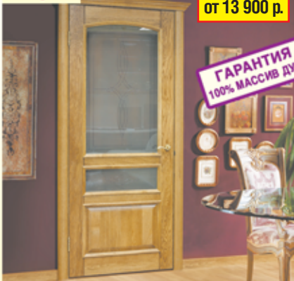
«Цезарь», дуб натуральный