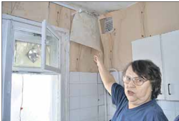
На обоях — темные разводы

Заходим в квартиру этажем ниже. Молодой человек демонстрирует лампу, в которой скопилось вода, капающая с потолка, и уже при-