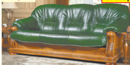
«Милан», трехместный диван-кровать, 100% кожа, каркас из дуба, разм. 2020*920*1000, с/м 1400*1860