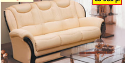
«Марсель», трехместный диван-кровать, 100% кожа, механизм трансформации «Спартак», разм. 1920*1070*1000, с/м 1350*1860