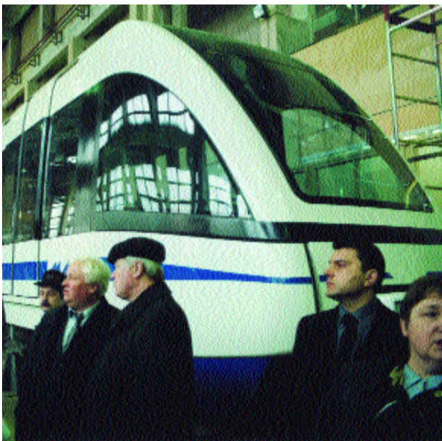
Так выглядит вагон монорельса

главное — он не мешает наземному движению в городе. Мэр Москвы подтвердил, что планы пустить «первую веточку» в этом году пока не меняются. А дальше будут Внуково и Новопеределкино.