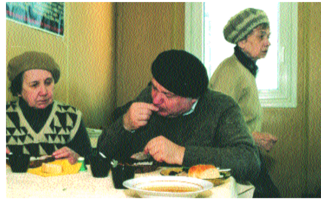
200 человек обедают здесь ежедневно

Бесплатную столовую на улице Образцова содержит еврейский благотворительный фонд «Эзра». Сейчас в новом здании ведутся отделочные работы. Отстроенная столовая сможет принимать более 500 человек в день.