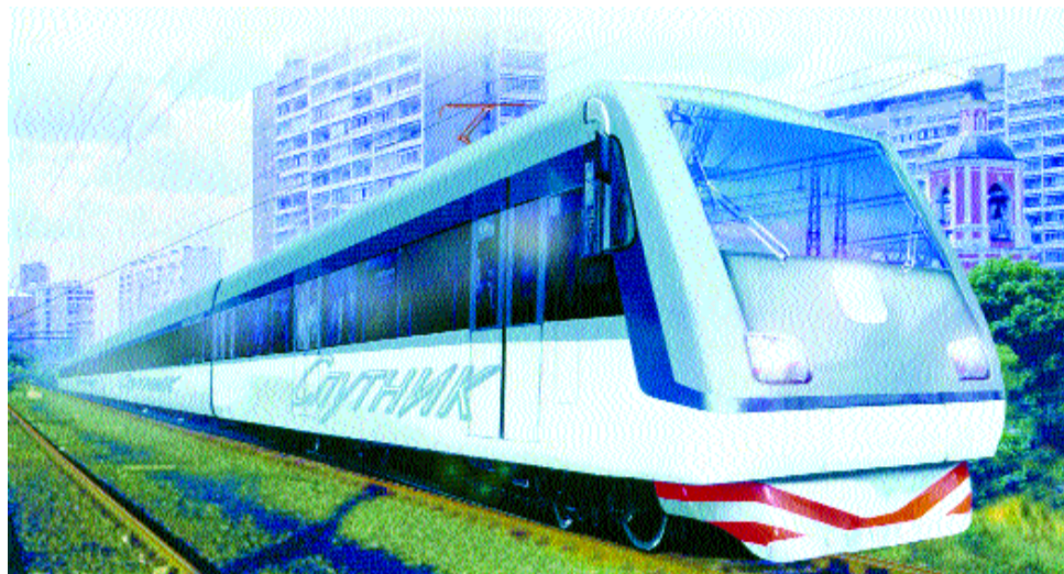
Скоростной поезд Москва—Мытищи

Новый поезд отличается от нынешней электрички, как BMW — от детской коляски. Извне — монолитная гладкая броня, вакуумные стеклопакеты заподлицо с обшивкой. По три двери с каждой стороны вагона. Из конструкции исключены тамбуры, их заменят биотуалеты. Переходные пло-