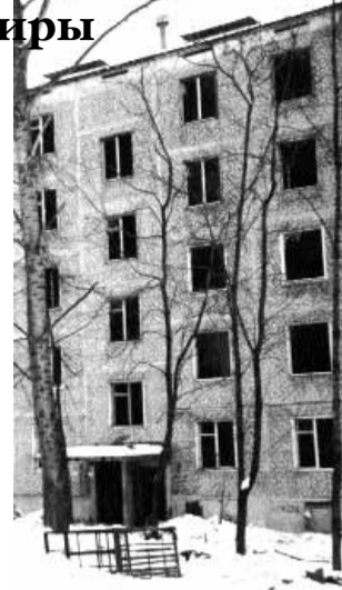
Дом — на снос

и по этой причине отказывается выезжать. Процесс почти мгновенного «деления» семей накануне переселения известен, и причина его понятна — люди хотят получить побольше бесплатных квартир от государства. Классический случай зафиксирован не так давно в Южном Медведково: там в 2-комнатной квартире были прописаны двое — внучка и дедушка. За полтора месяца перед переселением дедушка успел