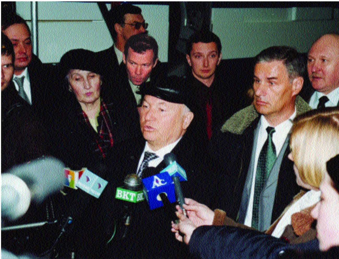
Мэр Москвы: «Наши планы пока не меняются».

Юрий Лужков внимательно осмотрел «внутренности» вагонов, место для машиниста, а после сообщил журналистам, что монорельсовая дорога — вид транспорта экологически безупречный, в смысле удобства это уже 21-й век, а