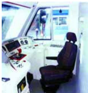
В кабине машиниста

щадки между вагонами выпрямлены. Вагон оснащен обогревателями и кондиционерами.