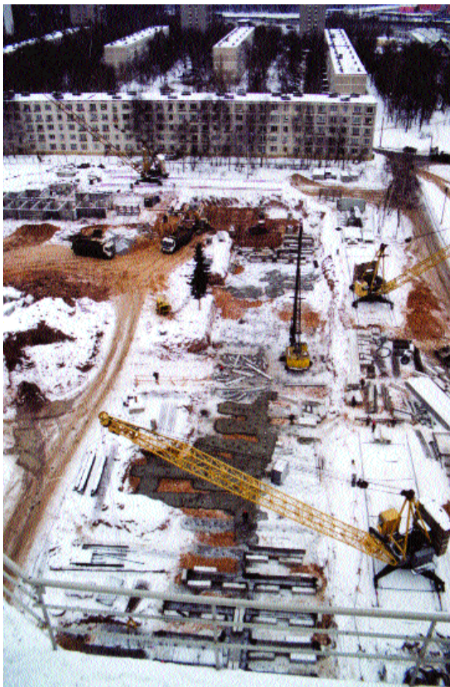
В этом году в округе снесут 31 пятиэтажку

Почему новоселы не торопятся в новые квартиры