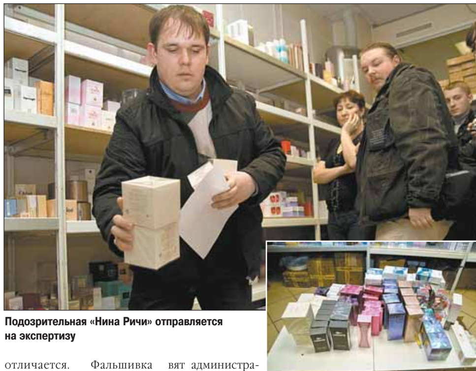
Подозрительная «Нина Ричи» отправляется на экспертизу