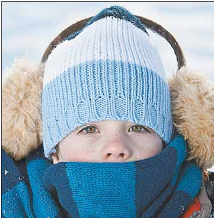
В жаркой раздевалке уже одетые дети ждут остальных, а потом выходят на мороз