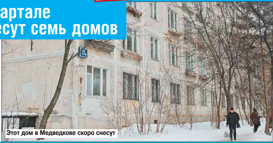
Этот дом в Медведкове скоро снесут