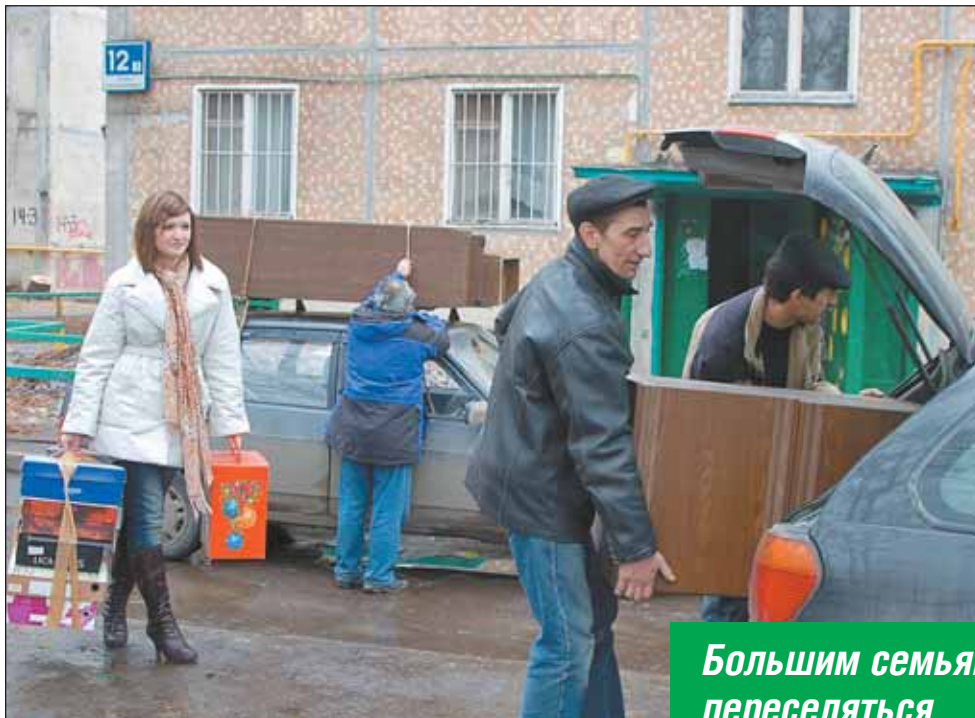
Переезд в Северном Медведкове с улицы Тихомирова на улицу Молодцова. 2009 год

Собственник (обладатель приватизированной квартиры) имеет в соответствии с законом «Об обеспечении жилищных прав граждан при переселении и освобождении жилых помещений (жилых домов) в г. Москве» право получить за свою хрущевку компенсацию в натуральном или денежном виде. Однако собственники почти всегда предпочитают брать свое «натурой». Кстати, в этом случае они выигрывают и в жилплощади. Потому что им в соответствии все с тем же законом обязаны предоставить жилье, равноценное по количеству комнат и не меньшее по площади, чем занимаемое. А поскольку в современных домах большие кухни, просторные холлы, да и комнат-клетушек, как в