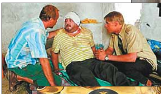
Кадры из фильма «Кандагар»

— Да я тебя умоляю... В воде теплее, чем на улице. Попробуй один раз, и тебе понравится. Я на Крещение стал купаться где-то, наверное, лет пять назад. Обрати внимание, что очередь, которая стоит перед окунанием, разительно отличается от очереди, которая стоит после окунания. Поначалу это,