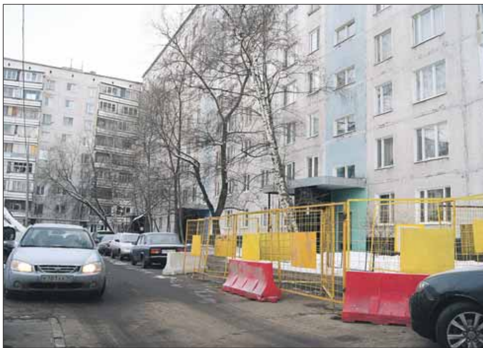
Двор дома 58 по улице Корнейчука вошёл в программу благоустройства 2012 года

В первые месяцы работы портала «Наш город» туда обратились два активных жителя, Вячеслав Писков и Валерий Васильевич с ул. Корнейчука, 58: «На данном сайте браво рапортуется, что работы успешно завершены 30.07.2011 г. Но что значит ремонт и содержание детских площадок? Это то, что металлические конструкции, поставленные ещё во времена СССР, ещё раз мазнули краской в июле? Что такое ремонт асфальтобетонного покрытия? Это те ямы, что нам делали в июне и которые мы должны обходить уже почти 4 полных месяца?» И это было только начало. В результате регулярных обращений на портал Вячеслава Пискова и Валерия Васильевича и ответных действий управы района Бибирево во дворе домов 58