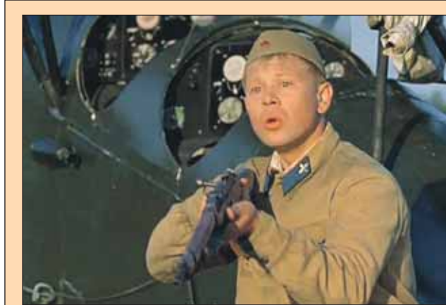
«Солдат Иван Чонкин»

— Мне всегда нравилось общаться с людьми, веселить их, и я считал, что актёр — самая главная профессия. Но в актёры я пошёл не сразу. Сначала окончил театраль-