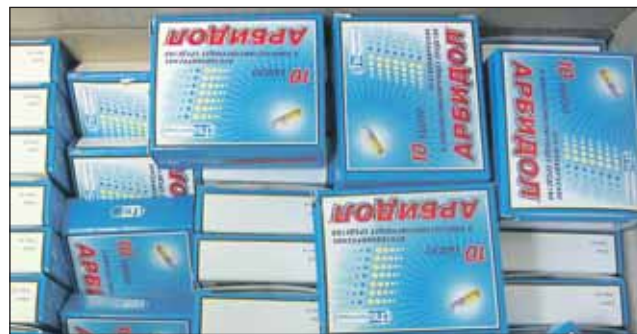
Было изъято 35 тысяч коробок поддельного лекарства

Последней точкой стала аптека на Таганской улице. Заве-