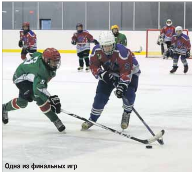
Одна из финальных игр

В соревнованиях приняли участие 35 команд в трёх возрастных категориях. Финальные игры прошли во дворце «Медведково» на Заповедной улице.