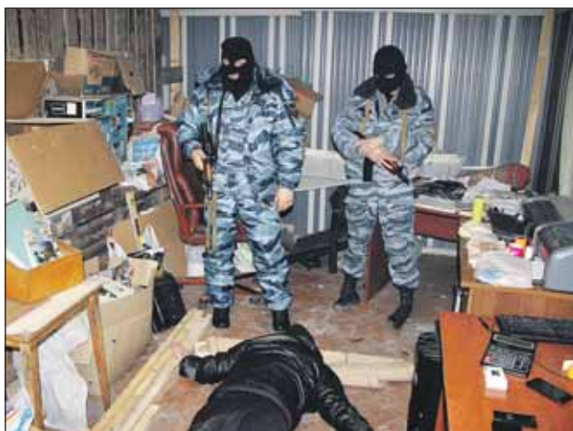
Во время задержания

В начале прошлого года в полицию поступил сигнал о странной инструкции, вложенной в популярное профилактическое лекарство от гриппа «Арбидол». В слове «регистрационный» была допущена опечатка — дополнительная буква «а». Казалось бы, мелочь. Но не в случае с лекарственным препаратом. Дело в том, что процесс производства инструкций и упаковок у любого крупного производителя лекарств — долгий, трудоёмкий и не допускающий ошибок. Как правило, сначала в типографии печатается пробный образец, который корректируется и утверждается специальным отделом. И лишь после этого инструкция запускается в производство. Именно это и навело