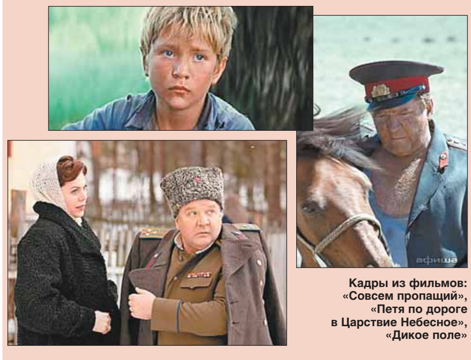
Кадры из фильмов: «Совсем пропащий», «Петя по дороге в Царстве Небесное», «Дикое поле»