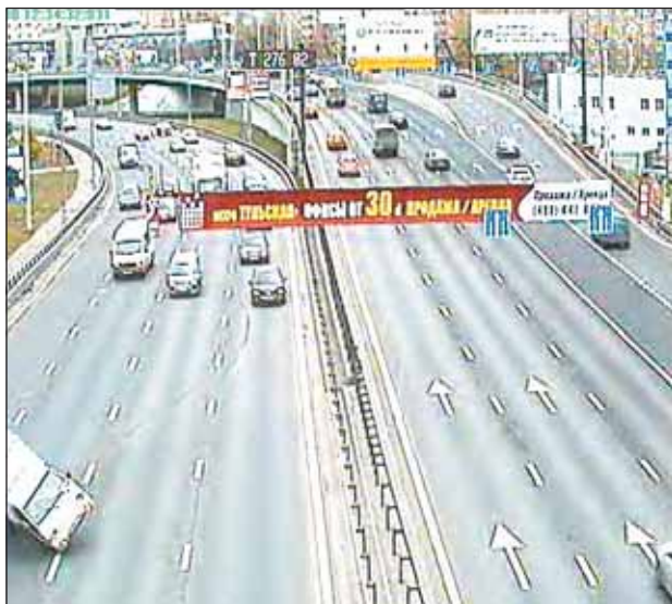
На видео хорошо заметно, кто виноват

тоциклист догнал его и врезался сбоку. Проблема была в том, что, перед тем как остановиться, «Форд» успел закончить маневр и ехал ровно по полосе, поэтому по расположению машины и мотоцикла после аварии нельзя было сказать, прав ли водитель «Форда».