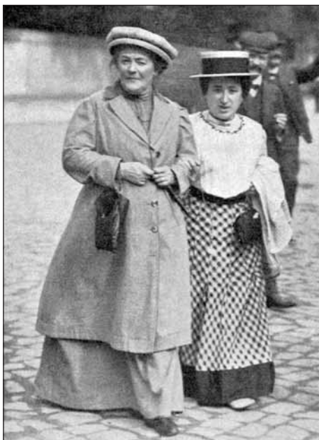
Клара Цеткин (слева) стояла у истоков эмансипации. В итоге сегодня дамы играют в хоккей

100 лет назад возник праздник 8 Марта. Что дарили женщинам в прежние времена, вспоминают бабушки из СВАО