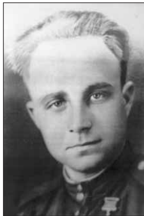
В годы войны