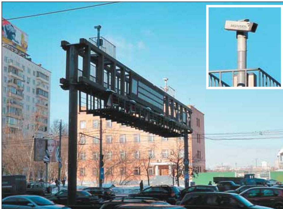
Сущевский Вал полностью просматривается

В прошлом году на Сущевке водитель «Форда», перестраиваясь в соседний ряд, не заметил ехавшего по нему мотоциклиста на «Ямахе» — случай, увы, типичный. Мотоциклист и его пассажир получили при столкновении серьезные травмы. Водитель «Форда» объявил приехавшим инспекторам, что он ехал прямо, не маневрировал, а мо-