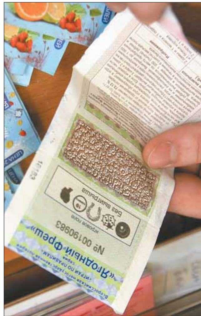
Те самые лотерейные билеты

тах определение «игра» на «лотерея», «выигрыш» на «приз». Соответственно меняется прошивка на автомате — с игровой на лотерейную.