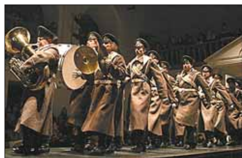
Сцены из спектакля