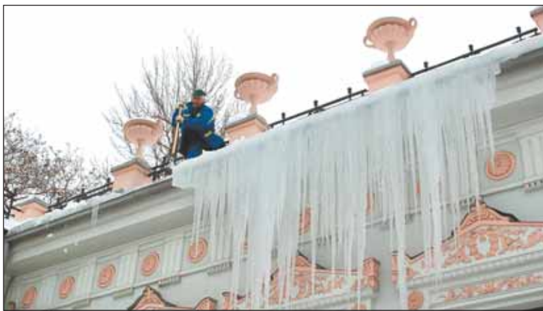
Рабочие сбивают сосульки на проспекте Мира

— С начала февраля в медицинской учреждения обратились 5 жителей округа с жалобами, что они пострадали от упавших на них сосулек, — рассказал начальник окружной жилищной инспекции Игорь Орлов. — По каждому случаю было проведено тщательное расследование. Ни один случай не подтвердился! Оказалось, что люди получили травмы по другим причинам. Почему они сочинили такие легенды, непонятно.