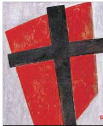
Казимир Малевич. Супрематизм

Выставка «Русские утопии» — первая в «Гараже», полностью посвященная современному российскому художнику. На ней можно будет увидеть занимательные инсталляции таких известных представителей современного искусства, как Олег Кулик, Вячеслав Ахунов и Александр Бродский. Не обойдется и без популяр-