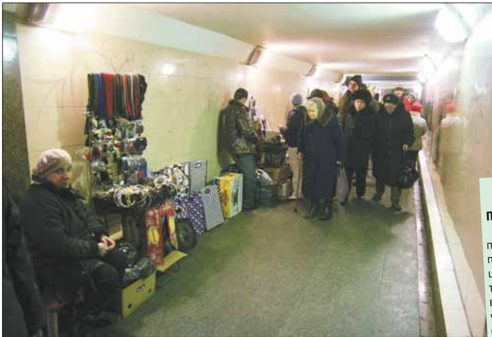
Переход на «Тимирязевской» давно стал местом злочной торговли

— большинство продавцов-нелегалов — наемные поденщики, приехавшие в Москву на заработки;