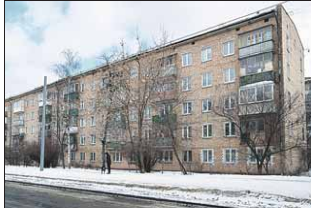
...она и сейчас стоит. Адрес: 1-й Сельскохозяйственный проезд, 5 (через дорогу от трамвайного депо)

— Трамвай там выглядит обшарпанным, грязным. А между тем даже в самые трудные военные годы их всегда чистили и подкрашивали. Помните изречение