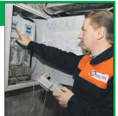
Так выглядит общедомовой теплосчетчик