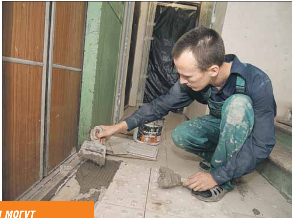
Если жителям не нравится, как идет текущий ремонт, подрядчиков могут поменять

Отчитаться, как израсходованы средства по каждой квартире, УК не сможет. А вот данные о расходах на весь дом представляются по первому требованию — это оговорено в постанов-