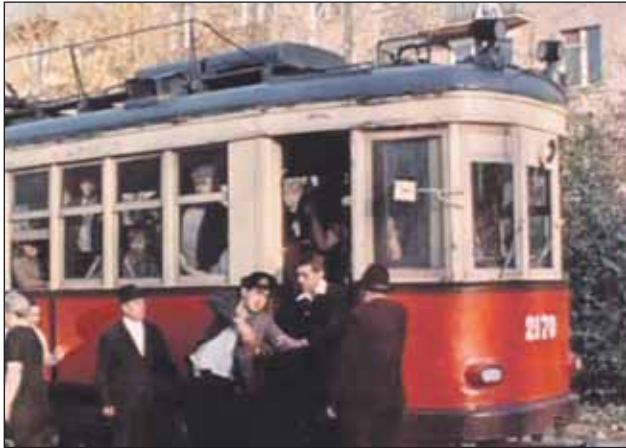
На заднем плане видна хрущевка...