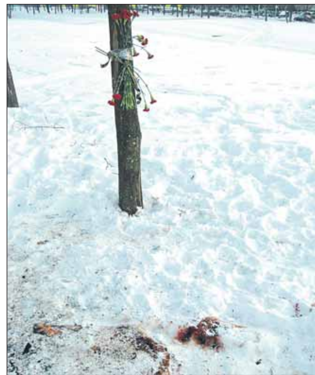
Здесь произошла трагедия

Единственный кризисный центр, где помогают несостоявшимся самоубийцам, находится в нашем округе на базе больницы №20. В нем 60 мест, и он всегда заполнен пациентами. Как правило,