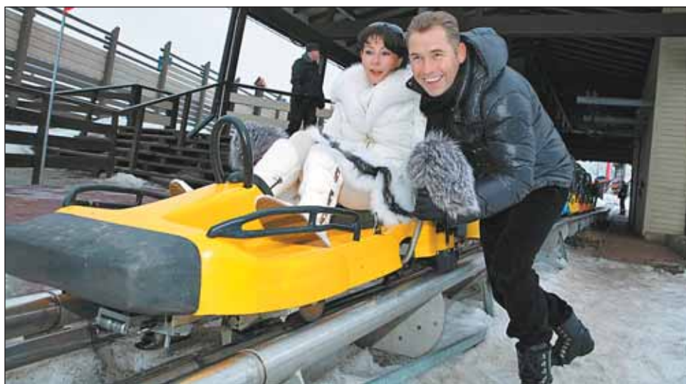
С женой на отдыхе

— Мне предложили идти учиться на разведчика во вре-