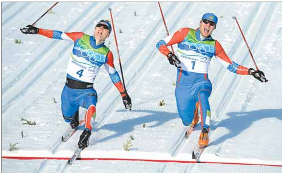
Определить, кто победил, смог только фотофиниш