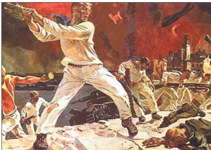
Адрес: м. «Третьяковская», «Полянка», Лаврушинский пер., 10. Тел.: (499) 230-7788, (499) 238-1378, (495) 951-1362. Стоимость билетов: 70-150 руб.