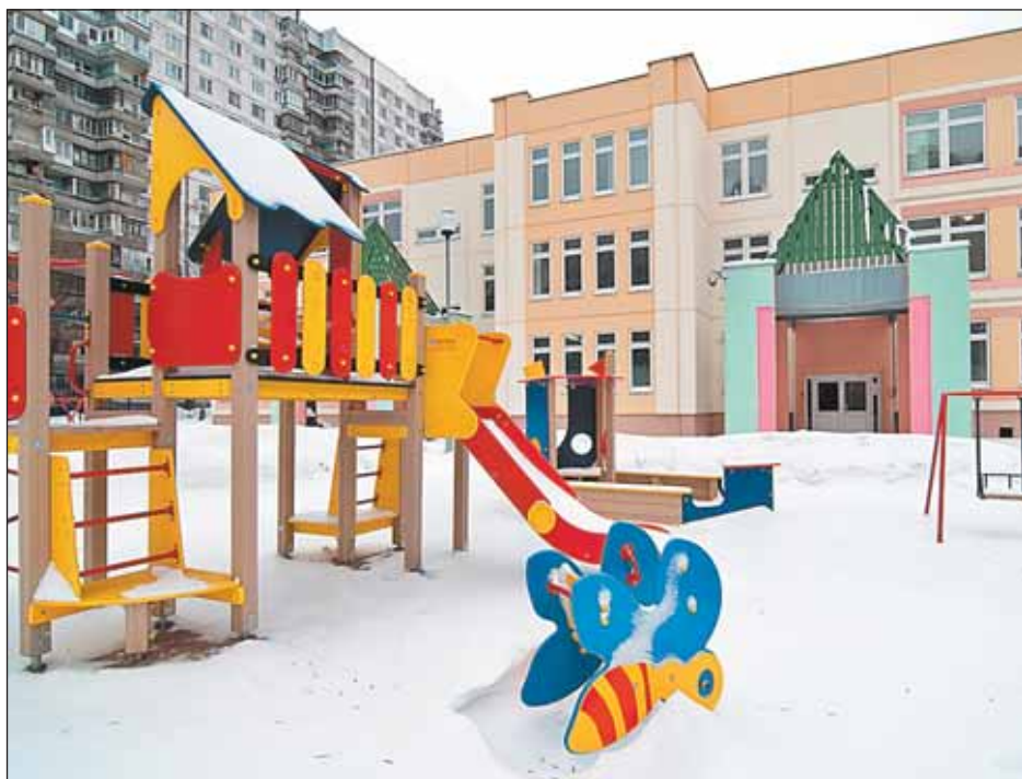
— В последнее время молодые мамы все чаще хотят отдать своих детей в ясли, — пояснила куратор детских садов Лианозова Галия Алиевна Османова. — Думаю, это связано с кризисом: мамы стараются раньше выйти на работу. Светлана ШОМПОЛОВА

Открытия нового сада в районе ждали с нетерпением. Ведь в нем предусмотрены две ясельные группы: для детей от 1,5 до 2 лет и для тех, кому исполнилось 2-3 года.