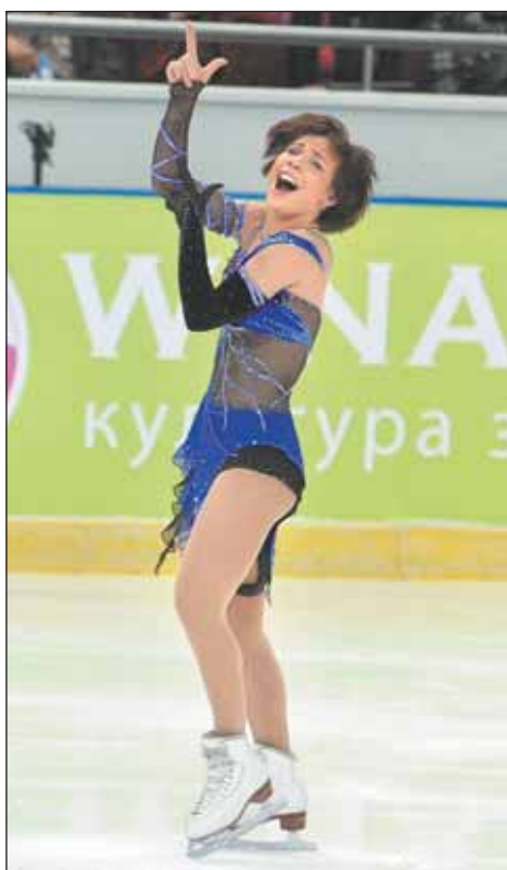
Алена Леонова — надежда нашего женского фигурного катания на Олимпиаде в Сочи. В Ванкувере она была девятой

А то, что касается ЦСКА, нашей знаменитой школы, в которой еще Станислав Алексеевич Жук закладывал традиции? Сколько сегодня получает там тренер? 8-12 тысяч рублей. Это нормально? За такие деньги можно вырастить олимпийских чемпионов? Хотя надо сказать, что Лена Водорезова-Буянова тренирует сейчас нашего второго мальчика, который принял участие в Олимпиаде — Ар-