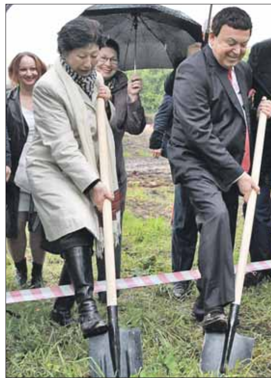
На открытии строительства поработал лопатой и Иосиф Кобзон