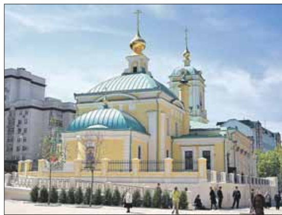
Храм на Преображенской площади был последним храмом, разрушенным в СССР

— Храм Преображения Господня был последним разрушенным в СССР. Здесь была живая православная община, возглавляемая вторым после Патриарха человеком — митрополитом Крутицким и Коломенским Николаем. В тяжелейшие годы войны сюда стекались ты-