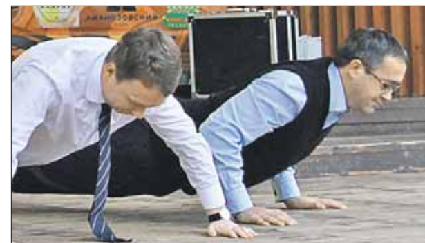
Гости дали старт празднику личным примером

В Лианозовском ПКЮ состоялся традиционный праздник спорта. В этот раз его посвятили 70-летию Великой Победы.