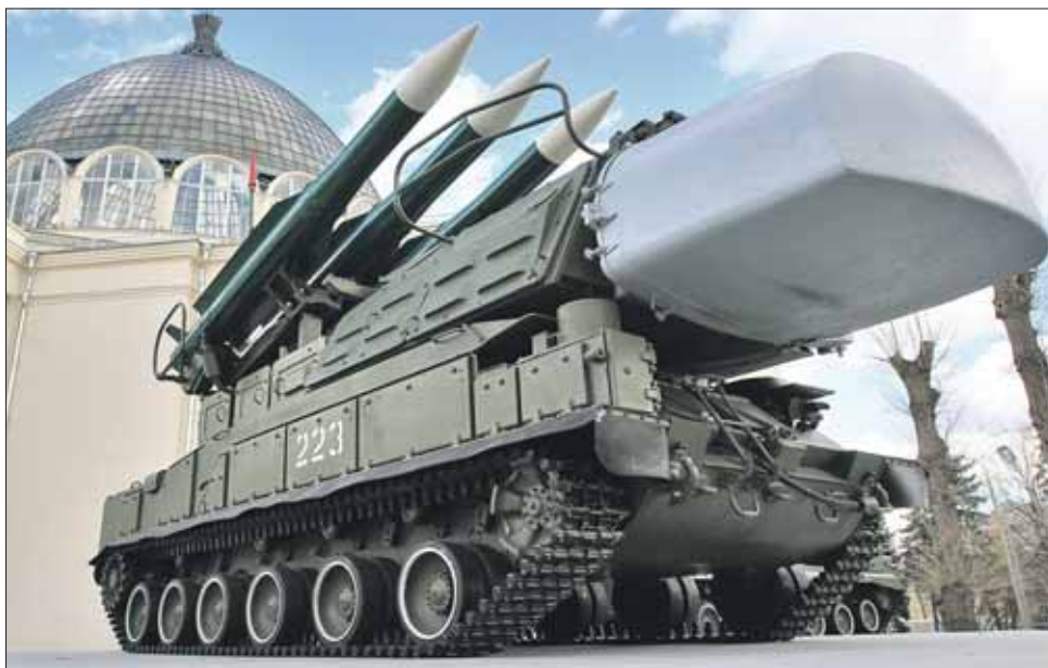
Зенитно-ракетный комплекс «Бук» редко тратит на цель больше одной ракеты

Собрать «сушки» — вертолёт-трудяга Ми-8 — едва ли не самая распространённая винтокрылая машина в мире. Ему обязаны жизнью тысячи наших бойцов в Афганистане, на Кавказе: он вывозил раненых, забирал бойцов из окружения, прикрывал их с воздуха. Эта универсальная машина имеет множество модификаций. Одна из них на выставке «Фарнборо 99» получила неофициальное название «терминатор». Тут