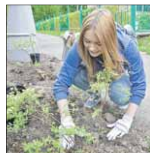
Жители озеленяли свои дворы с середины апреля

— Посадки везде прошли без накладок, в строгом соответствии с графиком. Мы проверили: практически все деревья прижились, — сообщил начальник управ-