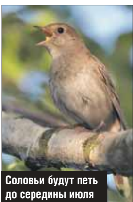
Соловьи будут петь до середины июля

На прошлой неделе в комплексном заказнике «Алтуфьевский» услышали первого в этом сезоне соловья. Как пояснили «ЗБ» экологи ГПБУ «Мосприрода», это означает, что птицы приступили к строительству гнезда и высиживанию птенцов. Поют только самцы, чтобы обозначить свою территорию. К середине мая они расппеваются в полную силу, а к началу июля постепенно смолкают. Окончание соловьиных концертов озна-