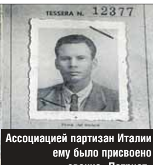
Ассоциацией партизан Италии ему было присвоено звание «Патриот»

Его направили в Падую, там скрывала русского солдата, рискуя жизнью, пожилая итальянка. Отец работал в кузнице, ковал шипы, которые партизаны бросали на дороги, чтобы останавливать колонны немецких машин. Лишь убедившись, что ему можно доверять, взяли в партизанский отряд имени Риццери. В 1944 году движение Сопротивления в Италии набирало силу. Партизаны уничтожали фашистскую технику, взрывали мосты, били немцев как могли. Из 100 тысяч сражавшихся в Италии партизан 5 тысяч — советские бойцы. Отряд Риццери был межнациональным, советских солдат — трое.