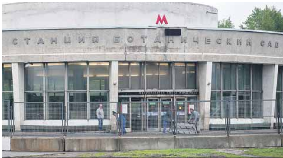
Обновлённый вестибюль откроется в марте следующего года

Сама станция продолжает работать в прежнем режиме: она имеет два вестибюля. Для удобства пассажиров, которые выходят со станции «Ботанический сад» и пересаживаются на автобусы 71-го или 603-го маршрутов, наземный транспорт временно будет подходить не к южному входу метро, а