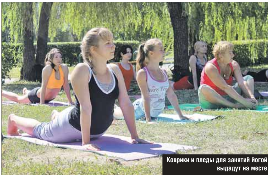
Коврики и пледы для занятий йогой выдадут на месте

С 1 июня в Бабушкинском, Лианозовском и Гончаровском парках можно будет бесплатно заниматься йогой под руководством тренера. Сделать это смогут все желающие, включая пожилых, детей и даже беременных женщин: для каждой группы будет подобрано соответствующее направление. Коврики и пледы выдадут на месте; можно захватить свой инвентарь. Тренировки в Бабушкинском парке планируются проводить на спортивной площадке по будням и выходным с 20.00 до 21.30. В Гончаровском парке — на крытой сцене по вторникам и четвергам с 20.00 до 21.30 и по выходным с 10.00 до 11.30. В Лианозовском — на танцплощадке по вторникам и четвергам с 20.00 до 21.30, по субботам с 12.00 до 13.30.