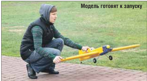
Модель готовят к запуску

26 мая в 12.00 в парке у Ростокинского акведука можно будет увидеть зрелищное авиашоу. Свои модели самолётов на соревнование, которое пройдёт в форме показательных выступлений, представят воспитанники спортивно-технического клуба «Вертикаль». Подростки покажут созданные своими руками модели самолётов, оснащённые настоящими двигателями. Средний размер