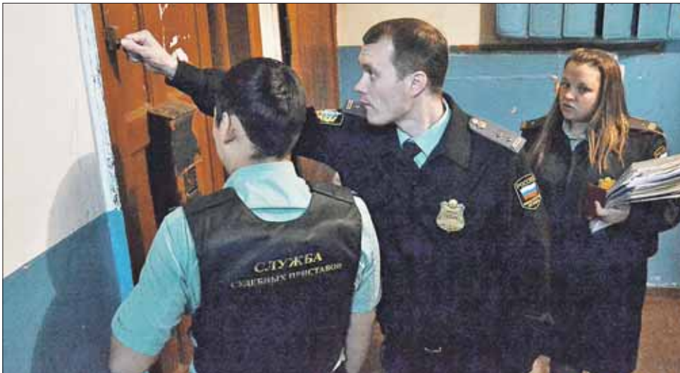
Чем закончится плановый рейд по должникам, никогда заранее не известно

Наконец дверь квартиры приоткрывает 40-летний