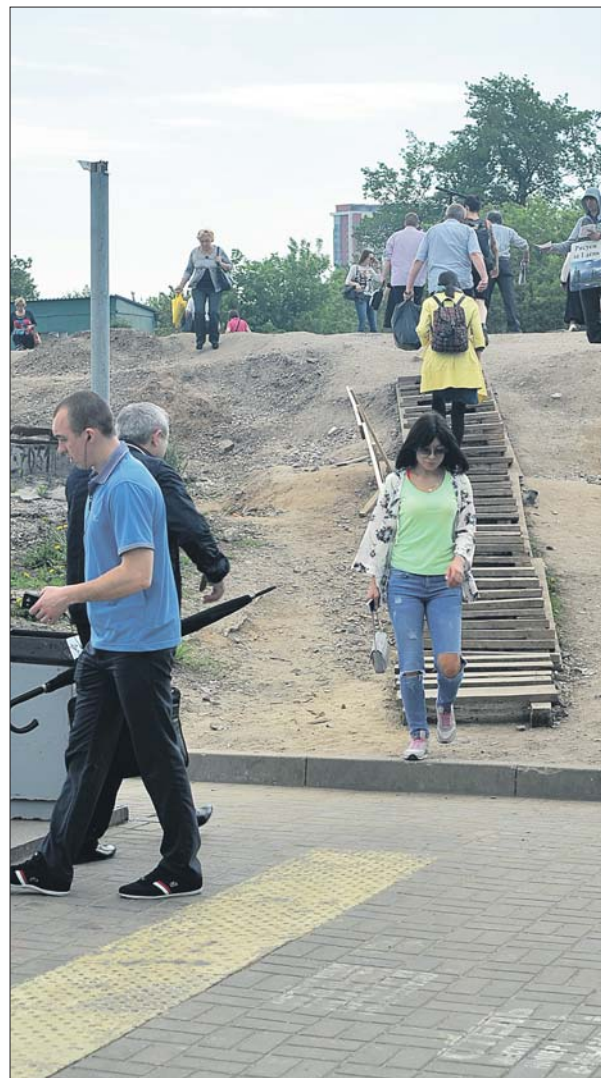
А в дождь здесь становится скользко и грязно