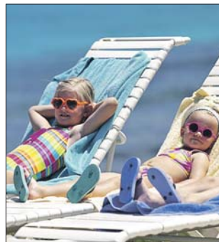
В СВАО летом будет три лагеря

Отдел психологической помощи населению в СВАО: (499) 184-4344