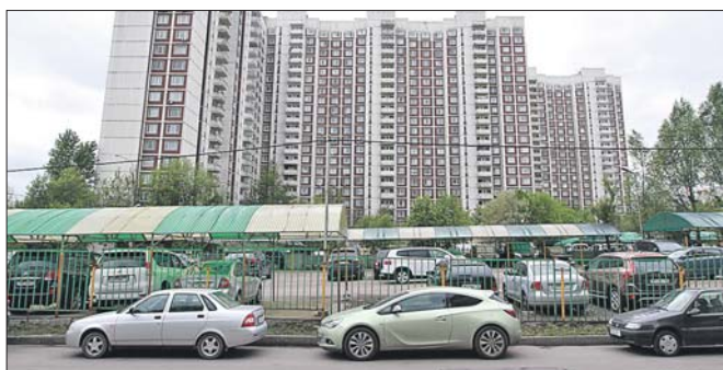
Неплохие купоны стригли на Шенкурском проезде, 3

В префектуре СВАО добавили, что этот вопрос недавно обсуждался на заседании спе-