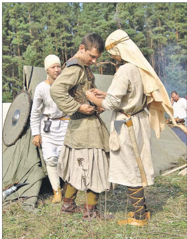
Вы увидите, каким был быт наших предков тысячу лет назад

В этот же день в Гончаровском парке (ул. Руставели, 7) на главной сцене пройдут мастер-классы по