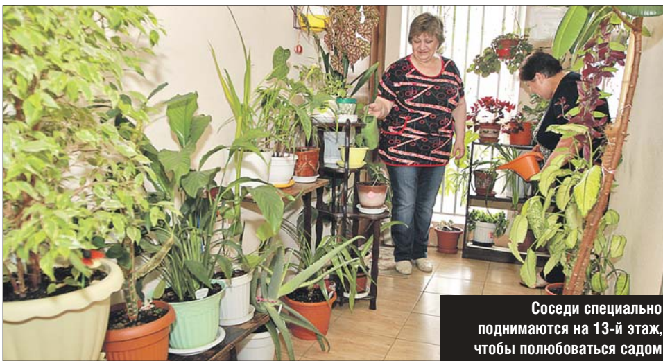
Соседи специально поднимаются на 13-й этаж, чтобы полюбоваться садом

Тут есть не только цветы, но и настоящие деревья. Например, огромный, под по-