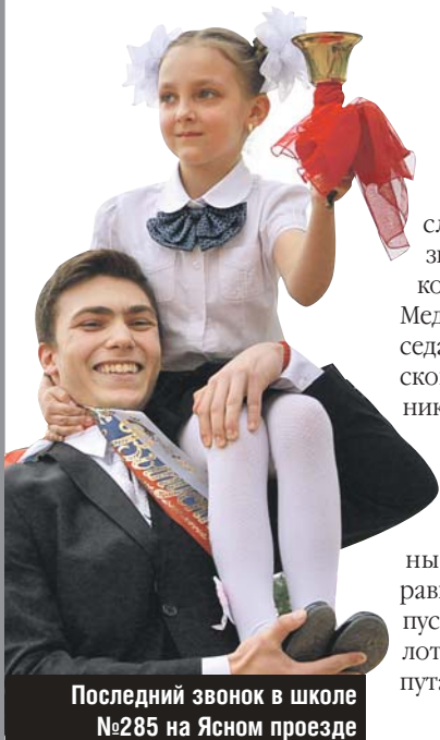
Последний звонок в школе №285 на Ясном проезде