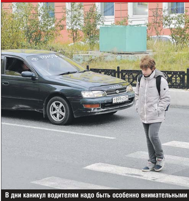
В дни каникул водителям надо быть особенно внимательными

Даже на «зебре» водитель может не заметить маленького пешехода