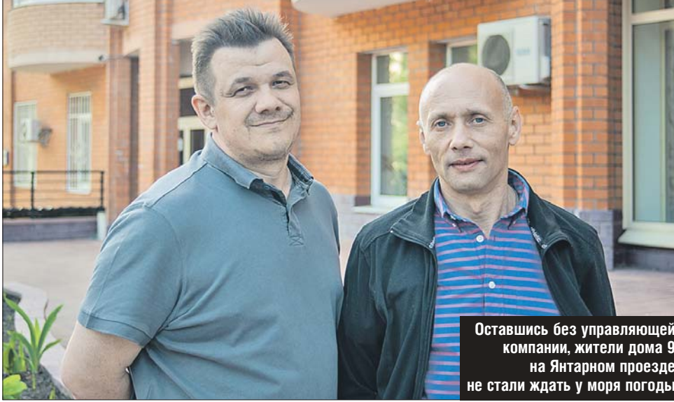
Оставшись без управляющей компании, жители дома 9 на Янтарном проезде не стали ждать у моря погоды

Те же нарушения стали причиной отказа в выдаче