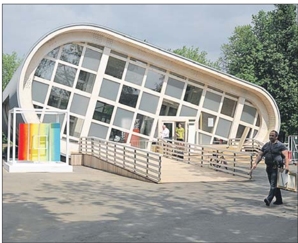
Здесь бесплатно выдают доски с фигурами и часы