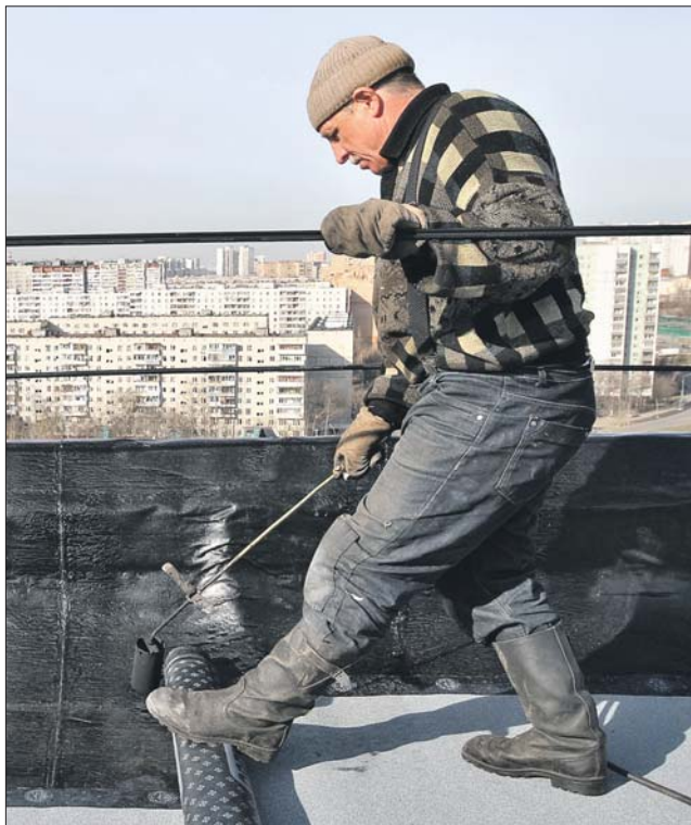
Подрядчиков для проведения работ будут отбирать в два этапа

Домам, где коммуникации старые, логичнее отчислять плату в Фонд капремонта