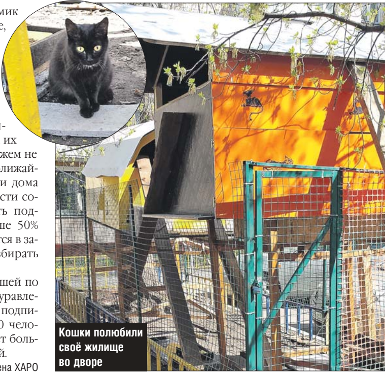
Кошки полюбили своё жилище во дворе