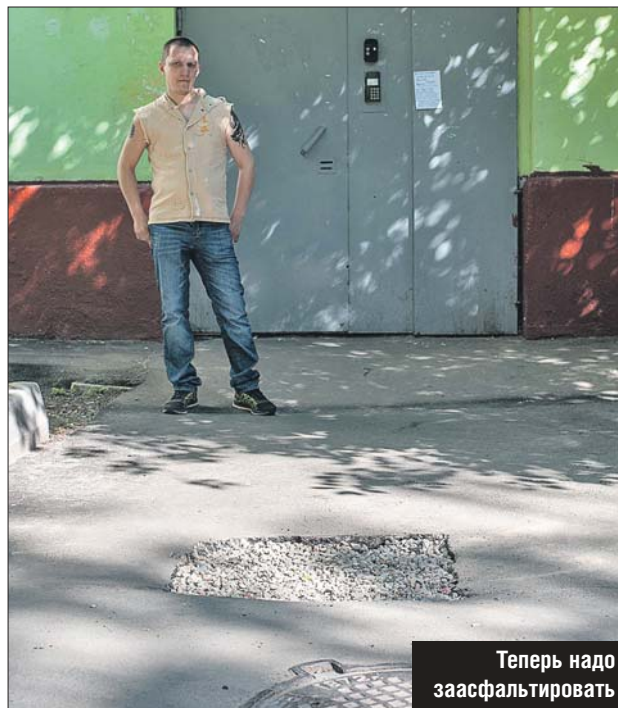
Теперь надо заасфальтировать