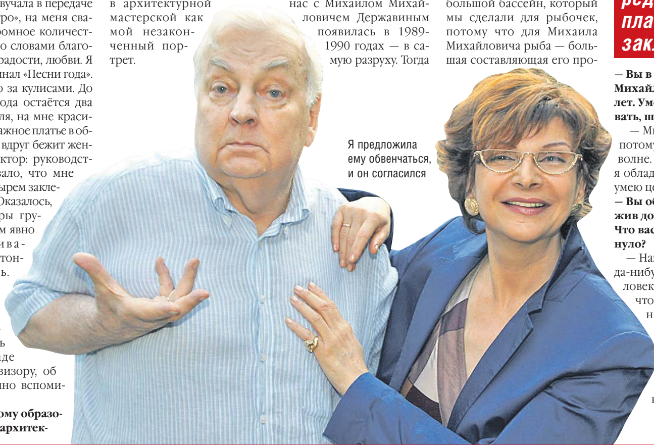
Я предложила ему обвенчаться, и он согласился

По мнению отца Серафима, наиболее убедительное разъяснение порядка поминовения сделал Филипп Солитарий, византийский богослов XI века, который говорил, что поминовение на третий, девятый и сороковой день после кончины установили апостолы, разделив на три части сорокадневный ветхозаветный плач об усопшем. Сделали они это по той причине, что Христос, после трёх дней восстав от мертвых, явился ученикам и даровал им Духа Святого. После восьми дней Христос снова явился им, утвердив Фому в вере Воскресения. Соответственно этому на девятый день мы во второй раз молимся на панихиде по умершим. Подобное совершаем и на сороковой день, когда Господь вознёсся на небо.