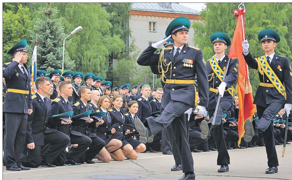
Парад в честь выпускников в Московском пограничном институте ФСБ

На плацу состоялись показательные выступления роты первокурсников, которые продемонстрировали строевые приёмы и движения с оружием. В конце выступления курсанты положили карабины на землю, выложив из них две лейтенантские звёздочки.