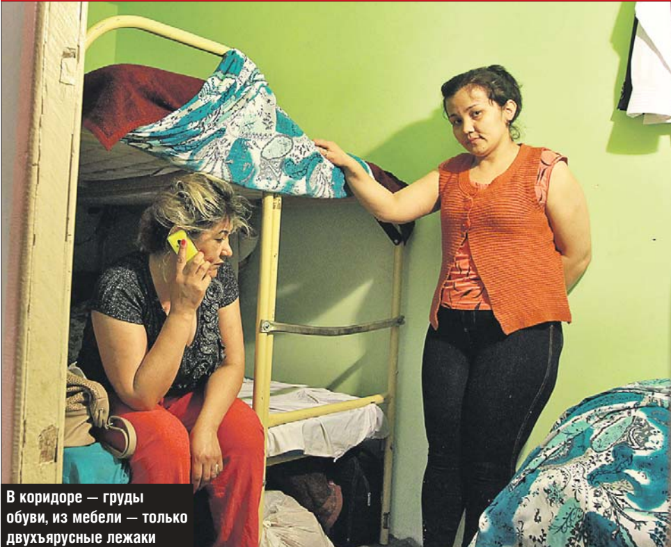
В коридоре — груды обуви, из мебели — только двухъярусные лежаки

Всех пойманных нелегалов без миграционных карт быстро погрузили в полицейский автобус. По правилам они обязаны были зарегистрироваться, если находятся здесь более семи дней. Теперь их ждёт долгое разбирательство в отделе УФМС. Если нарушение законодательства подтвердится, то гостей столицы ждёт выдворение из страны.