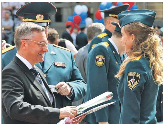
Префект напутствует выпускников Академии государственной противопожарной службы МЧС

— Вы уже с сегодняшнего дня вписываете свои строчки в историю пограничной службы России, пусть эти строчки будут наполнены священным долгом служения Отчизне, — сказал префект.