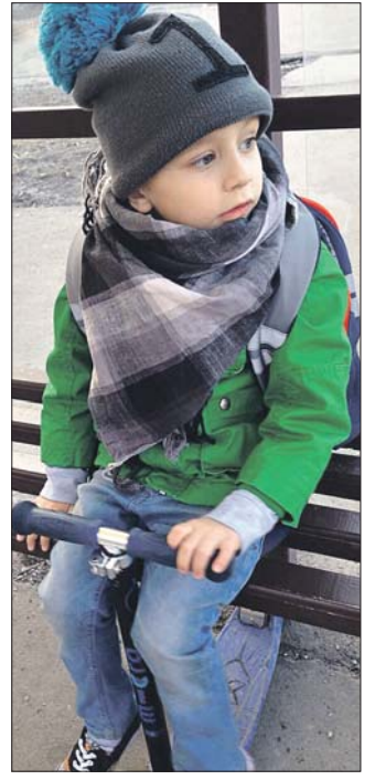
Мальчик мечтает стать архитектором