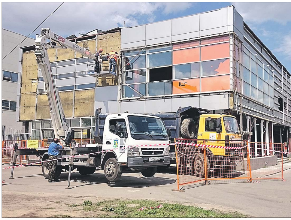
Оказалось, что павильон возвели без разрешительной документации