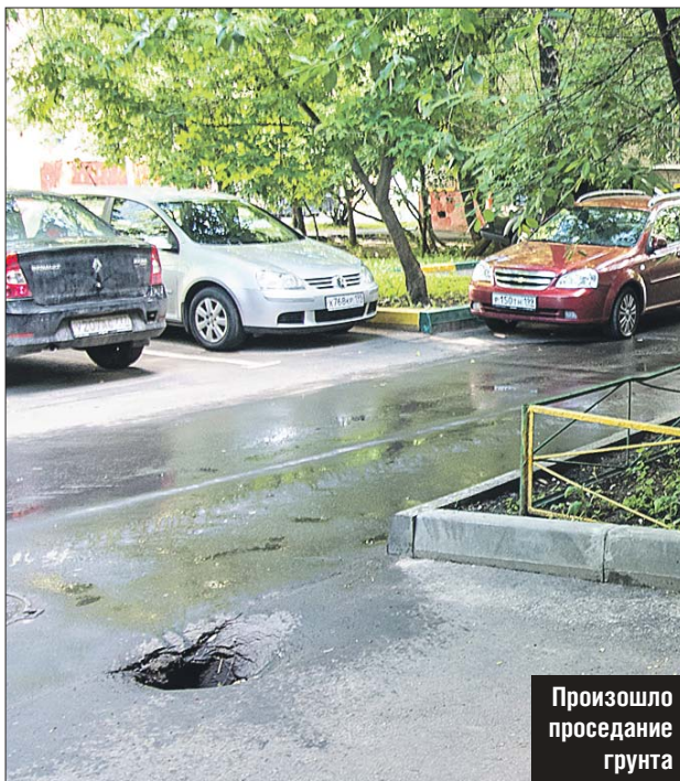
Произошло проседание грунта