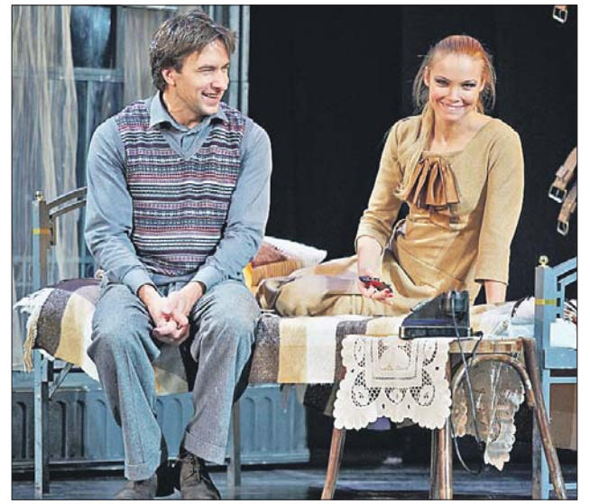
Спектакль «Двое на качелях» не привезут на улицу Проходчиков