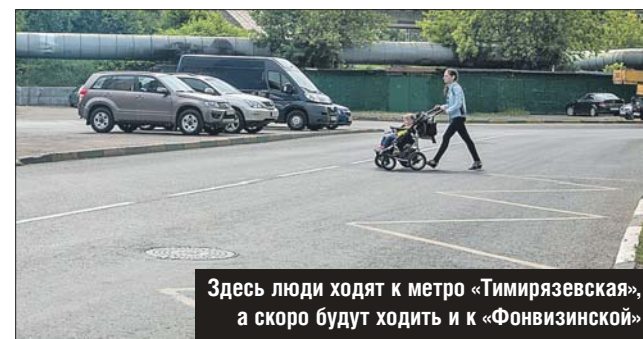
Здесь люди ходят к метро «Тимирязевская», а скоро будут ходить и к «Фонвизинской»