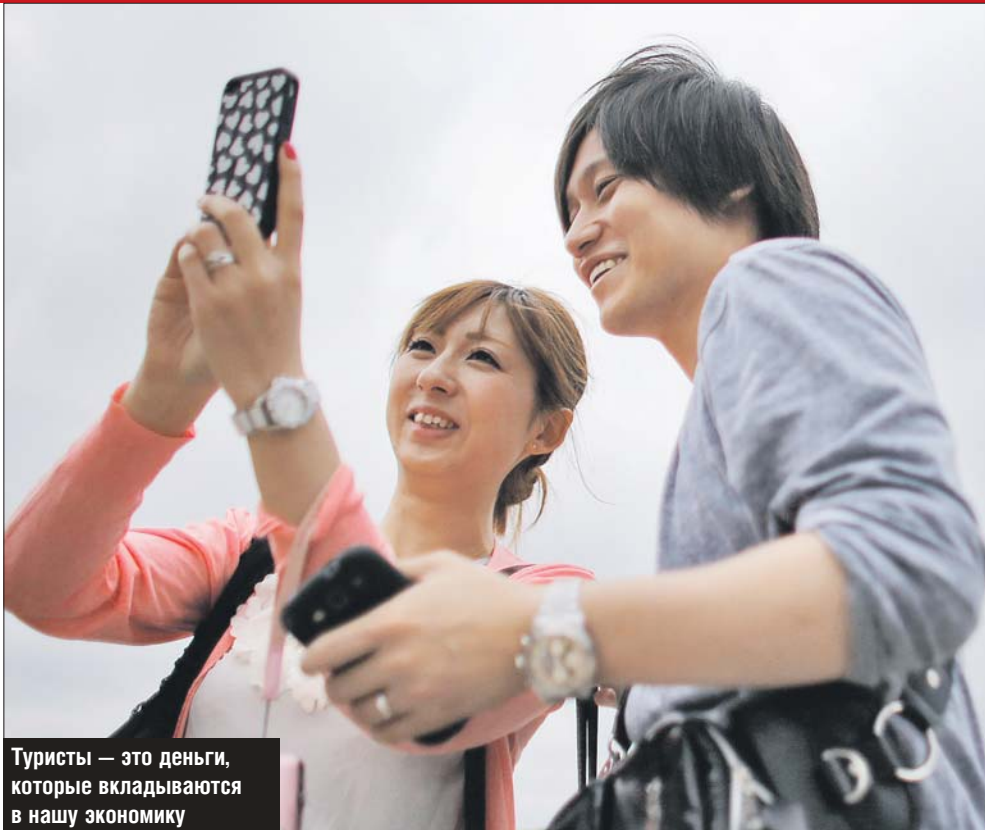
Туристы — это деньги, которые вкладываются в нашу экономику

Сегодня в мегакомплексе около 400 туристов из Китая, а в некоторые дни бывает и до 700. Дело в том, что туристический гостиничный комплекс «Измайлово» («Гамма», «Дельта») входит в восьмёрку москов-