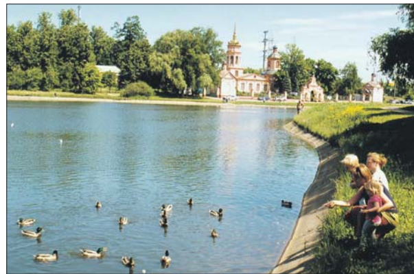
Где-то там, за подлеском, жил Ворошилов

У пруда в Лианозове прятались дядьки в шляпах