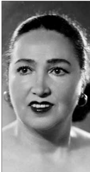
Вся её жизнь связана с оперной сценой