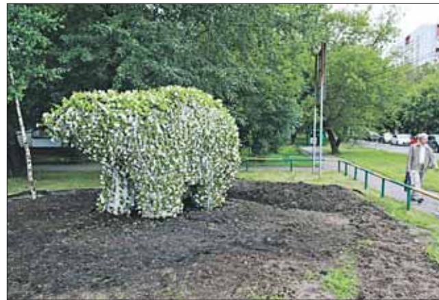
Мишка, мишка, где твоя улыбка?