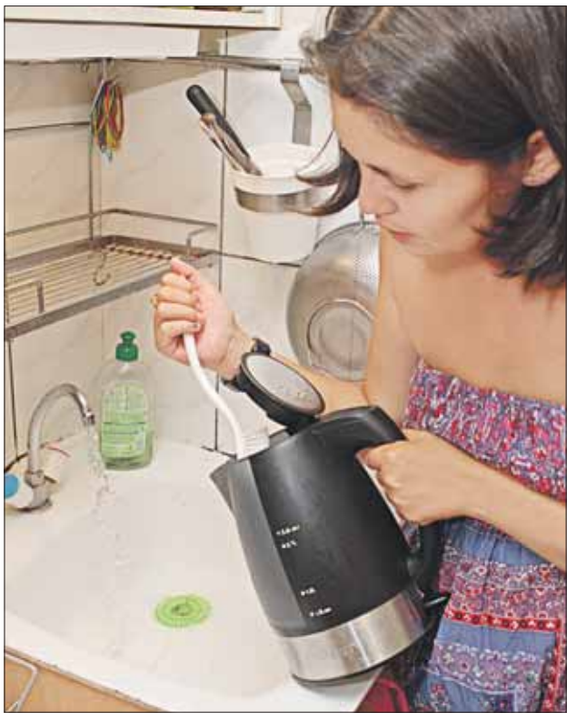
В зависимости от времени года накипи может быть больше или меньше

Максимально допустимый градус жёсткости в Москве — 5,5