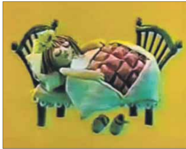
Кто не знает песню про усталые игрушки и уснувшие книжки?

— Какие самые яркие воспоминания детства?