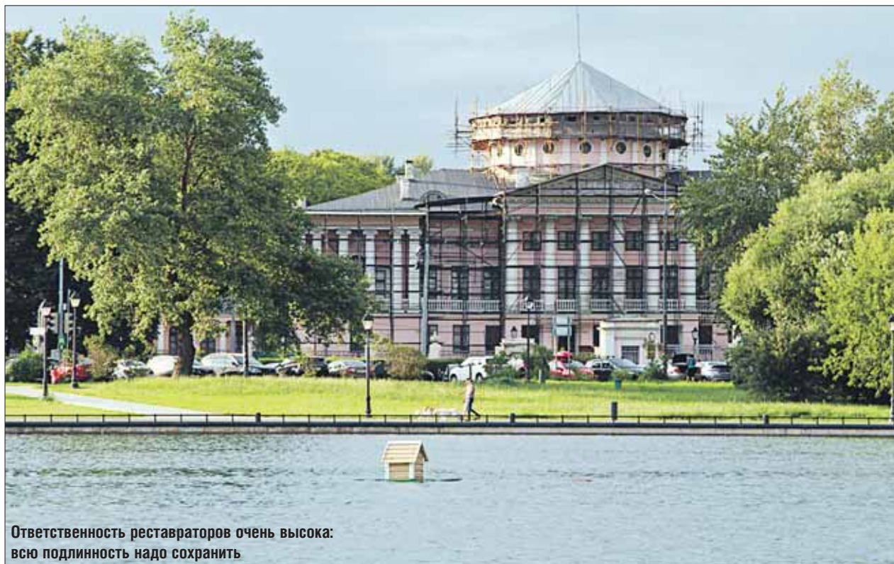
Ответственность реставраторов очень высока: всю подлинность надо сохранить

По фасаду пробурили шурфы и зондажи, чтобы понять, в каком состоянии здание