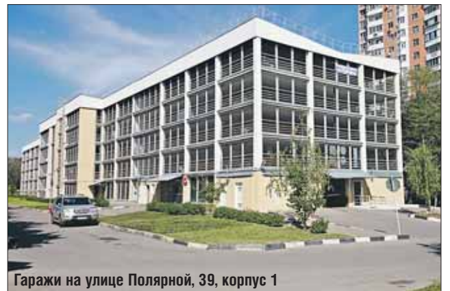
Гаражи на улице Полярной, 39, корпус 1

На сегодняшний день в СВАО на продажу уже вы-