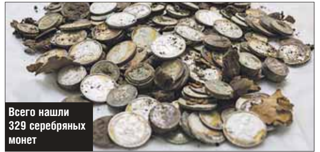
Всего нашли 329 серебряных монет

Клад, датируемый двадцатыми годами прошлого века, обнаружили при прокладке электрокабеля на территории Городской фермы на ВДНХ. Как рассказали в пресс-службе выставки, рабочими обнаружен небольшой схрон.