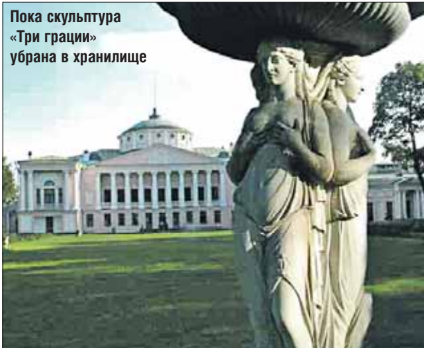
Пока скульптура «Три грации» убрана в хранилище

По фасаду пробурили шурфы и зондажи, чтобы понять, в каком состоянии здание