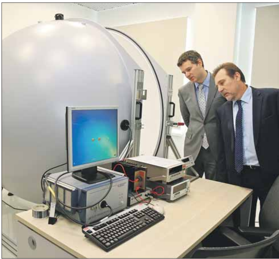
В компании «Световые технологии» разработали светильники, которые могут экономить от 40 до 90% электроэнергии

Всего через 10 лет после основания АВВУ стала известна далеко за рубежом — в Европе и Штатах. Эта компания занимается созданием искусственного интел-