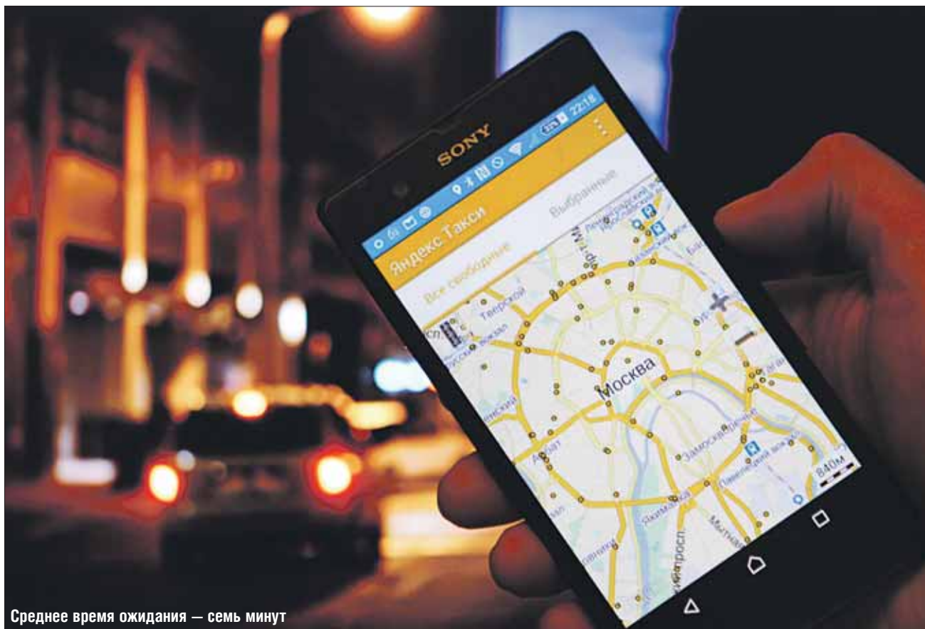
Среднее время ожидания — семь минут

Принцип работы сервиса незамысловат: любой легальный таксист, предварительно получивший разрешение на свою деятельность, подписывает договор с «Яндекс