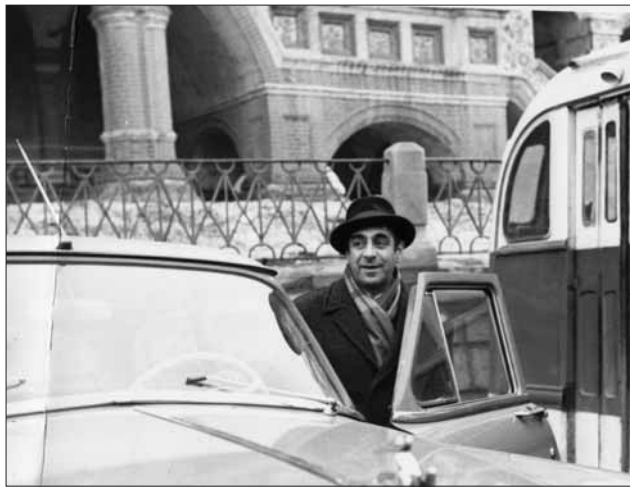
Аркадий Ильич никогда не закрывал свою зелёно-салатовую «Волгу»: знал, что «машину Островского» не тронут

Сын композитора Аркадия Островского рассказал о своём знаменитом отце