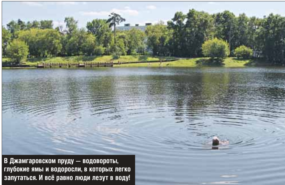
В Джамгаровском пруду — водовороты, глубокие ямы и водоросли, в которых легко запутаться. И всё равно люди лезут в воду!

А несколько дней назад тело мужчины — приехавшего из Беларуси — достали из пруда около кинотеатра «Марс» в Алтуфьеве. В Москву погибший приехал в гости к