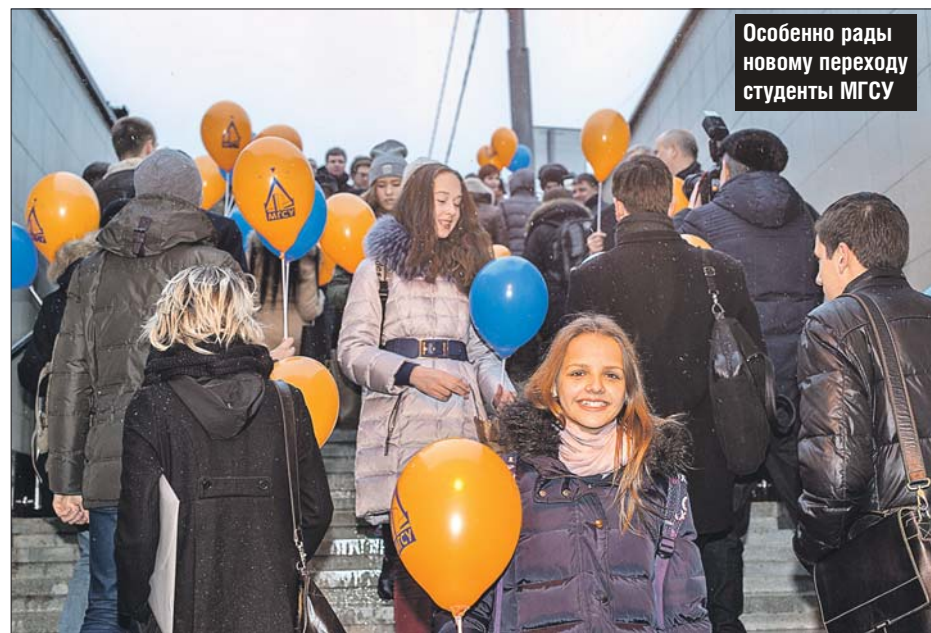
Особенно рады новому переходу студенты МГУ

После реконструкции открылся подземный переход через Ярославское шоссе в районе улицы Вешних Вод, напротив МГУ. Теперь студенты, преподаватели, а также жители Ярославки и улиц Вешних Вод и Ротерга могут переходить трассу, не