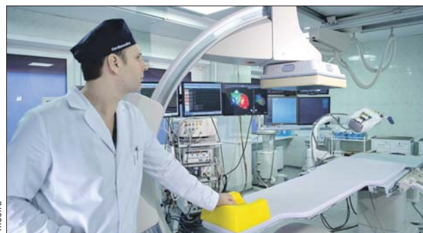
В клинике появилось уникальное оборудование

— Сегодня все планы по реконструкции реализованы, создано 10 самых современных оперблоков с высокотехнологичным оборудо-