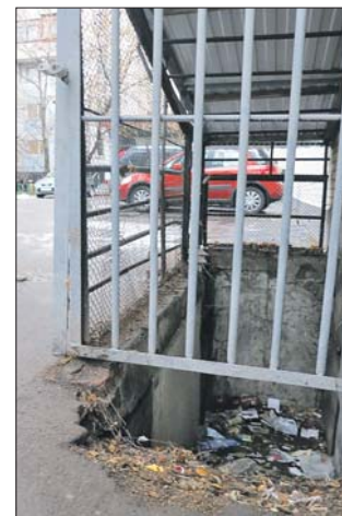
Та самая яма

Действительно, я обнаружила на указанном читателем месте здоровенную дыру. Асфальт разрушился, образовав большой провал, к тому же заваленный мусором.