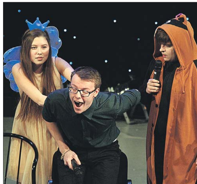
Выступление команды «План Б»

Финал Северо-Восточной лиги КВН на Кубок префекта СВАО собрал на одной сцене лучшие команды от пяти вузов округа — «Осенний поцелуй» (МГУ), «Город снов» (МИИГАиК), «Иван да Марья» (РГУ), «Не сахар» (МГУ), «План Б» (МПУ). В качестве судей выступили опытные казёнщики — участники Выс-