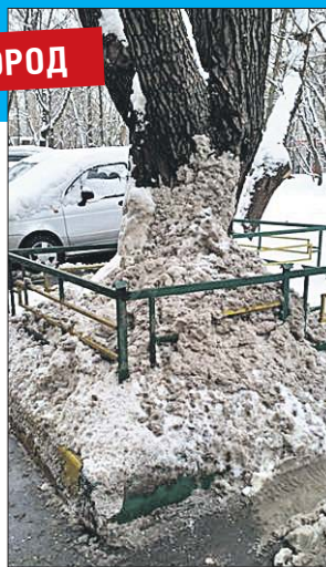
Вот так «ухаживают» за зелёными насаждениями на проезде Дежнёва, 9, корпус 1