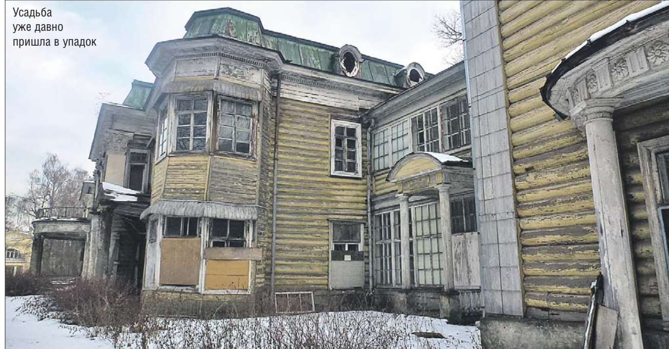
Усадьба уже давно пришла в упадок