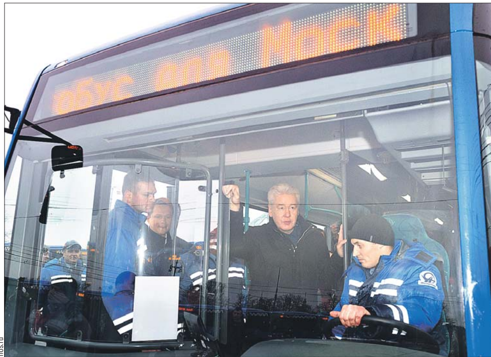
Сергей Собянин побывал в кабине новенького автобуса «Мерседес»

О том, что система подбора коммерческих перевозчиков вскоре будет носить принципиально иной характер, власти города заговорили давно. Но лишь на одном из последних заседаний столичного правительства обновления дали официальный старт. В начале декабря руководитель Департамента транспорта Максим Ликсутов пообещал,