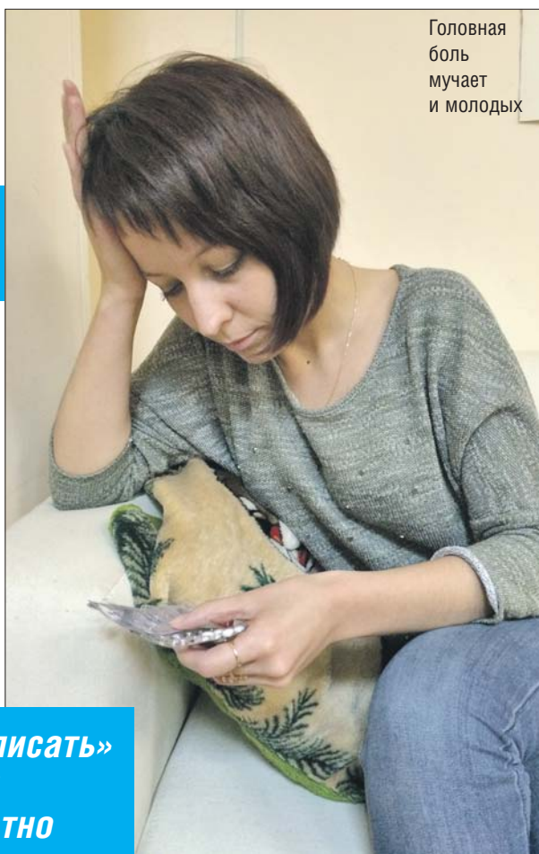
Головная боль мучает и молодых

Почему, скажем, после двух часов, проведённых в спортзале, мы ощущаем позитив? Да потому, что в кровь выбрасываются те самые природные наркотики — серотонины и эндорфины. Они создают человеку позитивное настроение, а заодно поднимают иммунитет. Ещё Гиппократ говорил, что постоянные физические нагрузки — это плюс 15 лет жизни.