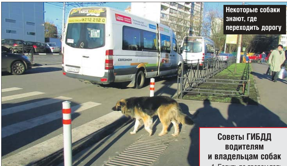
Некоторые собаки знают, где переходить дорогу

Как отмечают в группе розыска ГИБДД округа, это не единичный случай: с по-