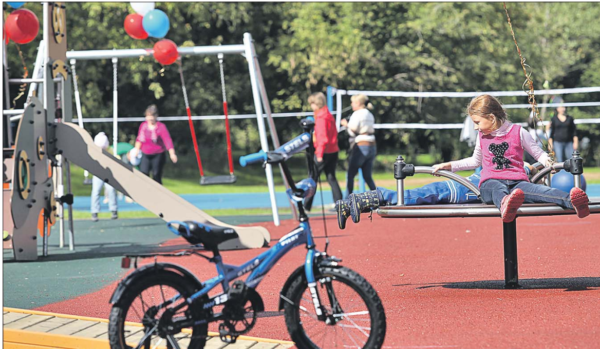
В 2014 году в Отрадном обустроили большую зону отдыха

Полную версию интервью, в которой освещаются также транспортные и коммунальные вопросы, проблемы нелегальной миграции и ход подготовки к празднованию 70-летия Победы, читайте на сайте газеты www.zbulvar.ru и префектуры СВАО svao.mos.ru