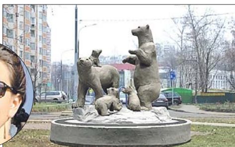
Так будет выглядеть скульптурная группа дей отольют согласно их настоящим размерам — под три метра.

Композиция существует пока в пластилине (её высота — около 50 сантиметров). В бетоне она будет смотреться внушительно: медве-