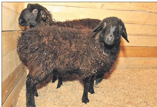
Овечкам ещё расти и расти