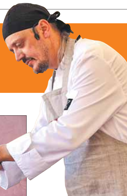
Знаменитый итальянский шеф-повар Роберто Бруно проведёт мастер-классы

— В данный момент дать мастер-классы согласились итальянский шеф-повар Роберто Бруно, австралиец Себби Кэньон, специалист по паназиатской кухне Па-