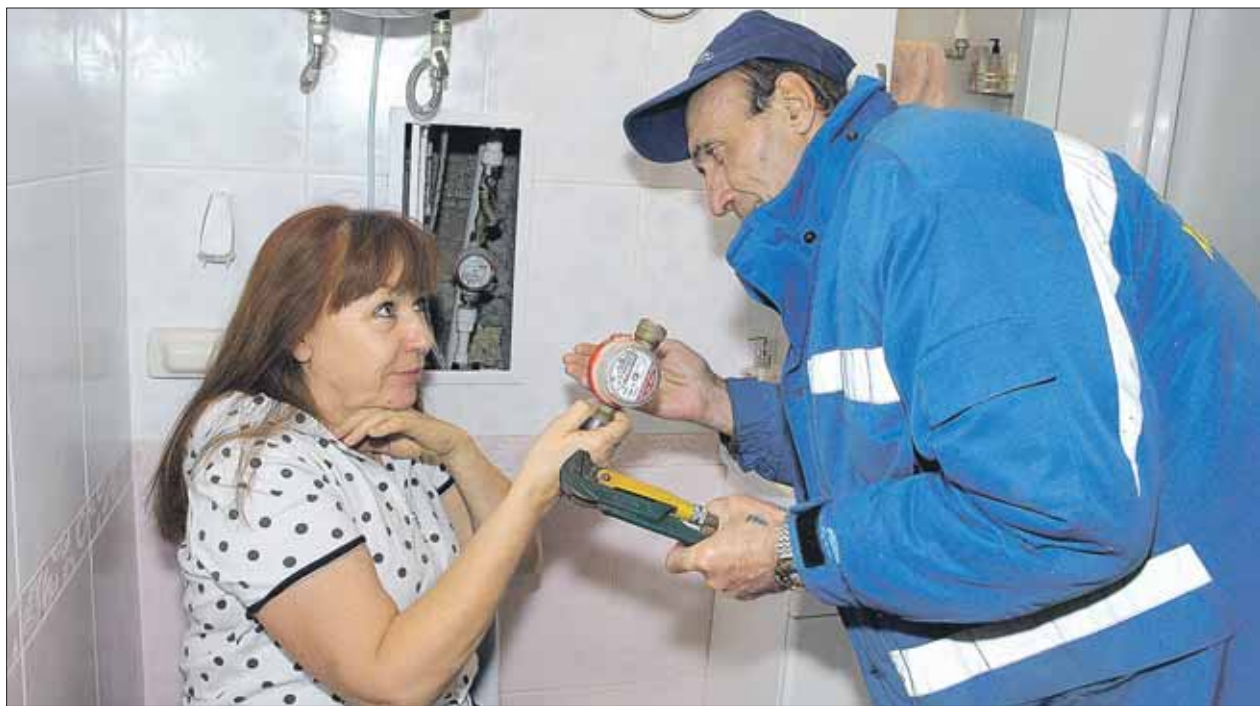
Навязчивые услуги по замене или поверке водосчётчика следует игнорировать

«Каждый день мне звонят и предлагают заменить во-