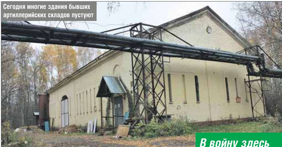
Сегодня многие здания бывших артиллерийских складов пустуют