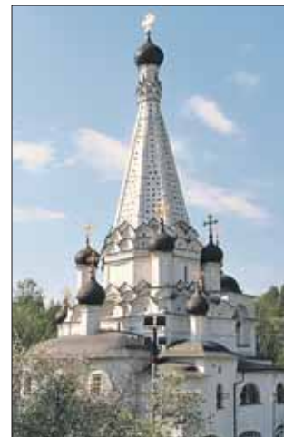
Храм Покрова Пресвятой Богородицы в Медведковке

ковными стенами: педагоги, воспитанники и их родители участвуют в различных культурных и благотворительных акциях. Несколько лет здесь помогают детским домам Уфы, а недавно собрали подарки для детей Донбасса.