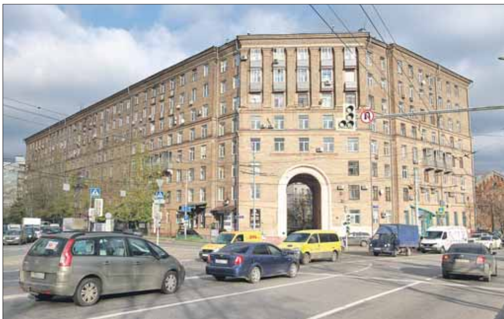
Продажа квартиры в доме 1/2 на улице Руставели сулила аферистам крупный куш