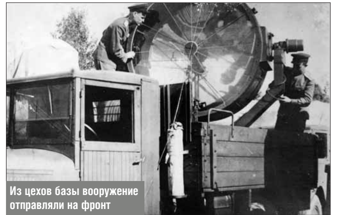
Из цехов базы вооружение отправляли на фронт

приборов для артиллеристов. Разумеется, базу стремились уничтожить немцы. Однажды в планшете сбитого вражеского лётчика обнаружили карту с обозначением базы №36, где в качестве ориентира был отмечен большой пруд. Его срочно засыпали, а очистили уже после войны. Разбомбить базу немцам так и не удалось.