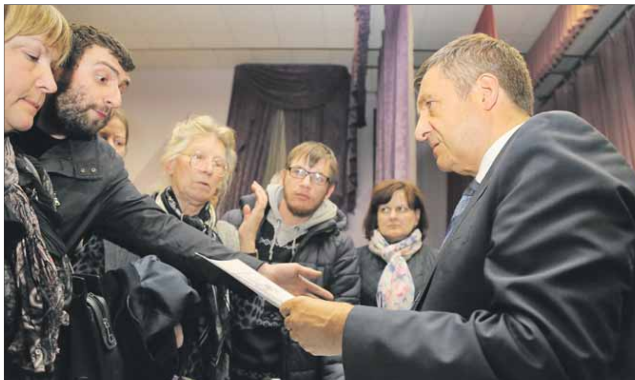
Глава округа ответил на несколько десятков вопросов, общение с жителями продолжилось и после завершения официальной части встречи

— Да, новая поликлиника у вас будет. В Адресную инвестиционную программу г. Москвы внесено 12 таких объек-