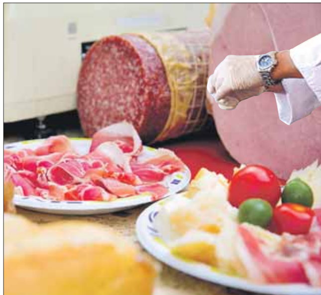
Еду приправят хорошей музыкой и культурными программами

Еврейский «народный» сэндвич, в котором вместо обычного хлеба используется особым образом размягчённая маца, будет представлен на фестивале. Конкуренцию Давиду составят рестораны, предлагающие азиатскую, европейскую,