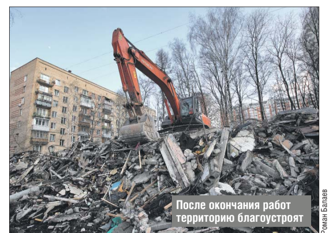
После окончания работ территорию благоустроят

После окончания всех демонтажных работ территорию площадью 5,4 тысячи кв. метров благоустроят: рабочие разровняют землю и засеют её газонной травой.