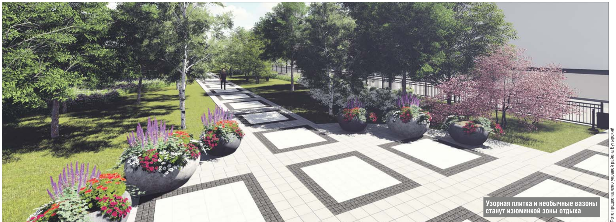
Узорная плитка и необычные вазоны станут изюминкой зоны отдыха