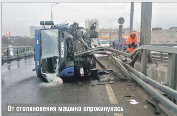
От столкновения машина опрокинулась

правого края проезжей части, за рулём которого находился 39-летний водитель «Соляриса» увезли в больницу с сотрясением мозга и ушибом грудной клетки.