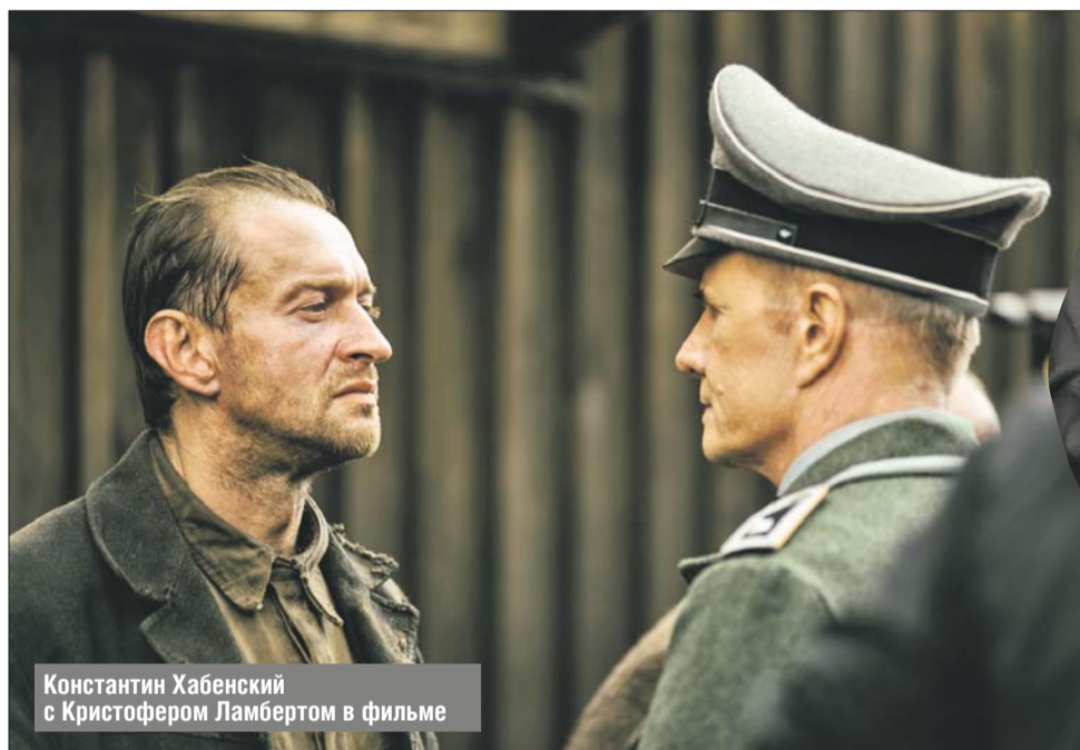
Константин Хабенский с Кристофером Ламбертом в фильме

— Где-то между 22-м и 31-м вариантом монтажной версии фильма я понял, что хочу любой ценой довести его до