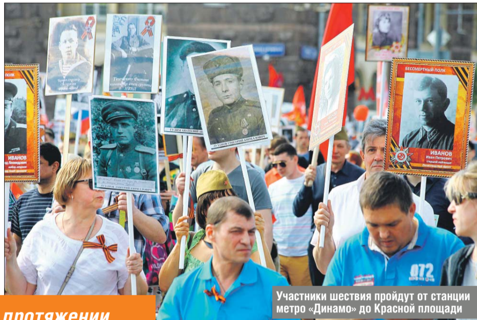
Участники шествия пройдут от станции метро «Динамо» до Красной площади

Как и в 2017 году, на протяжении всего маршрута участники «Бессмертного полка» смогут бесплатно получить воду в бутылках, будут работать полевые кухни. На специально оборудованных площадках выступят творческие коллективы. На протяжении