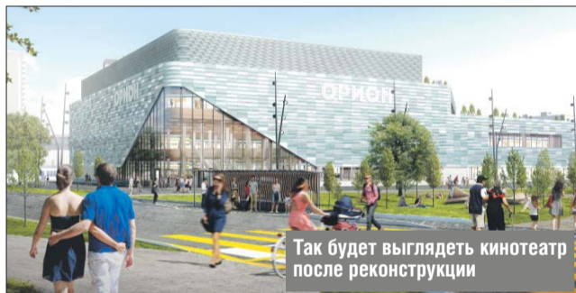
Так будет выглядеть кинотеатр после реконструкции