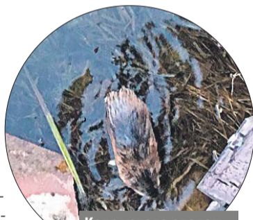
Кадр успела сделать наша читательница