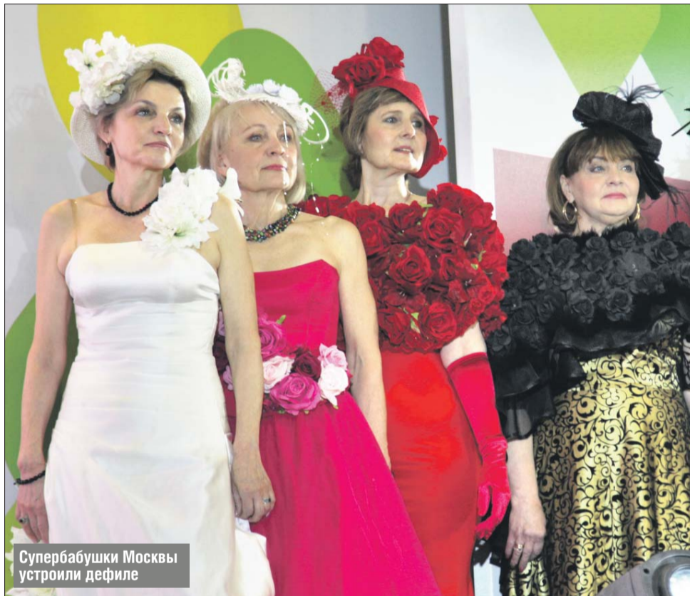
Супербабушки Москвы устроили дефиле

— Я с удовольствием согласился поучаствовать в проекте «Московское долголетие», — рассказал он «ЗБ». — Во-первых, я сам пенсио-