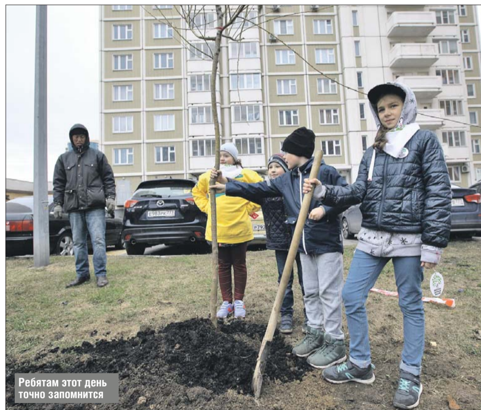
Ребятам этот день точно запомнится