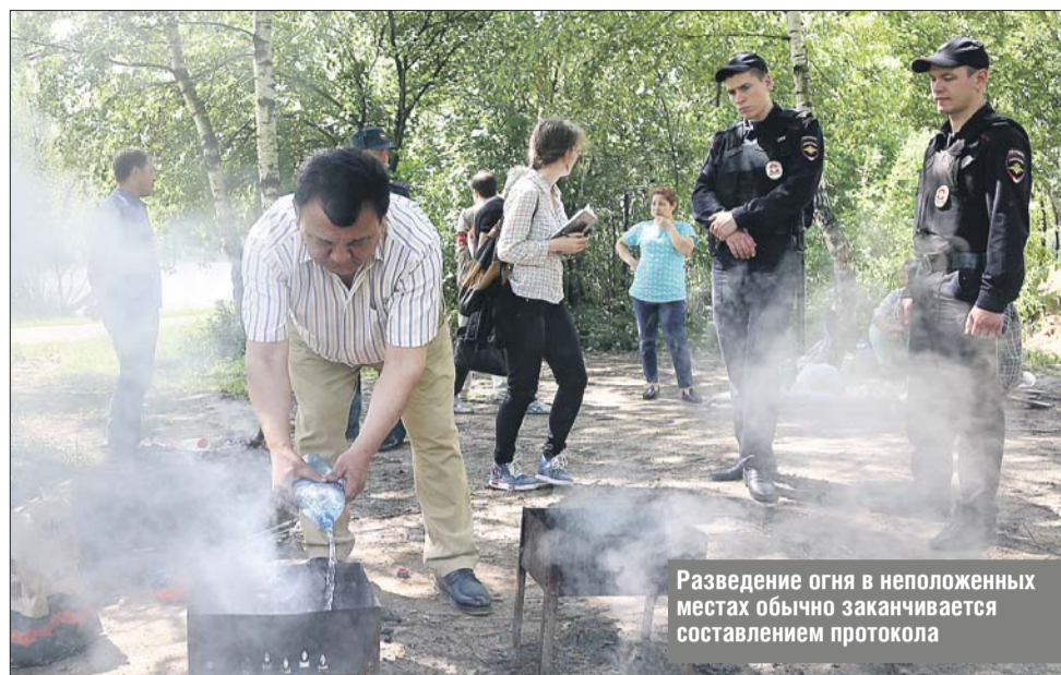
Разведение огня в непопулярных местах обычно заканчивается составлением протокола

тре «Красная сосна» (12-я линия Красной Сосны, 28), другая — в центре «Русский быт» (ул. Проходчиков, 1). Но обе эти пикниковые площадки — платные. За час аренды со взрослого возьмут 100 рублей, за ребёнка — 70 рублей. Лишь за детей до трёх лет платить не надо. В пикниковых зонах есть беседки, лавочки и столы.