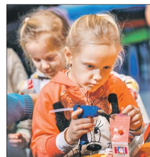
Будет много интересных занятий

Свои программы этим летом представят ведущие образовательные, театральные, социальные, выставочные и благотворительные организации: факультет журналистики МГУ, Высшая школа экономи-