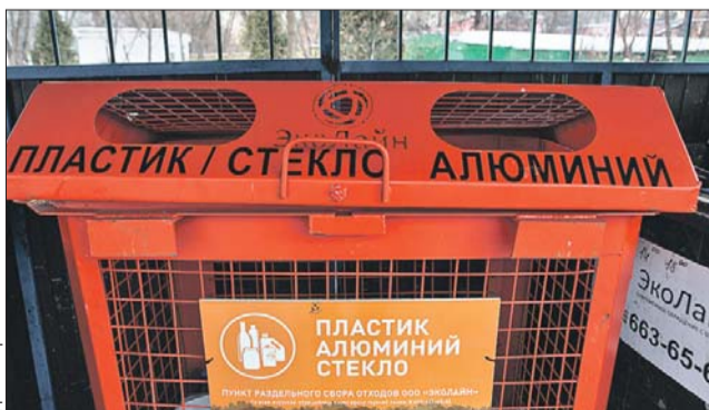
Собранный раздельно мусор потом ещё раз досортируют на предприятии. Главное, чтобы он не смешивался с пищевыми отходами