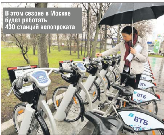
В этом сезоне в Москве будет работать 430 станций велопроката

Старт 6-му сезону велопроката в Москве дал мэр города Сергей Собянин. По его мнению, количество людей, которые пользуются этим сервисом, будет увеличиваться.