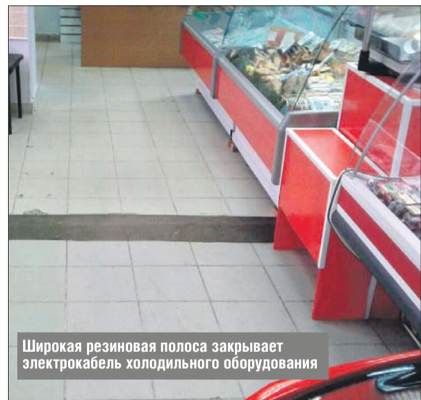
Широкая резиновая полоса закрывает электрокабель холодильного оборудования