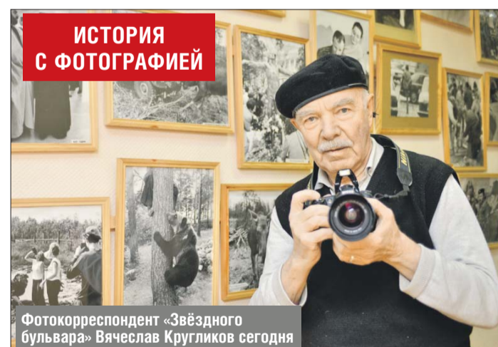
ИСТОРИЯ С ФОТОГРАФИЕЙ

лы, а на фронт детей не берут. Мастер сборочного цеха, прочитав мою бумажку об окончании слесарных курсов и покачав головой, сказал: «Пойдёшь в бригаду медников-ремонтников, там не хватает мужиков». Загрузив санки кусками алюминия, дрелями и молотками, бригада отправилась на заводской аэродром, куда с передовой прилетают израненные наши «ястребки», требующие ремонта. Лиц новых друзей разглядеть