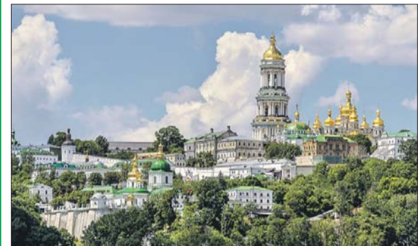
Киево-Печерская лавра — одна из главных православных святынь

По мнению митрополита, нынешняя инициатива украинских властей, несмотря на весь информационный шум, будет иметь ту же судьбу, что и предыдущие такие же попытки.