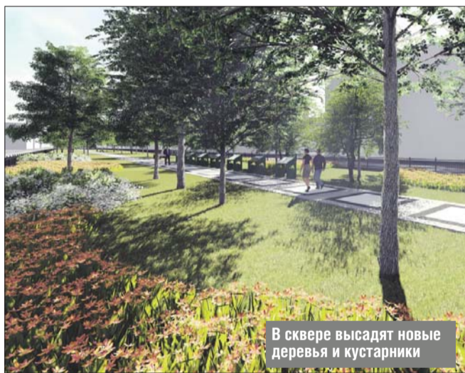
В сквере высадят новые деревья и кустарники