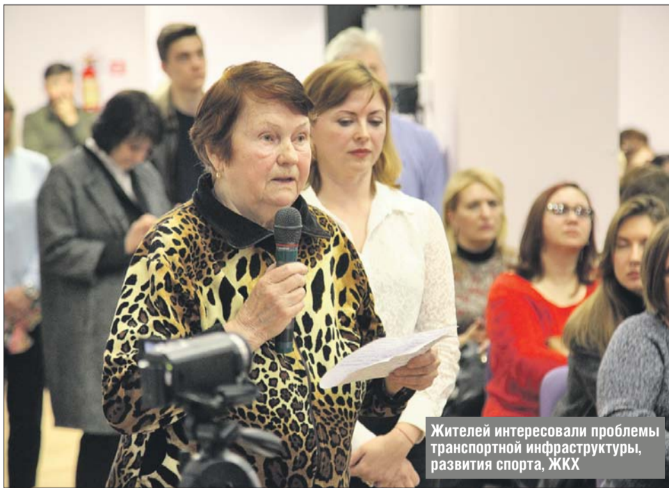
Жителей интересовали проблемы транспортной инфраструктуры, развития спорта, ЖКХ

Жителям района будет выделено время для занятий на поле и в легкоатлетической зоне