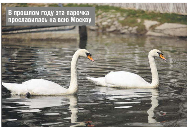
В прошлом году эта парочка прославилась на всю Москву

Между прочим, в прошлом году Ромео и Джульетта прославились на всю Москву из-за неудавшегося побега из