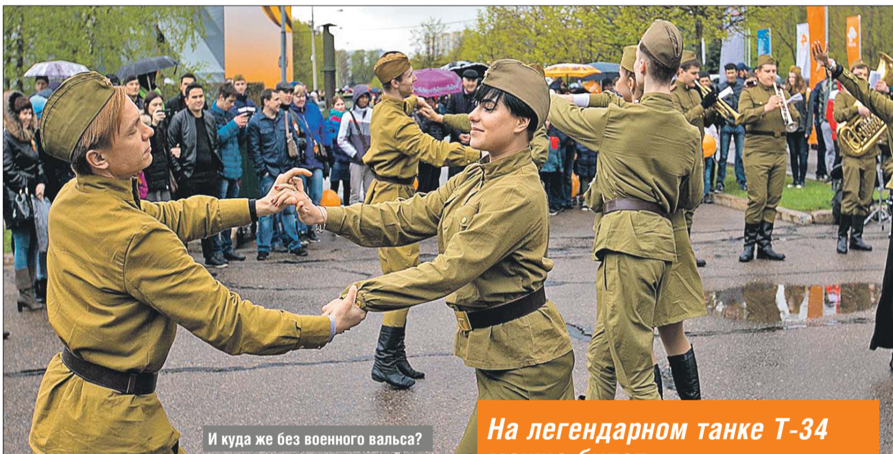
И куда же без военного вальса?

На легендарном танке Т-34 можно будет сфотографироваться