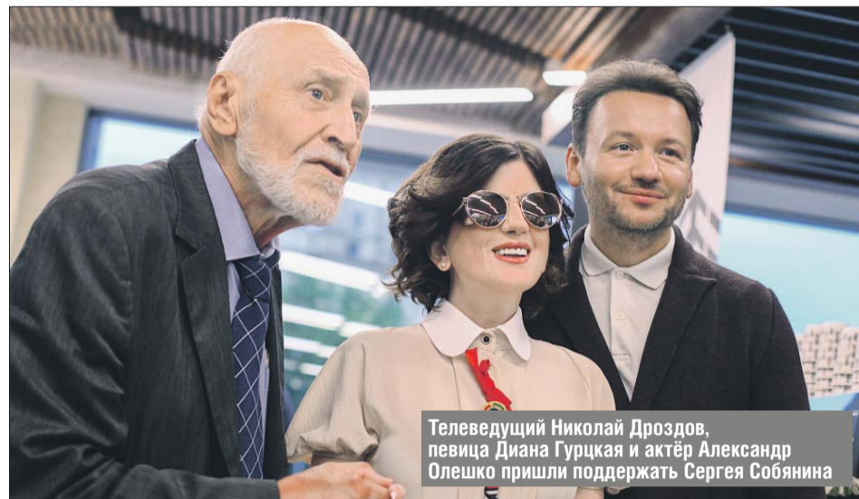
Телеведущий Николай Дроздов, певица Диана Гурцкая и актёр Александр Олешко пришли поддержать Сергея Собянина