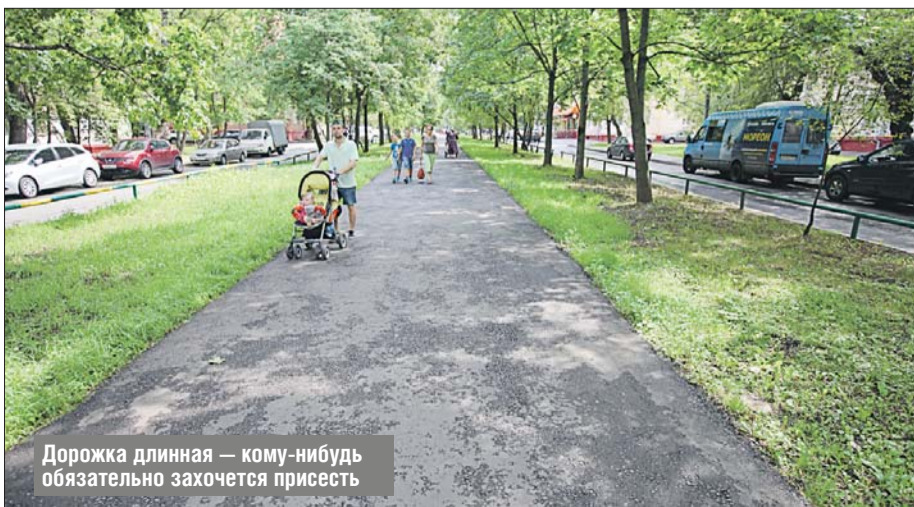
Дорожка длинная — кому-нибудь обязательно захочется присесть

▶ Управа Ярославского района: Ярославское ш., 122, корп. 1, тел. (499) 188-7764. Эл. почта: yarspr@mos.ru