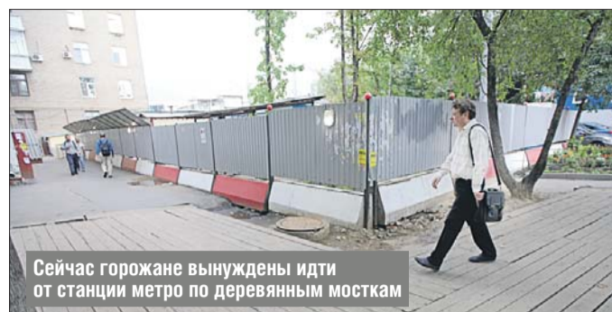
Сейчас горожане вынуждены идти от станции метро по деревянным мосткам