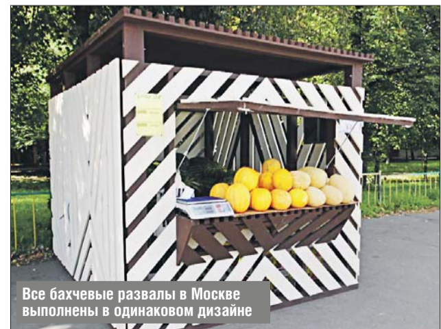
Все бахчевые развалы в Москве выполнены в одинаковом дизайне