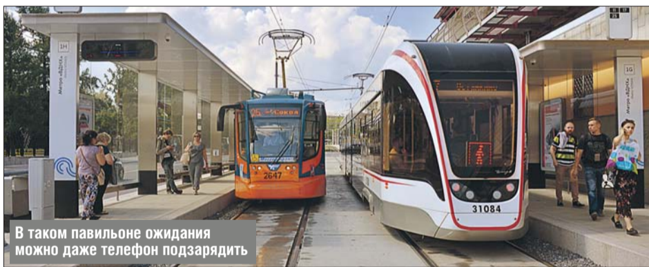
В таком павильоне ожидания можно даже телефон подзарядить