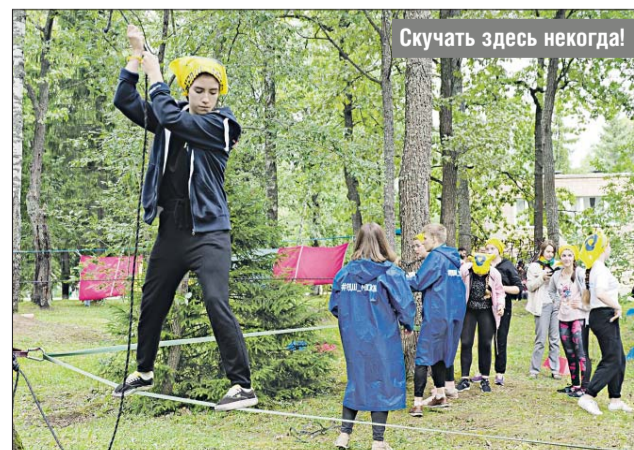
Скачать здесь некогда!