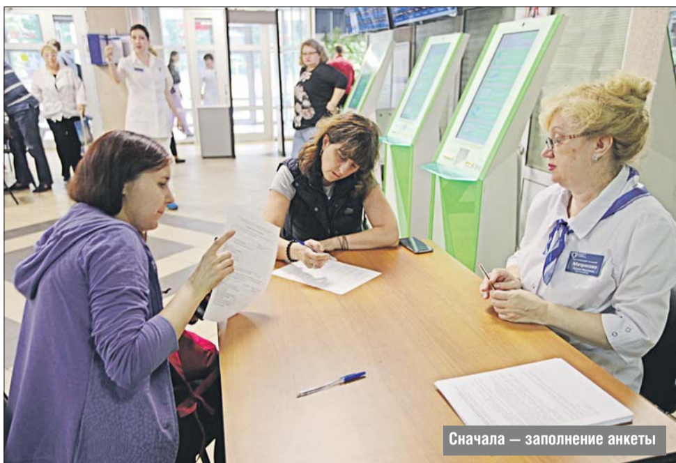
Сначала — заполнение анкеты

В Москве продолжается акция, организованная столичным Департаментом здравоохранения и Московским клиническим научным центром им. А.С.Логанова. Каждую субботу до 22 сентября в городских поликлиниках можно бесплатно и без направления пройти онкоскрининг — обследование, которое позволяет по анализу крови выявить предрасположенность или диагностировать на ранней стадии рак молочной железы и яичников у женщин и рак предстательной железы у мужчин. В минувшую субботу обследование проходило в поликлинике №12 на улице Академика Комарова. Там побывала корреспондент «ЗБ».