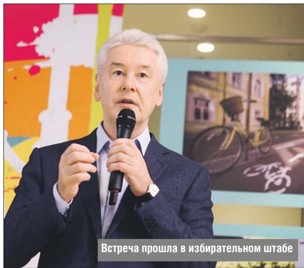
Встреча прошла в избирательном штабе

Кандидат на пост мэра высказал им свою признательность за их согласие «разде-