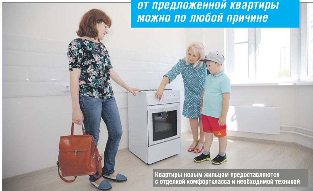
Квартиры новым жильцам предоставляются с отделкой комфорткласса и необходимой техникой