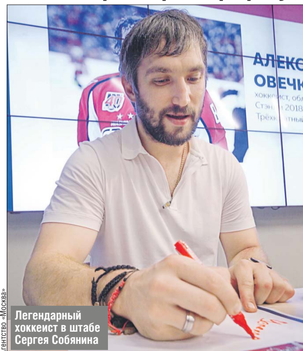
Легендарный хоккеист в штабе Сергея Собянина

Звезда мирового хоккея капитан клуба «Вашингтон Кэпиталз» Александр Овечкин сравнил командный дух в избирательном штабе кандидата Сергея Собянина с обстановкой в хоккейной сборной. Об этом спортсмен рассказал журналистам.