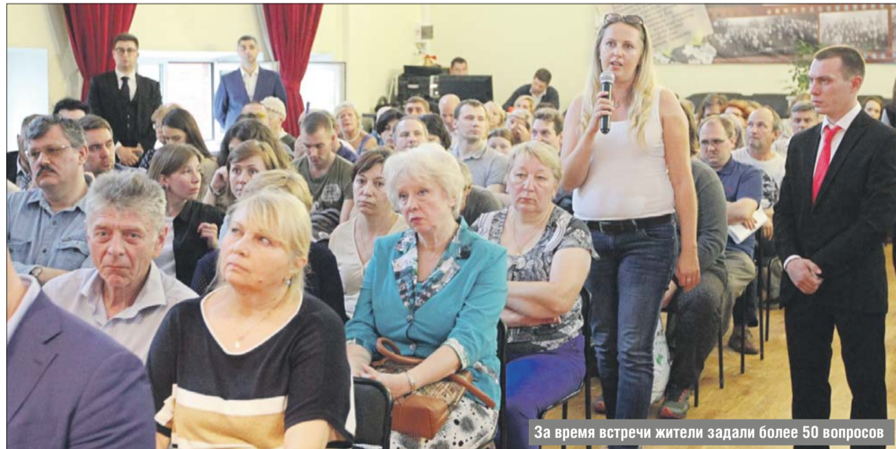
За время встречи жители задали более 50 вопросов

Жилой дом на Новосущёвской может быть сдан уже в этом году