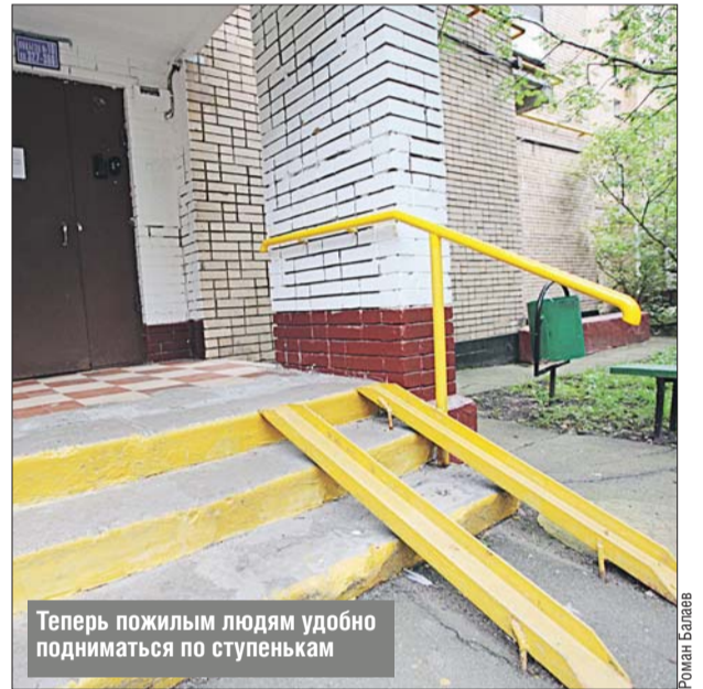
Теперь пожилым людям удобно подниматься по ступенькам

▶ Управа Бабушкинского района: ул. Лётчика Бабушкина, 1, корп. 1, тел. (495) 471-5519. Единый диспетчерский центр ЖКХ г. Москвы: тел. (495) 539-5353. Эл. почта: bshspr@svao.mos.ru . Сайт: babushkinsky.mos.ru