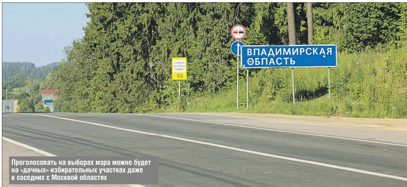
Проголосовать на выборах мэра можно будет на «дачных» избирательных участках даже в соседних с Москвой областях

— На всех так называемых дачных участках будут присутствовать квалифицированные наблюдатели. Таким образом, голосование на экстерриториальных участках будет полностью соответствовать московскому стандарту выборов, — отметил он.