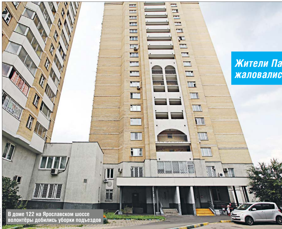
В доме 122 на Ярославском шоссе волонтеры добились уборки подъездов