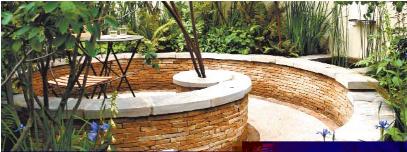
Этот садик признали лучшим в мире