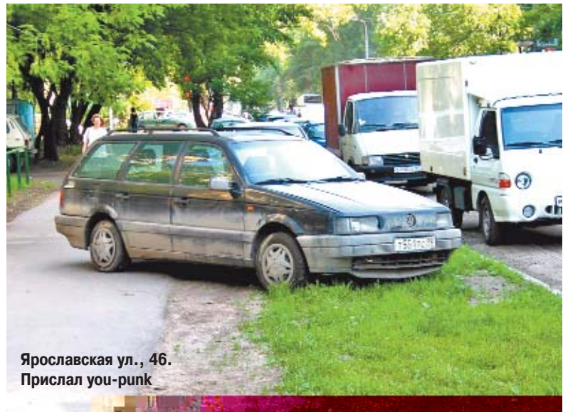
Ярославская ул., 46. Прислал you-runk