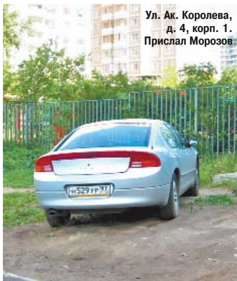
Ул. Ак. Королева, д. 4, корп. 1.