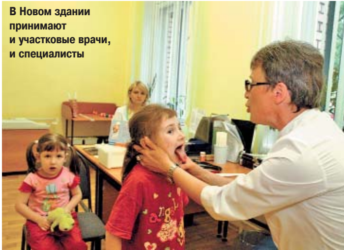
В Новом здании принимают и участковые врачи, и специалисты

25 мая в Марфине открылся филиал детской поликлиники №71. Сама поликлиника находится в Марьиной Роще, и раньше жителям района приходилось тратить много времени на дорогу туда и обратно. Теперь участковые врачи из 71-й, которые обслуживали район Марфино, будут принимать пациентов на Малой Ботанической улице в отремонтированном здании. Туда же перевели лора, окулиста, невропатолога, хирурга. Здесь можно будет сделать прививку и необходимые процедуры. Филиал 71-й поликлиники будет развиваться. Уже есть и помещение, и средства на создание здесь центра планирования семьи, а также эндокринологического центра со школой для больных диабетом.