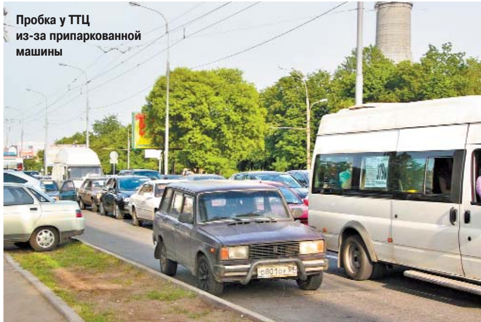
Пробка у ТТЦ из-за припаркованной машины