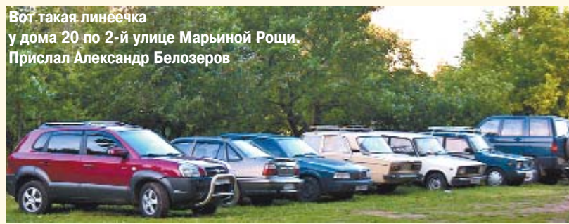
Вот такая линейка у дома 20 по 2-й улице Марьиной Рощи.

Ждем ваших снимков, писем и рецептов, как решить проблему — авто на газоне