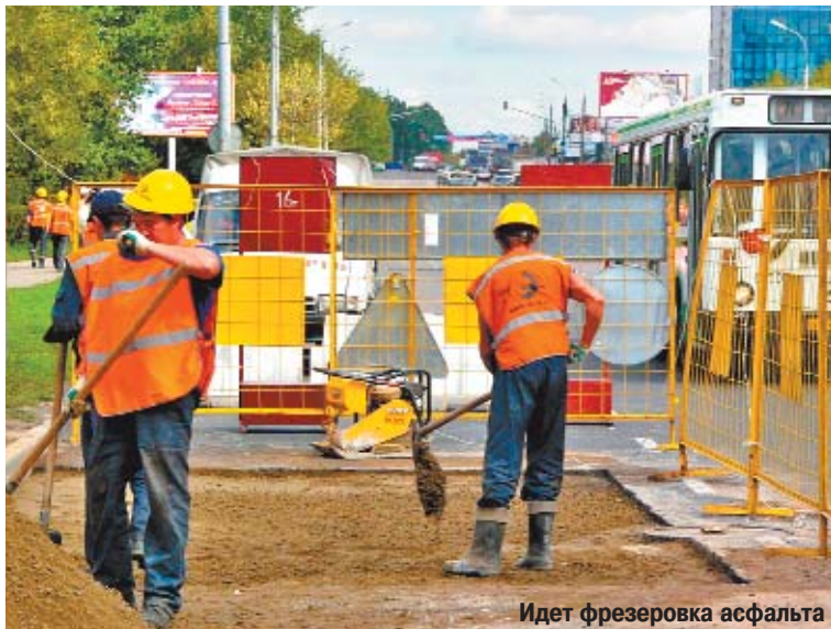
Идет фрезеровка асфальта

довольствоваться лишь проверкой пропусков в зоны, где движение грузовиков ограничено. Но пропускной режим действует только днем — он задумывался как средство от пробок. А дорогу надо беречь круглосуточно.