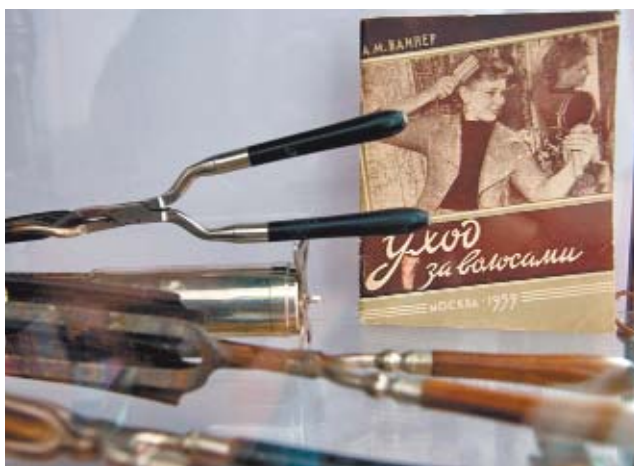
Старые инструменты парикмахеров впечатляют

В музейном зальчике представлена история парикмахерского искусства XIX и XX веков не только России и Европы, но даже Китая. Среди экспонатов — бритва, которой пользовался Лев Толстой, старинная китайская заколка, немецкая «шпицгрелочка» для закручивания волос, целый набор бритв на каждый день, которыми