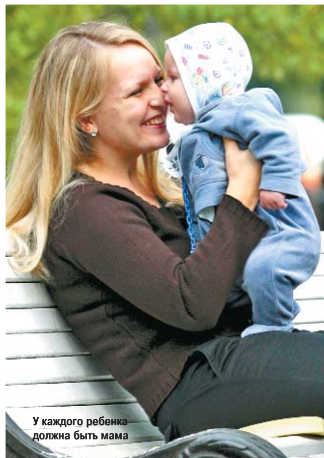
У каждого ребенка должна быть мама

Это последний, самый волнующий этап. После решения суда об усыновлении вы через 10 дней (а возможно, и непосредственно в день суда) сможете забрать уже наконец-то вашего ребенка.